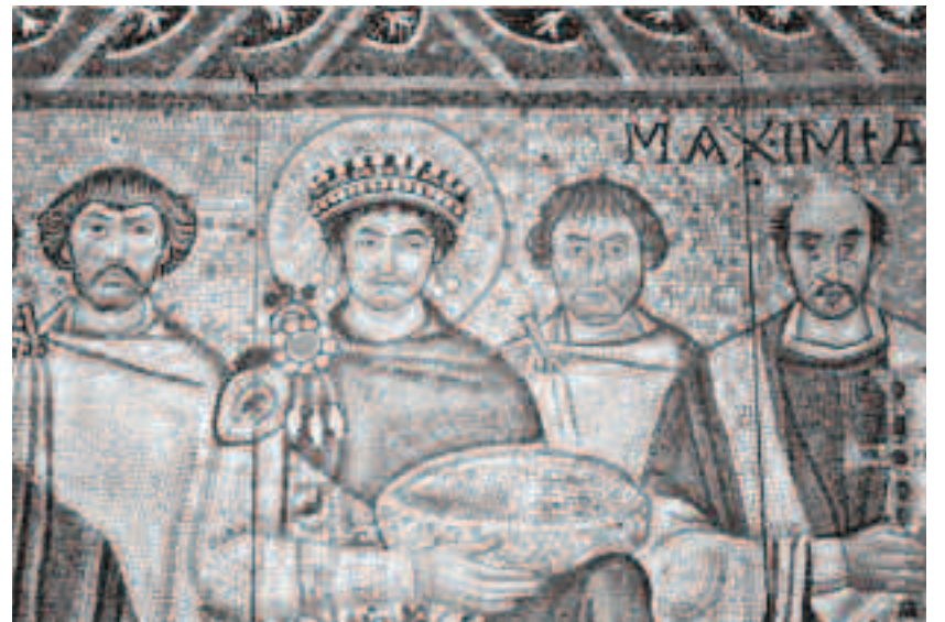
Mozaic, înfățișându-l pe Împăratul Justinian I