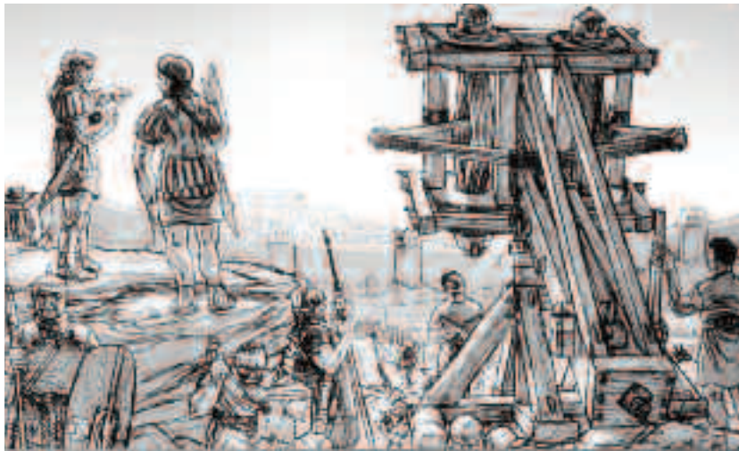
Romanii au fost, fără îndoială dintre puțini care au împins sfera tehnologiilor progresive și a dezvoltărilor tactice profunde care le-au afectat în mod direct eficiența pe câmpul de luptă

Betonul roman era considerabil mai slab decât omologul său modern, dar s-a dovedit remarcabil de durabil datorită rețetei sale unice, care a folosit var stins și o cenușă vulcanică cunoscută sub numele de pozzolana pentru a crea o pastă lipicioasă.