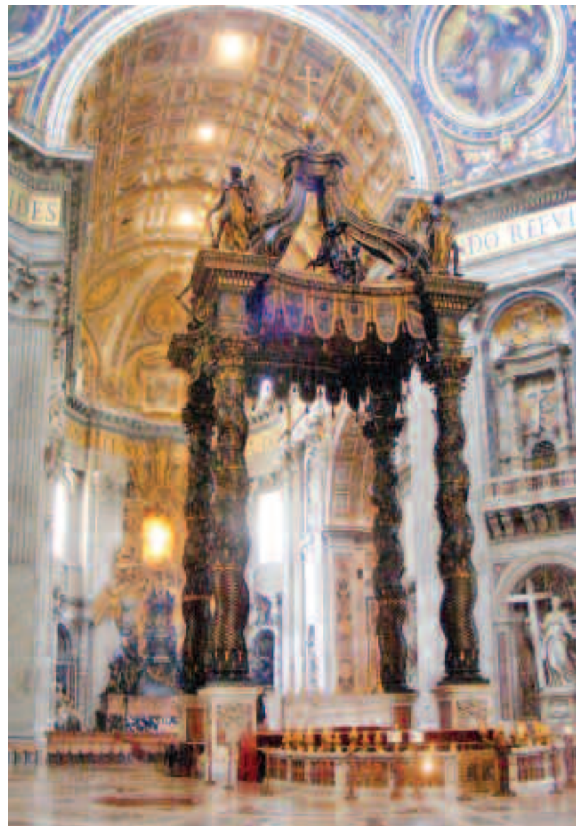
În mijloc, sub cupolă, se află altarul principal al papilor, dominat de un baldachin înalt de 29 metri, realizat în bronz de Bernini. În cele patru coloane de susținere a cupolei se află niște nișe ce conțin patru statui monumentale ale Sf. Andrei, Sf. Longinus, Sf. Elena și Sf. Veronica. În absida se găsește Scaunul episcopal al Sfântului Petru, susținut de statuile a patru sfinți învățători ai Bisericii: Sf. Ambrozie, Sf. Augustin, Sf. Atanasie și Sf. Ioan Gură de Aur