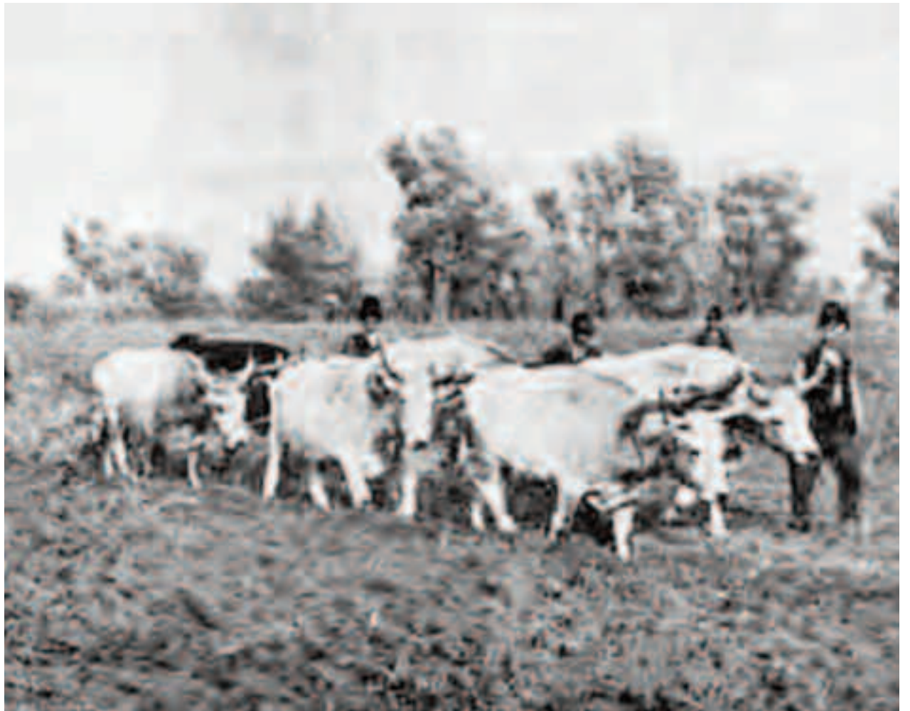
În primele zile ale lunii octombrie, agricultorii pregătesc ogoarele pentru sezonul rece care vine, pentru că pământul urmează a fi acoperit cu brumă

Dar acesta nu este singura prevestire de timp legată de luna lui Brumărel. În popor se mai spune că dacă în octombrie cade multă brumă și zăpadă, vom avea parte de o lună ianuarie moale și caldă. Dacă bubuie