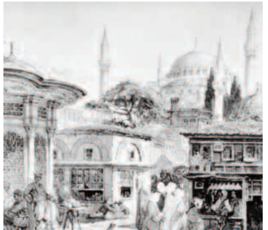
Stradă din Constantinopol, anul 1868

După ce în 1204 a căzut un acord pentru finanțarea expediției lor în Țările Sfinte, cruciații au efectuat un atac sângeros de Constantinopol, arzând orașul și ridicând o mare parte din comori, arte și relicve religioase. De asemenea, au sculptat o mare parte din Imperiul Bizantin în declin și au