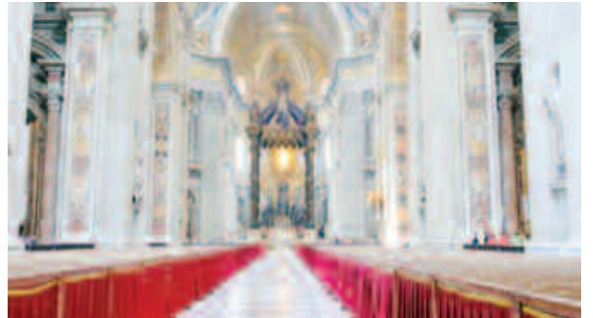
Edificiul, lung de 186 metri, înălțimea cupolei de 119 metri, și cu o suprafață totală de peste 15.000 m 2 , este cea mai mare biserică din lume. Bazilica Sfântul Petru este una din cele patru bazilici patriarhale din Roma

Edificiul este centrul catolicismului, dar și creștinii care nu sunt adepții acestui cult aleg să viziteze Biserica Sfântul Petru.