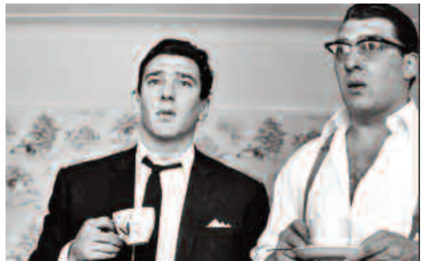
Ronnie și Reggie Kray fotografiați după ce au petrecut 36 de ore în interogatoriul poliției.

lea Charles George Gordon: „Gordon era ca mine, homosexual și și-a cunoscut moartea ca un om. Când a venit timpul să plec, sper că face la fel.”