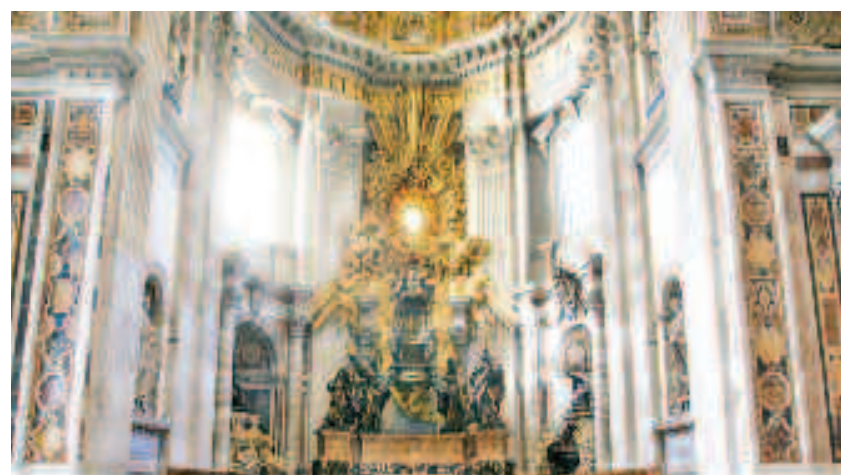
Bazilica "Sfântul Petru" este sediul principalelor manifestări ale cultului catolic și are o funcție solemnă cu ocazia celebrării sărbătorilor "Nașterii Domnului", "Paștelui", ritualurilor din Săptămâna Mare, proclamării noilor papi și funeraliilor celor defuncți