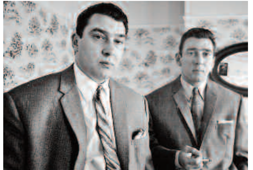
Gemenii Kray au fost închiși în închisoarea Shepton Mallet, cea mai veche închisoare din Marea Britanie, în anii 1950. În timpul șederii lor, gemenii s-au întâlnit cu viitorii rivali Charlie Richardson și George Cornell, pe care Ronnie Kray i-a împușcat ulterior

Într-un interviu cu autorul John Pearson, Ronnie a indicat că s-a identificat cu soldatul din secolul al XIX-