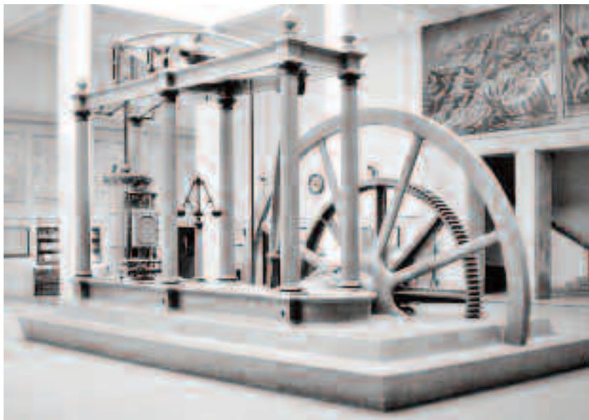
James Watt, împreună cu un industriaș britanic, Matthew Boulton, reușesc să creeze o întreprindere de fabricare a ceea ce se numea „mașina cu abur a lui Watt, îmbunătățită” (1774). Tot aici va realiza, împreună cu un alt inventator scoțian William Murdoch, un angrenaj de „convertire a mișcării verticale în mișcare de rotație” (1781)

În anii 1760, inginerul scoțian James Watt a început să lucreze cu unul dintre modelele Newcomen, adăugând un condensator de apă separat care l-a făcut mult mai eficient. Watt a colaborat mai târziu cu Matthew Boulton pentru a