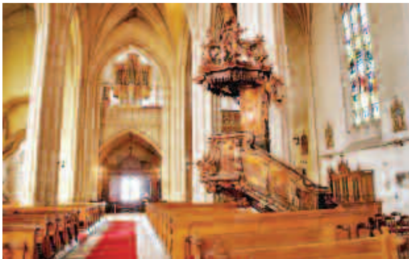
În biserica Sfântul Mihail din Cluj-Napoca au fost investiți principii ai Transilvaniei - Gabriel Bethlen, Sigismund Rákoczi, Sigismund Báthory și Gabriel Báthory