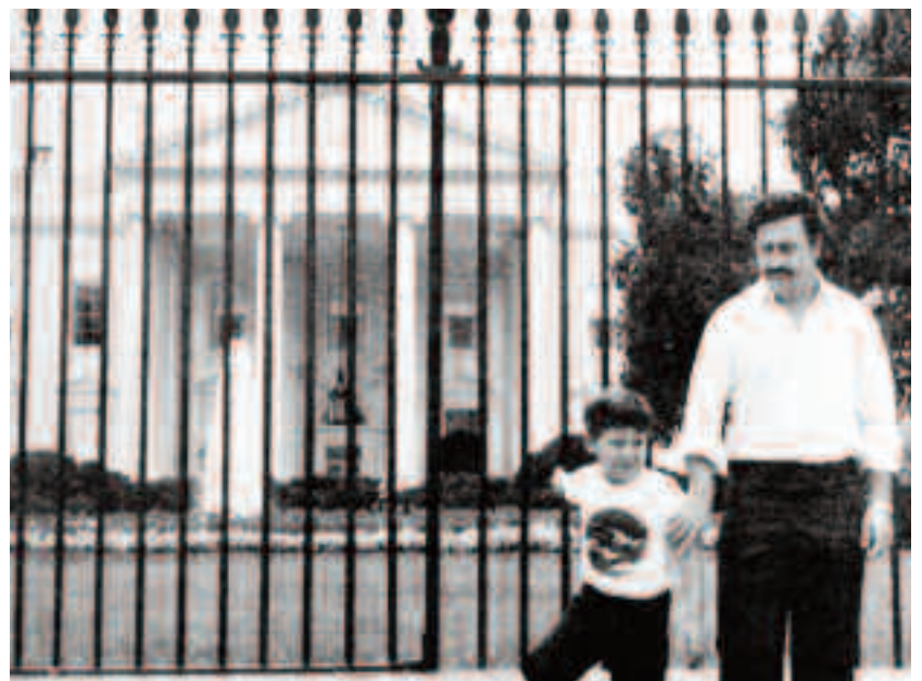
Pablo Escobar a rămas cel mai mare traficant de droguri din istorie. A fost căutat de toate serviciile secrete ale Statelor Unite, dar și-a permis să-și facă o poză de colecție, chiar în fața Casei Albe din Washington

aprins un foc din bancnote care însumau 2 milioane de dolari.