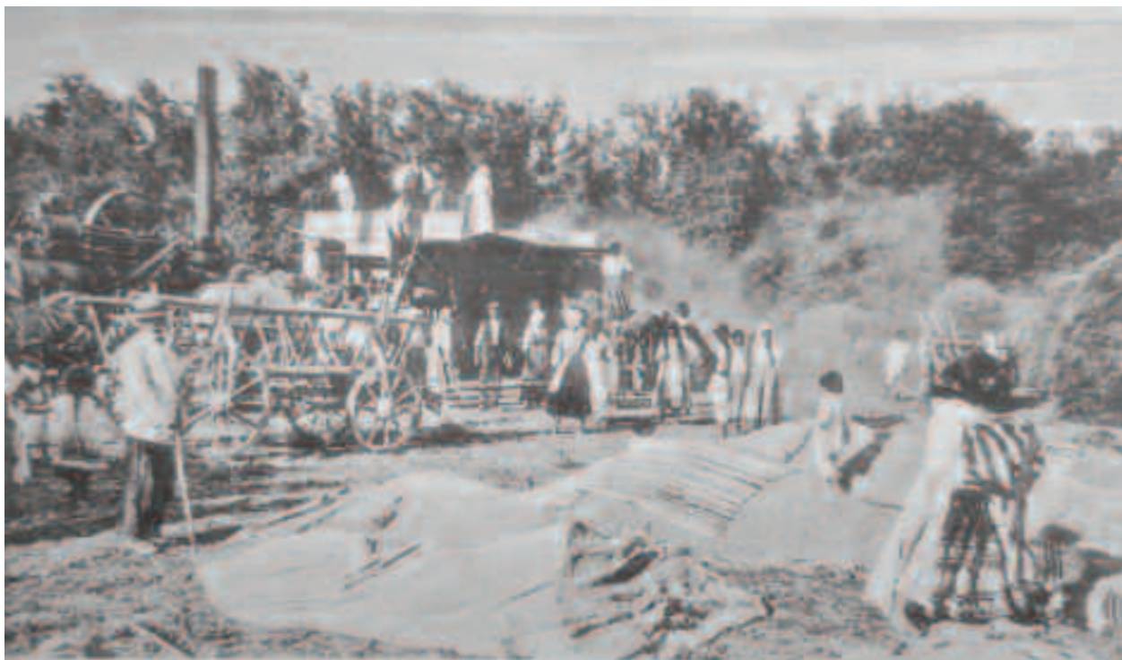
Potrivit legendei, Mioi s-a rugat lui Dumnezeu să-i mai dea câteva zile de vară, pentru a reuși să treiere grâul