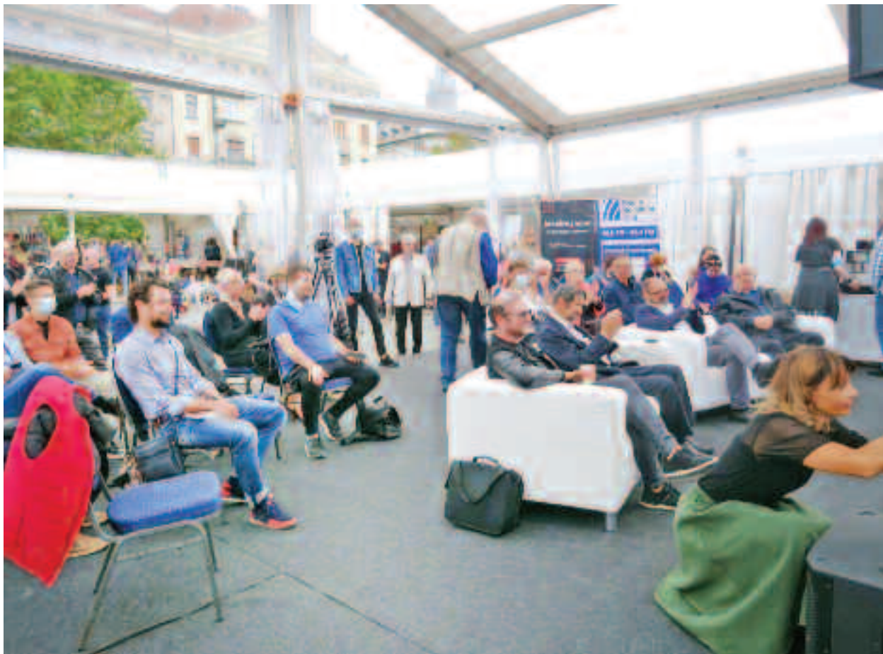
Lansarea a avut loc sâmbătă, 18 septembrie 2021

momentul de față o teză de doctorat dedicată lui Vasile Lucaciu, memorandistul, adică fratele celui despre care vorbim astăzi, și sigur, atunci când a pornit cu inițiativa de a propune o asemenea teză de doctorat, binevenitorii din jur i-au spus: "dar s-a scris totul despre Vasile Lucaciu". Ei bine, vreau să vă spun că domnia sa a descoperit lucruri totalmente necunoscute, totalmente inedite, și teza de doctorat, pe lângă faptul că aduce lucruri noi va fi și de o dimensiune consistentă, adică așa cum se cuvine unui militant, unui personaj care a lăsat urme adânci în istoria românilor din Transilvania, și de fapt din întreaga Românie.