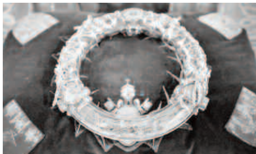
Coroana de spini se află în Catedrala Notre Dame din Paris

Templul a fost reconstruit, lemnul respectiv, care nu își mai găsea locul în noua construcție, ar fi fost lăsat într-o magazie lăaturalnică. Apoi, când s-a hotărât răstignirea lui Isus Hristos, iudeii ar fi luat acest lemn greu și nefolositor și ar fi făcut din el Sfânta Cruce.