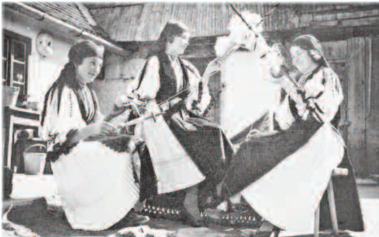
Femeile care nu lasă de-o parte caierele și încălcă interdicția de a toarce între zilele de 26 și 28 septembrie, vor atrage relele asupra gospodăriilor lor, asupra familiei și asupra animalelor din bătrână

Trebuie menționat și înțeles faptul că oamenii satelor au încheat un calendar