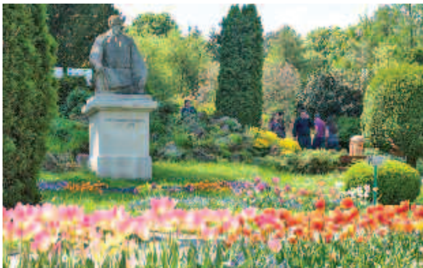
Grădina Botanică Alexandru Borza a reușit să se dezvolte în timp atât ca și un obiectiv turistic clujean cât și ca important spațiu didactic și științific din cadrul Universității Babeș-Bolyai

unanimitate de autoritățile locale în anul 1894. Arhitectul Lajos Pákey a realizat proiectul soclului statuii, reprezentând un bastion al zidului cetății Clujului.