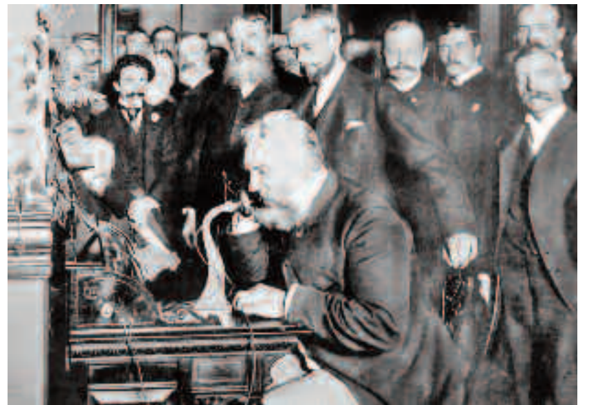
Pe 10 martie 1876, Alexander Graham Bell, inventatorul telefonului, a realizat primul apel telefonic, după ce, cu trei zile înainte, invenția a fost brevetată, cu doar câteva ore înaintea lui Elisha Gray, care a perfecționat și a făcut funcțional „aparatură de vorbit la distanță” construit în 1861 de profesorul german Johann Philipp Reis

Între timp, chiar dacă industrializarea a sporit producția economică în general și a îmbunătățit nivelul de trai pentru clasele medii și superioare, oamenii săraci și din clasa muncitoare au continuat să se lupte. Mecanizarea forței de muncă creată prin inovația tehnologică făcuse ca munca în fabrici să devină din ce în ce mai obositoare (și uneori periculoasă), iar mulți lucrători au fost obligați să