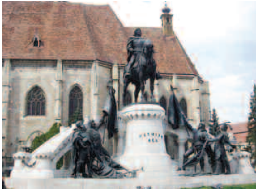
Statuia ecvestră a lui Matei Corvin se remarcă prin poziționarea tuturor celor patru copite ale calului pe sol, ceea ce, conform tradiției, înseamnă că personajul aflat pe cal a murit de moarte naturală, și nu în luptă

Ideea înălțării la Cluj a unei statui a lui Matia Corvin datează încă din 1882, an în care Consiliul Legislativ Orășenesc Cluj a stabilit executarea unui monument în cinstea marelui fiu al orașului. Macheta lui János Fadrusz a fost aprobată în