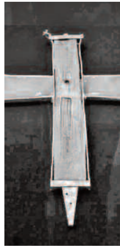
Bucată din Crucea Mântuitorului