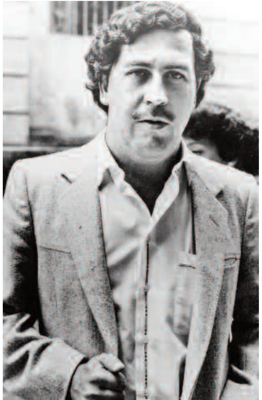
Pablo Emilio Escobar Gaviria a fost un celebru baron al drogurilor columbian, care la apogeul carierei sale deținea 80% din traficul de cocaină la nivel mondial. Supranumit „Regele Cocainei”, acesta a fost cel mai bogat criminal din istorie, cu o avere netă cunoscută estimată la 100 de miliarde de dolari

Țintele lui Escobar erau politicieni, ofițeri de poliție, forțele de siguranță ale statului, jurnaliști și reprezentanți ai justiției. Acești oameni au fost implicați cu forța în războiul declarat de Escobar pentru a preveni adoptarea unei legi care ar fi permis extrădarea traficantilor de droguri din Columbia în Statele Unite. Astfel, bombele, răpirile, tortura și asasinatela au devenit ceva obișnuit în statul sud-american. Într-o încercare de a ucide un candidat la președinție, Escobar a mers într-atât de departe încât a detonat un avion. Ținta asasinatului, Cesar Gaviria, care a fost ales președinte în 1990, nu s-a aflat la bordul avionului, însă alte 100 de persoane și-au pierdut viața.