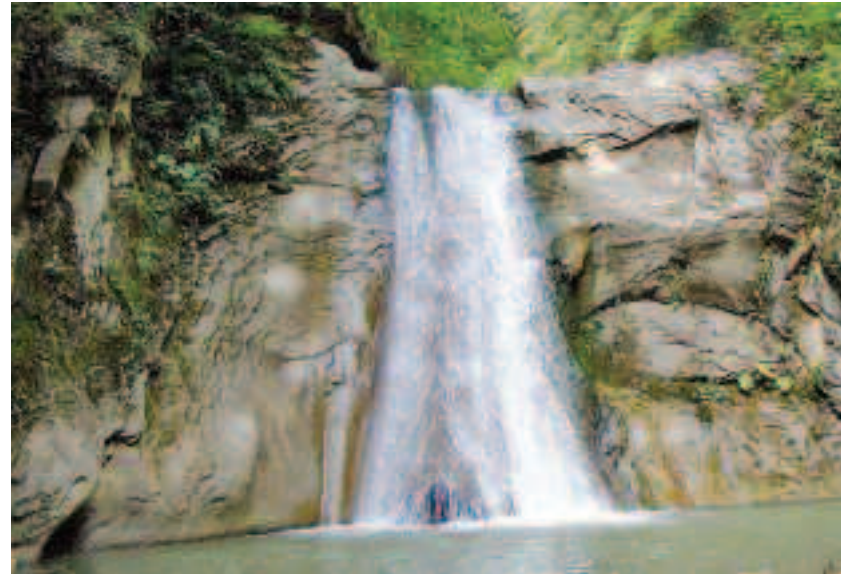
Cascada Prunca se află în județul Buzău, pe râul Cașoca