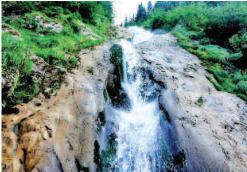
Cascada Cailor – Borșa, Munții Rodnei, Maramureș