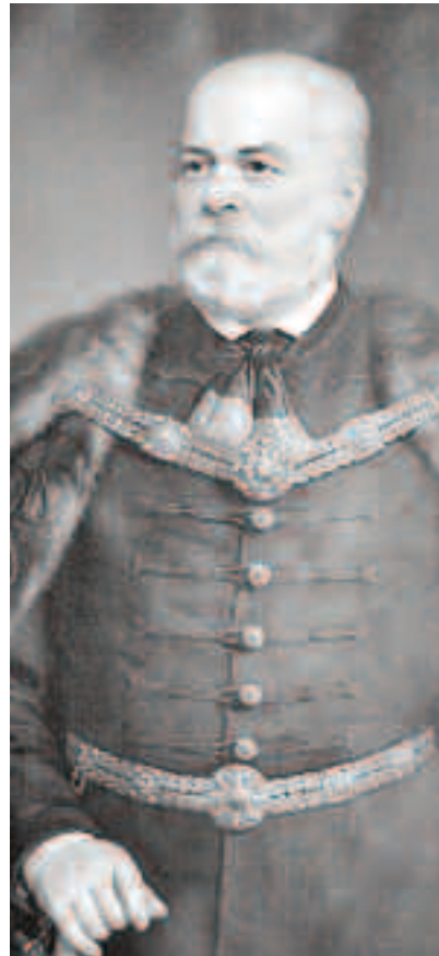
În anul 1848, în contextul izbucnirii revoluției pașoptiste și în Transilvania, E. Gojdu a căutat, împreună cu fruntași români din Banat și Câmpia de Vest, o soluție care să se potrivească Proclamației de la Blaj, din 3/15 mai 1848

Între anii 1998 și 2004 s-au purtat discuții între guvernul României și cel al Ungariei, încercându-se restituirea patrimoniului Fundației Gojdu. În octombrie 2005, prim-ministrul Tăriceanu și ministrul de externe Mihai Răzvan Ungureanu, semnează cu guvernul maghiar un controversat acord care prevedea înființarea - conform legislației ungare - a unei fundații publice româno-ungare Gojdu.