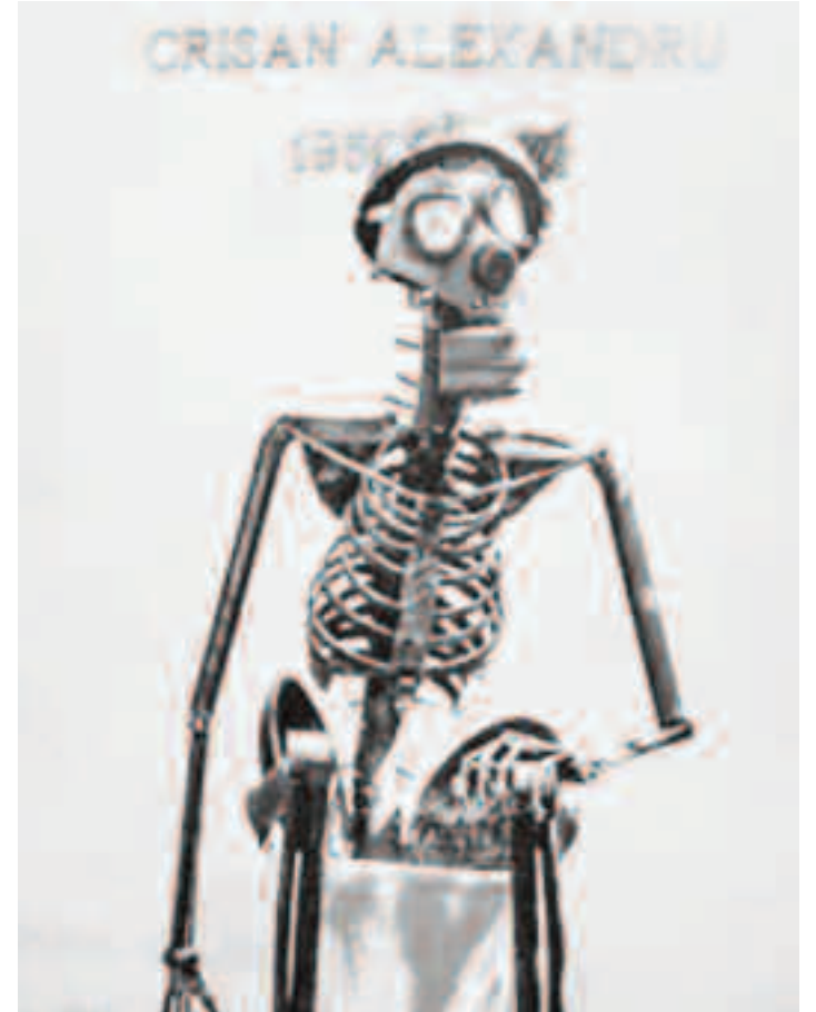
Alexandru Crișan, Ecce Homo, metal