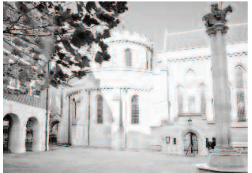
Biserica Templului din Londra construită de Cavaleri ca sediu în Anglia

Regele era deja îndatorat templierilor după războiul său cu englezii, și a decis să folosească zvonurile existente în propriul său scop. A început să pună presiune pe Biserică să acționeze împotriva ordinului, pentru a se elibera de datorii.