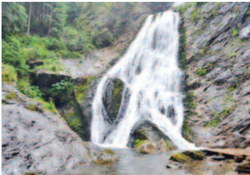
Cascada Răchițele numită și Vălul Miresei este situată pe Valea Stanciului

Cascada Prunca, cunoscută pe Internet și pe rețelele de socializare drept Cașoca (denumirea râului), frapează prin frumusețea ei. Este un obiectiv turistic apreciat deopotrivă de iubitorii muntelui și de fotografi, care găsesc aici priveliști desprinse parcă din scrierile lui Alexandru Vlahuță.