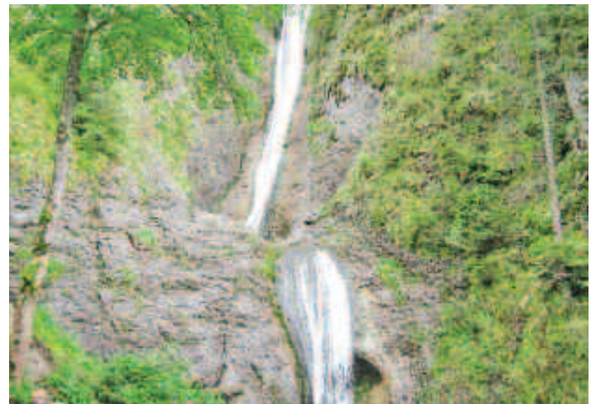
Cascada Duruitoarea este situată în județul Neamț pe teritoriul comunei Ceahlău

Se află la o altitudine de 1000 m și are o înălțime de 30 m și 2 trepte. La baza treptei de sus există o marmită adâncă cu diametrul de 10 m, care asigură o dispersie a apei, care seamănă cu un voal. De aici provine numele de Vălul Miresei.