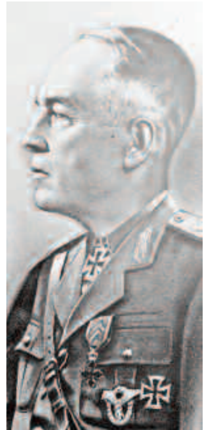
La 23 august 1944, regele Mihai I l-a demis prin decret regal pe Ion Antonescu, și a restaurat Constituția din 1923. Acțiunea de înlăturare fusese plănuită pentru 26 august 1944, dar ea a trebuit devansată, ca urmare a cererii de audiență la palat a mareșalului

După tratativele cu Ungaria de la Turnu Severin și cele cu Bulgaria, în urma cărora, prin arbitrajul de la Viena și tratatul de la Craiova, provinciile istorice Transilvania de Nord și Cadrilaterul au trecut sub suveranitatea Ungariei și Bulgariei, este chemat și numit președinte al Consiliului de Miniștri, în septembrie 1940.