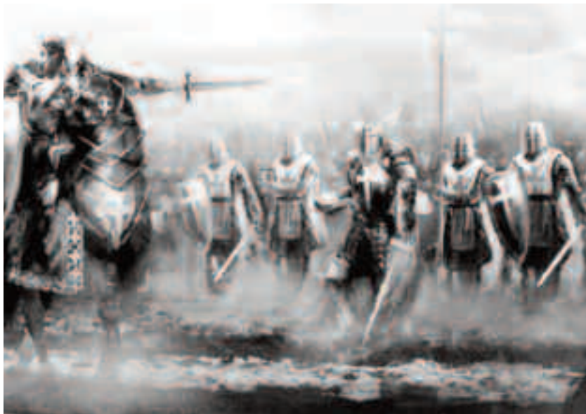
Misiunea Cavalerilor declarată era de a proteja pelerinii din Țara Sfântă

În același an a avut loc Conciliul de la Troyes, în urma căruia Ordinul a primit recunoașterea oficială. În 1130 Regele Aragonului din Spania a lăsat prin testament mari întinderi de pământ. Donațiile au devenit o practică folosită de