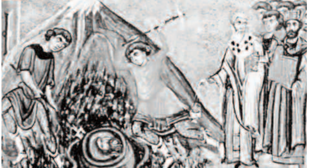
În ziua tăierii capului Sfântului Ioan este interzis cu desăvârșire să se taie ceva cu cuțitul, excepții de la aceste interdicții făcând numai femeile însărcinate

„În popor există numeroase legende despre Sfântul Ioan Botezătorul,, a menționat Marcel