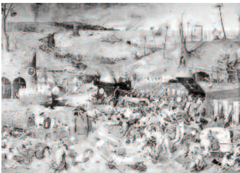
Nimic nu s-a comparat în Evul Mediu cu ciuma bubonică, teroarea care a înjumătățit Europa