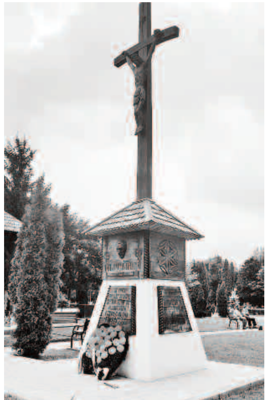
Ca centre de interes ale ansamblului sculptural sunt: Mântuitorul răstignit pe cruce, simbol al sacrificiului suprem al eroilor comunei și portretul în basorelief al lui Iuliu Maniu, simbol național al martiriului poporului român în perioada comunistă

Din iunie 2020 până la finalizarea și sfințirea acestui monument public, când a fost conferit comunității locale,