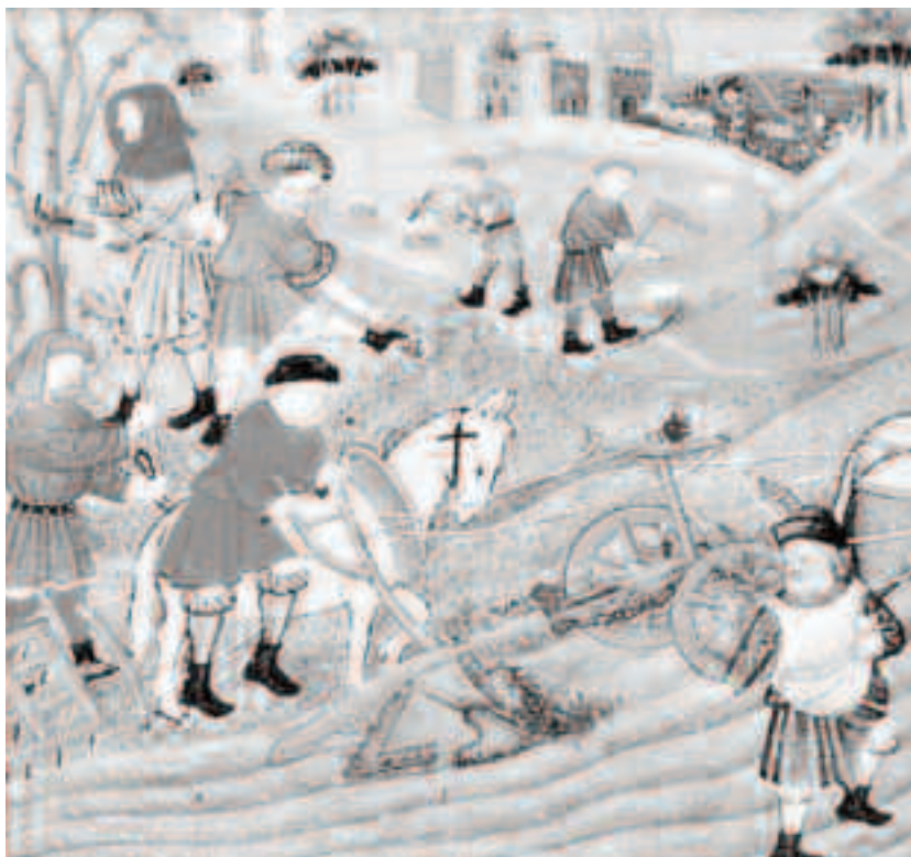
Țărani muncind pământul – Tablou de Gilles de Rome

Oamenii se deplasau dintr-un loc în altul în condiții de groază. În general oamenii se expuneau la foarte multe pericole. Lipseau spații de cazare curate, ei erau obligați să