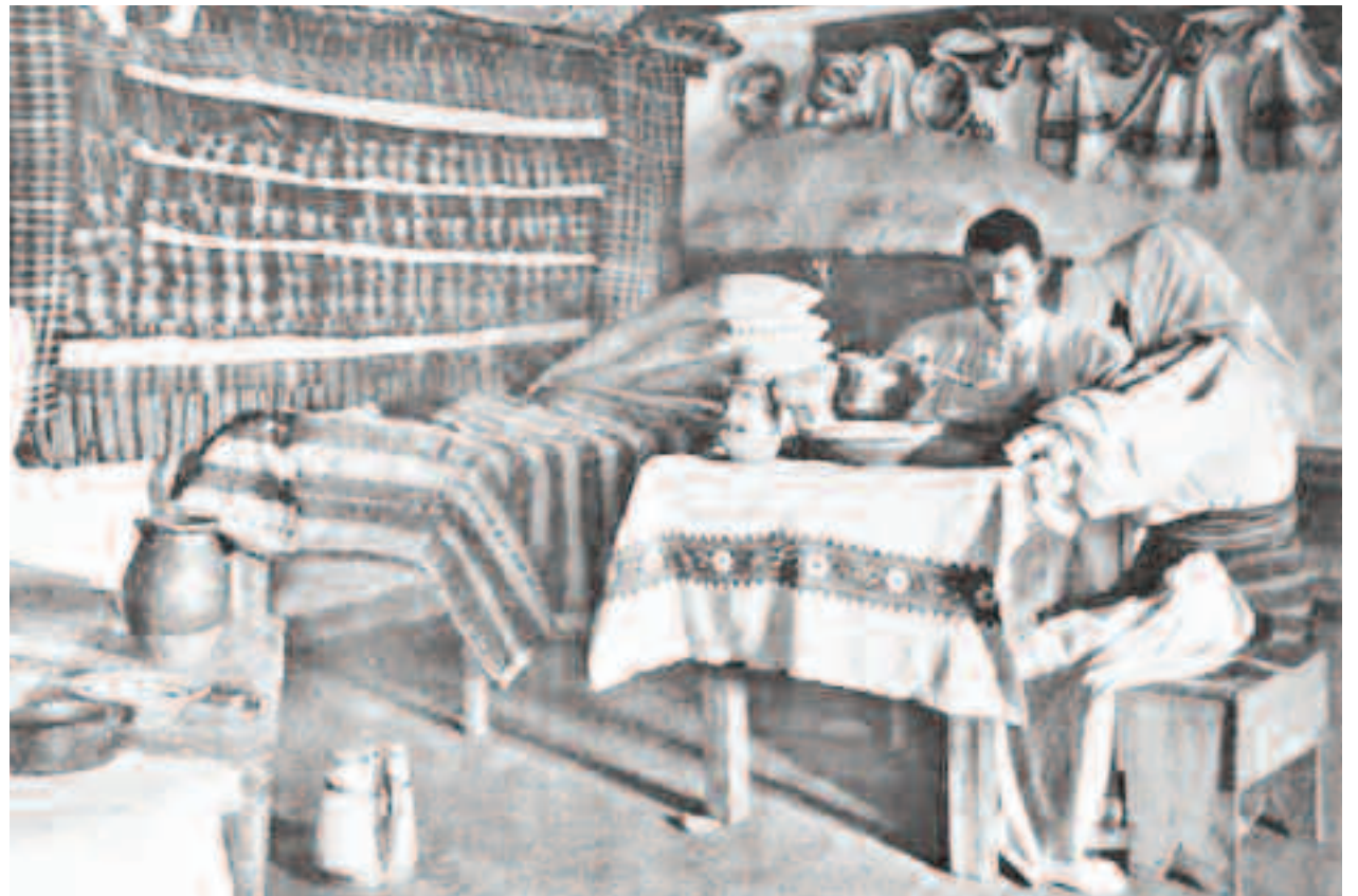
Se mai crede, din moși-strămoși, că dacă soții se certau în ziua de Ciurica, atunci ei vor avea parte de divergențe tot anul

El este cel care a adus Sfintei Fecioare Maria Vestea cea Bună a mântuirii.