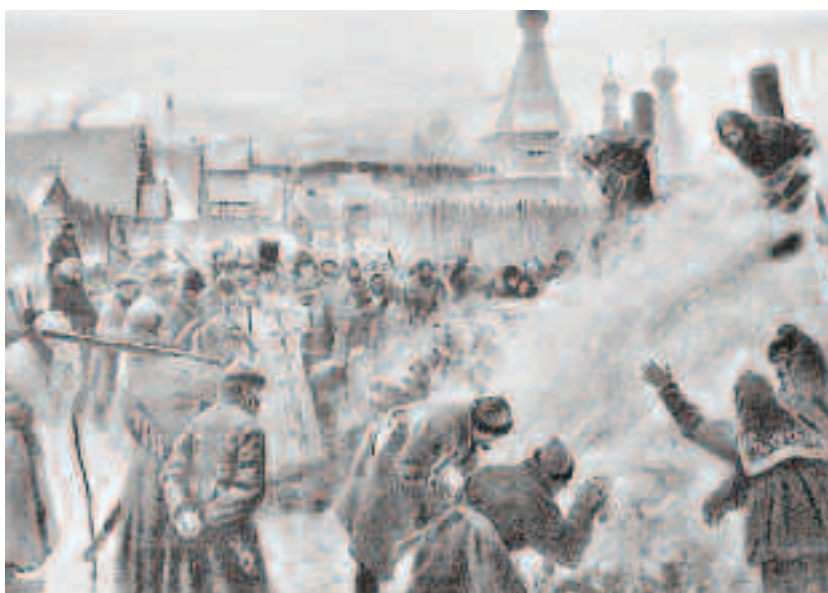
În Evul Mediu, putea fi periculos și să nu fii de aceeași părere cu ceilalți. Cei care aveau opinii teologice sau religioase diferite erau considerați eretici, oameni care se împotriveau învățăturilor creștine

doarmă noaptea sub cerul liber, iar pe timpul iernii riscau să moară de frig, unii pur și simplu înghețau. Ei călătoreau în grupuri pentru a se proteja de jafuri și crime.