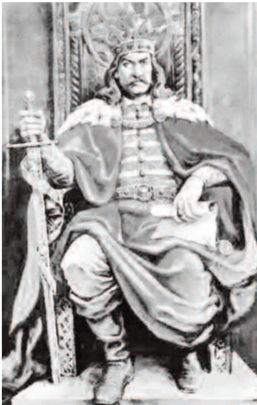
Marele Voievod Ștefan al Moldovei a fost fiul binecredincioșilor creștini Voievodul Bogdan al II-lea și Doamna Maria-Marina Oltea. Încă din copilărie a arătat o dragoste deosebită față de țară și credința strămoșească

Tot în această zi se mai sărbătorește și frații Cosma și Damian, cunoscuți sub numele de doftorii fără de arginți. Se spune că cei doi frați umblau și tătăduiau fără să ia plată. Se ține cu