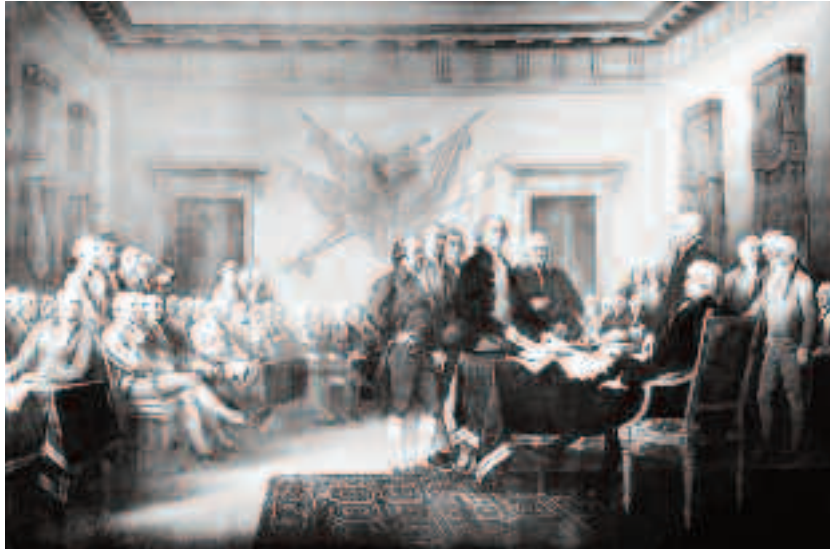
Pictură faimoasă a lui John Trumbull, adesea identificată ca o reprezentare a semnării Declarației, dar arată, de fapt, comitetul de redactare care prezintă lucrările sale Congresului

Primul este actul britanic puternic restrictiv, perceput de coloniști ca un act de opresiune, cunoscut sub numele de Intolerable Acts și care aproape a sugrumat auto-guvernarea coloniilor