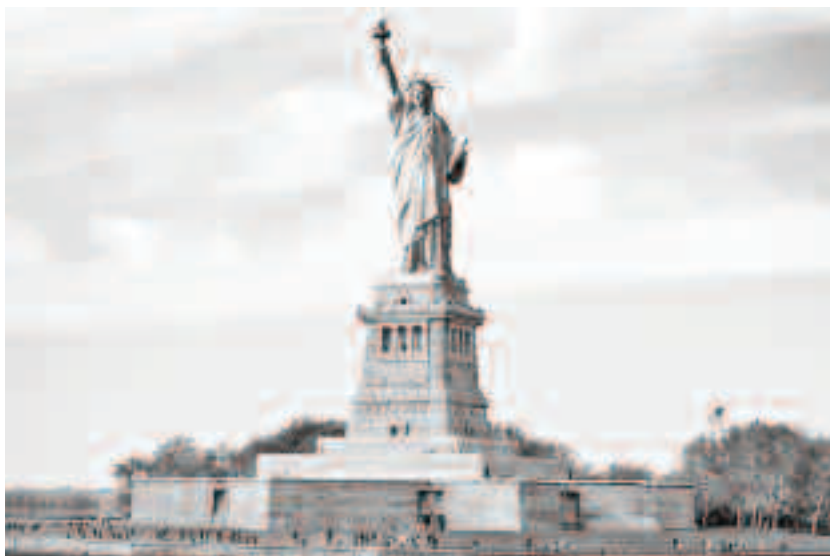
Statuia este un cadou al Franței făcut Statelor Unite ale Americii cu ocazia aniversării a 110 de ani de la câștigarea independenței Statelor Unite și inaugurată de președintele Grover Cleveland la 28 octombrie 1886