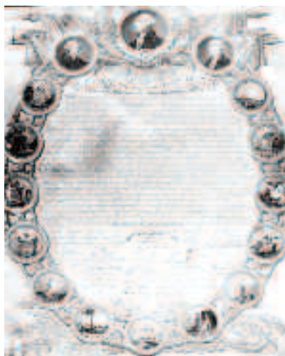
Tratatul de la Versailles din 1783, care confirmă în mod oficial independența statului american, reprezintă prima concesie făcută de către britanici față de colonii

americane ale Angliei. Cel de-al doilea este minunatul pamflet al lui Thomas Paine, intitulat Common Sense, publicat în ziua de 10 ianuarie 1776, care a avut un puternic rol de galvanizare a minților, sufletelor și mândriei coloniștilor, dându-le tuturor impulsul esențial de a trece de la cântărirea pragmatică a șanselor și a avantajelor și/sau dezavantajelor la radicala