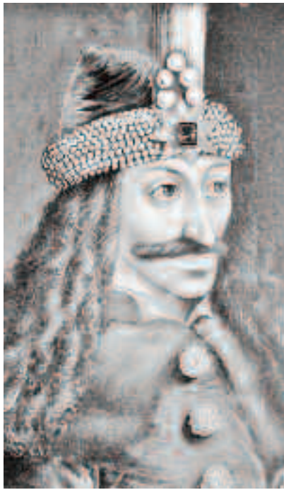
Vlad Țepeș, s-a îndrăgostit iremediabil de o fată de 17 ani pe care n-a putut să o uite pentru restul zilelor sale. A fost pe punctul de a incendia Brașovul în clipa în care a auzit că fata a fost bătută

Tot în 1432 în fruntea aceluiași turci, folosindu-se prin viclenie de titlul de cavaler al Ordinului, Vlad al II-lea Dracul a ordonat deschiderea porților Cetății Caransebeșului care, ascultând porunca, a fost incendiată și jefuită de aceiași turci conduși de Vlad al II-lea Dracul, jaf și pustiire