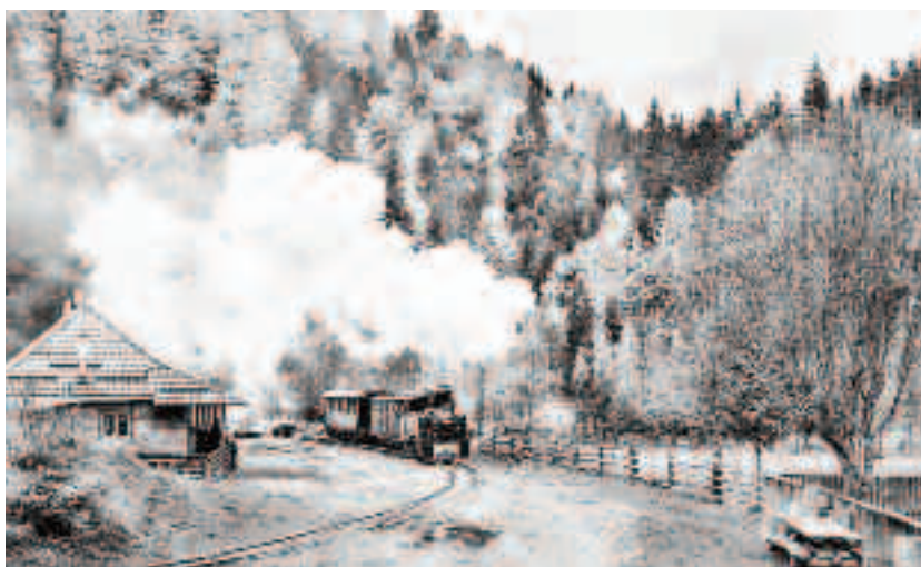
Mocănița de la Vișeu de Sus este ultima cale ferată forestieră cu abur din Europa care încă mai este folosită pentru transportul lemnului

Astfel, CFF Vișeu de Sus este singura din Europa care încă mai este