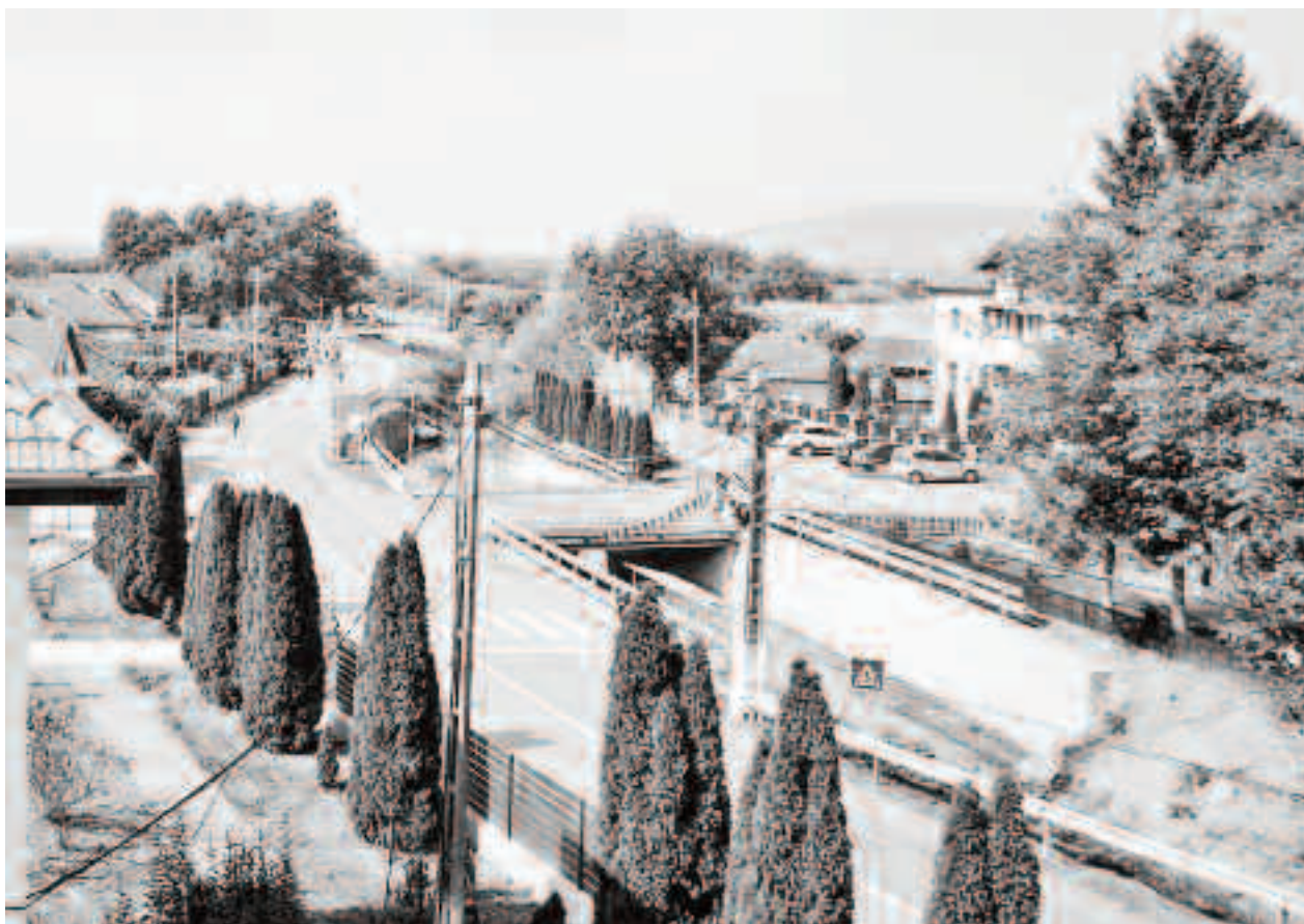
Manifestările dedicate celor 100 de ani ai Tarnei Mari se vor desfășura în aer liber în 4 iulie 2021 la bustul eroului satului și vor continua și în alte locații cu specific cultural