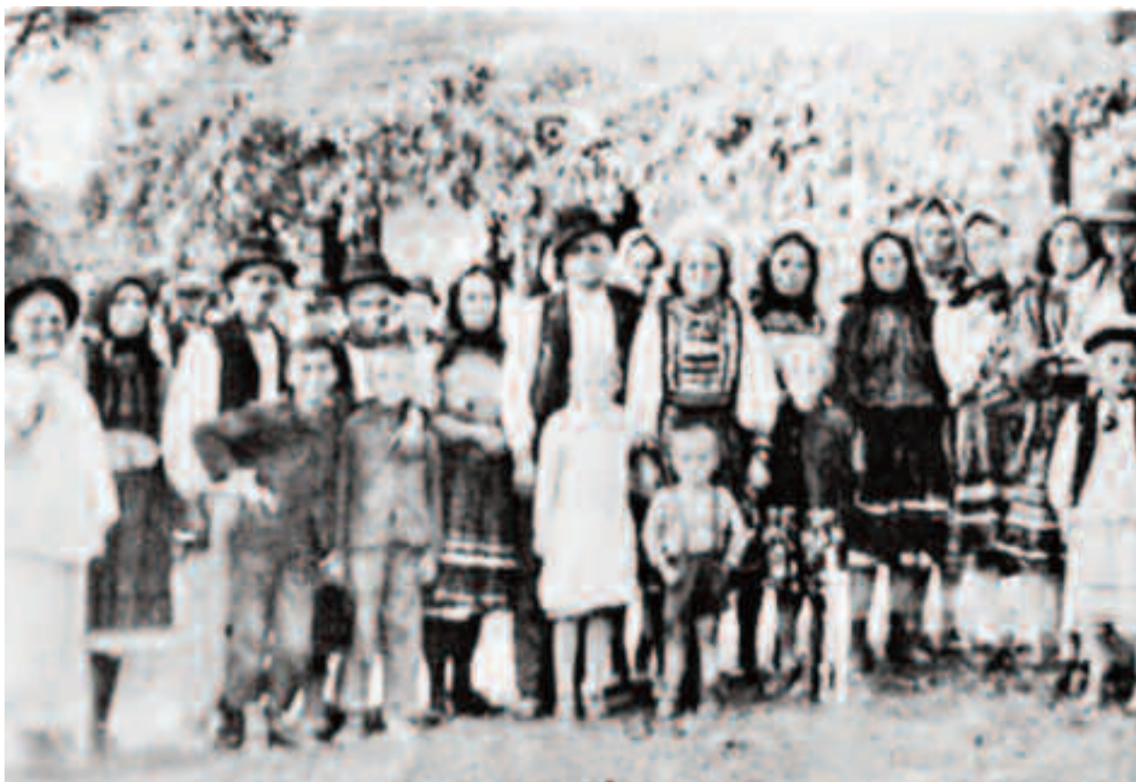
Nuntă din Târna Mare, anul 1930. Fotografie apărută pe coperta volumului „Târna Mare - istorie, legendă, adevăr”