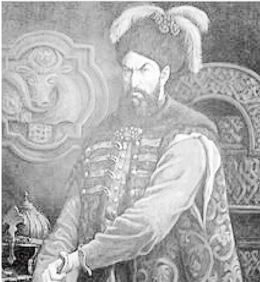
Pe plan intern, persecutată și chinuită cumplit pe boieri și clerici, de unde și supranumele de „cel Cumplit”

Hotărât în luarea deciziilor, scump la vorbă și necruțător la faptă, numai așa putea pătrunde și birui. A început astfel