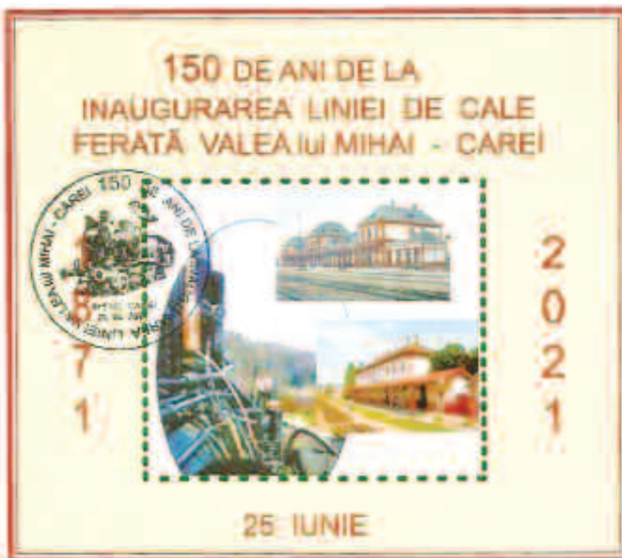
Coliță expusă în expoziția aniversară de la Carei PAGINA 6

Segmentul de cale ferată dintre frontieră (Dealul Bran) - Valea lui Mihai - Carei în lungime de 37 km a fost inaugurat în data de 25 iunie 1871.