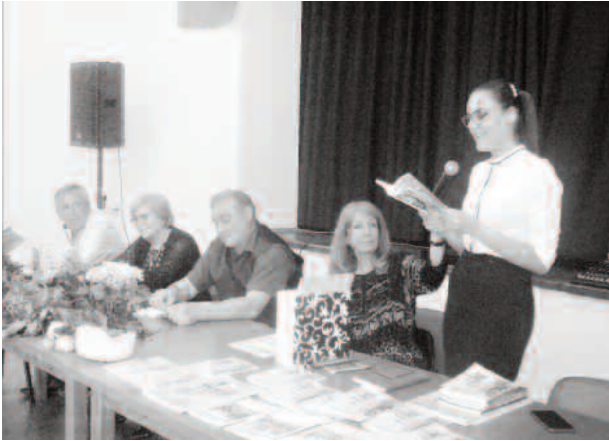
Lansarea volumului a avut loc vineri 18 iunie în Valea Vinului

Dovadă în acest sens stau parafrazele constructive și parafrazele creative pe baza versurilor lui Mihai Eminescu, Nichita Stănescu, Luican Blaga, Radu Gyr etc., cărora le imprimă o amprentă proprie, specifică