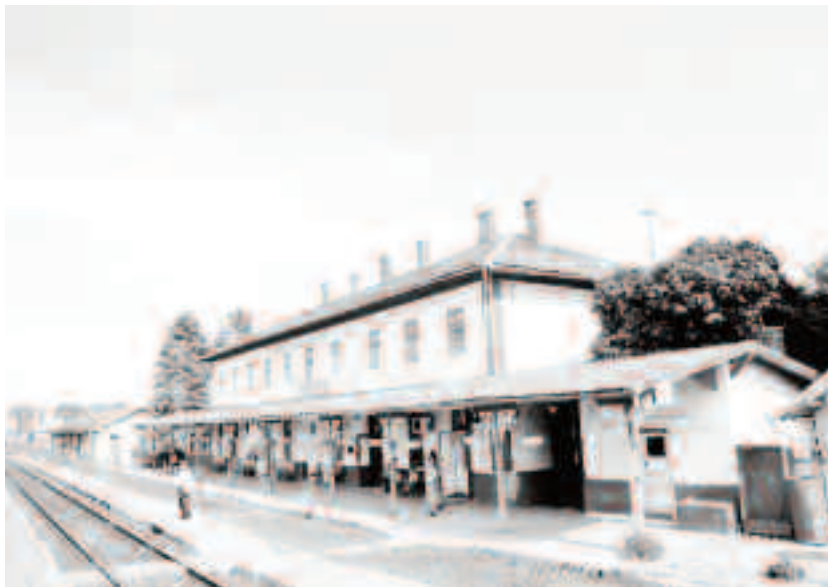
Actuala clădire a gării Carei a fost inaugurată pe data de 24 decembrie 1912

Prima localitate din Ardeal conectată la rețeaua de cale ferată spre vest, a fost orașul Oradea la data de 22 aprilie 1858 prin inaugurarea liniei