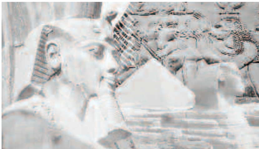
Se presupune că Ramses al II-lea a urcat pe tron în jurul vârstei de 24 - 25 de ani și a condus Egiptul din 1279 î.Hr până în 1213 î.Hr., domnia sa durând 66 de ani și 2 luni, conform scrierilor lui Manetho. Conform anumitor legende ar fi trăit 99 de ani, dar de fapt a trăit până la vârsta de 90 - 91 de ani

De altfel la moartea lor, faraonii din imperiul vechi aveau două morminte dintre care unul nu conținea mumiă defunctului rege, deci era cenotaf - dar exista un mormânt pentru Egiptul de Sud și unul pentru Egiptul de Nord pentru același faraon. De câte ori se produceau războaie, răzmerițe sau invazii străine, Egiptul avea tendința foarte netă să se despartă iarăși în cele două regate care renășteau fiecare sub alt faraon.