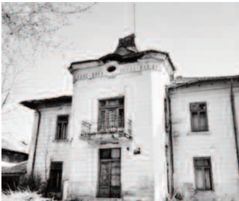
Această casă, demnă de niște adevărați boieri, se regăsește în centrul orașului Galați