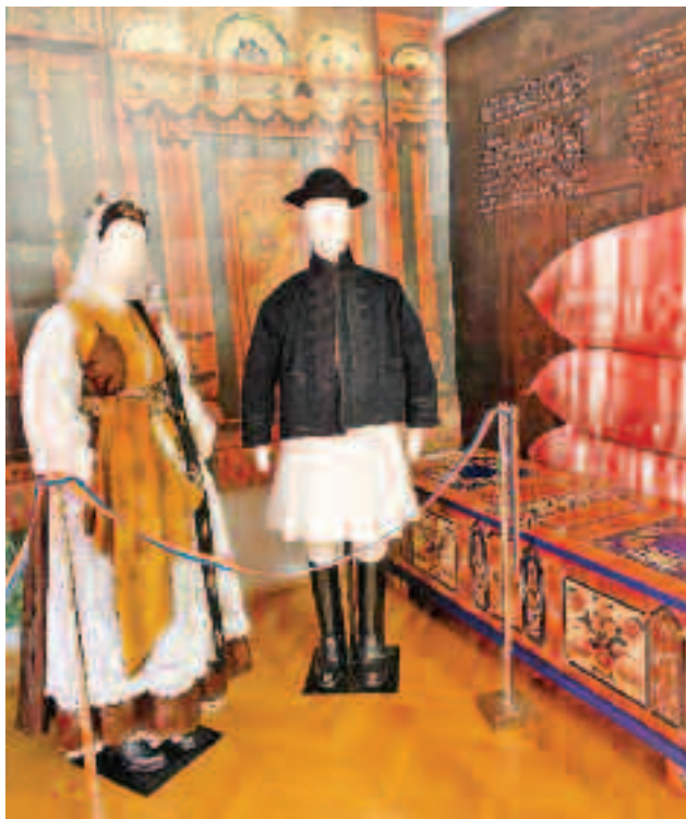
Costume de ceremonial sășesti Săcele, Țara Bârsei, accesorii și podoabe purtate la diferite ocazii

În secolul al XV-lea, prin ocupații precum oieritul transhumant, negoț sau cărăușie, românii din Șcheii Brașovului au atins un nivel de trai ridicat. Mai apoi, reușind să obțină favoruri și diferite privilegii de la sultani, domnitori sau țari, au lăsat de-o parte vechile în-deletniciri, astfel că au ocupat profesii precum scrip-