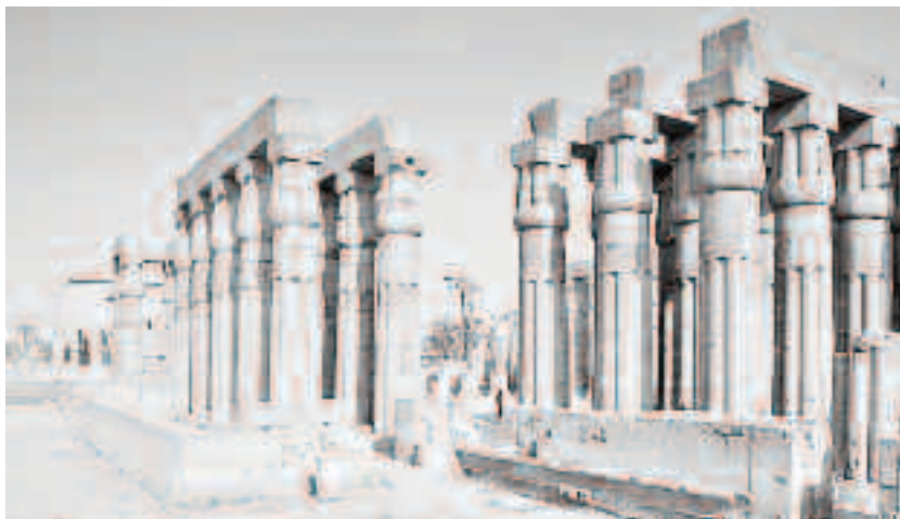
Capela templului Luxor a fost ridicată în timpul domniei faraonului Amenhotep III din dinastia a XVIII-a. Faraonul Amenophis III lasă să se clădească în timpul lui sanctuarul situat în partea sudică a templului, sala de coloane urmând să fie construită în timpul domniei faraonului Amenophis IV, când s-a renunțat la cultul lui Amon