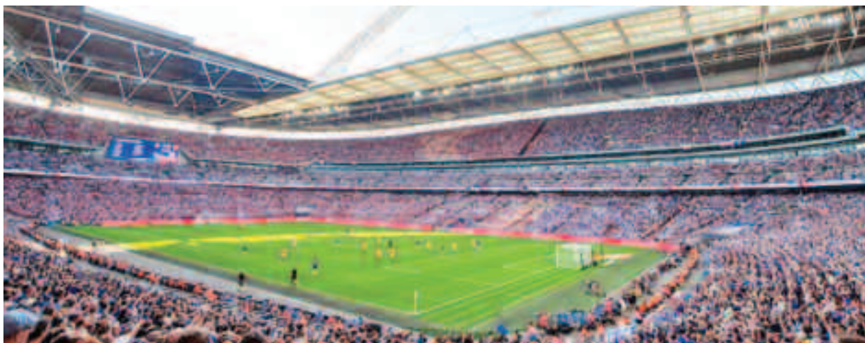
Stadionul Wembley din Anglia, locul în care se va ridica mult râvnitul trofeu în seara de 11 iulie

Este un campionat european inedit, pentru că se desfășoară în mai multe țări, din părți diferite ale bătrânului continent. EURO 2020, ediție aniversară, care celebrează 60 de ani de la primul Campionat European, se va desfășura în perioada 11 iunie - 11 iulie 2021. Competiția este găzduită, în premieră, de 11 orașe: București (România), Baku (Azerbaidjan), Copenhaga