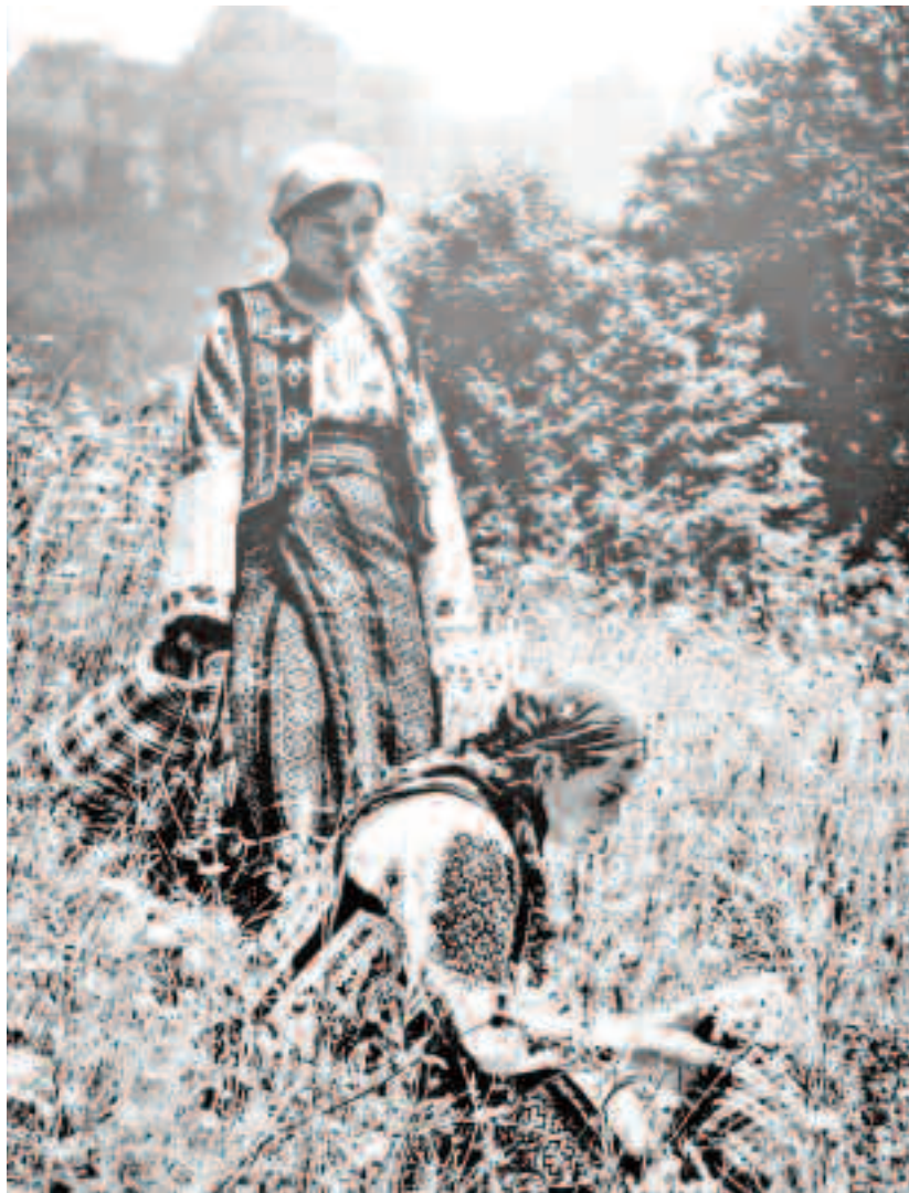
În perioada sărbătorii Înălțării Domnului nu e bine să se muncească, în schimb este permisă recoltarea ierburilor de leac

Tot în această perioadă apar și superstițiile legate de zilele de Crăciun. Dacă vor fi ploii multe, în perioada sărbătorilor de sfârșit de an vom avea parte de mult belșug.