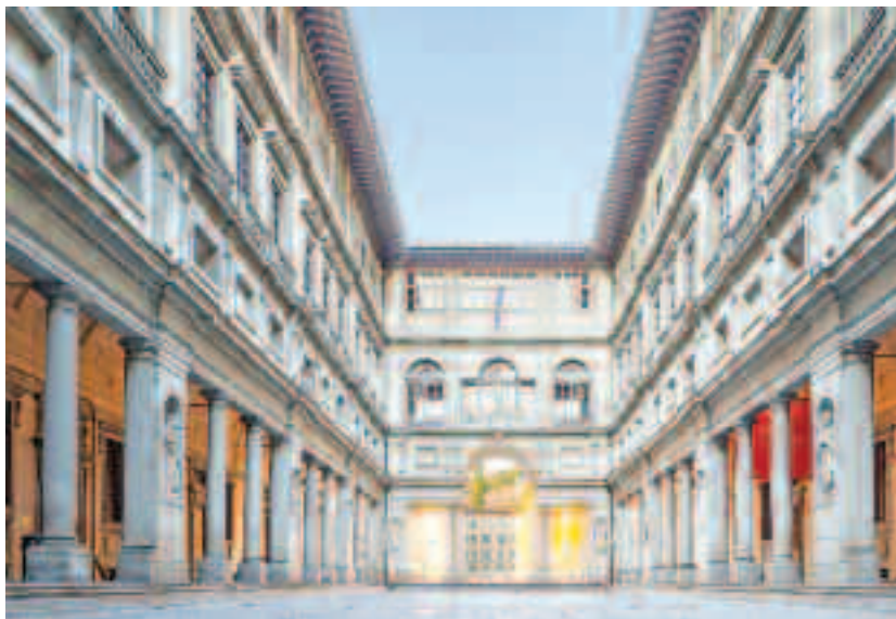
În 1565, chiar înainte ca Palatul Uffizi să fie terminat, Vasari a legat clădirea de cea învecinată numită Palazzo Vecchio și de Palazzo Pitti ce se afla peste râu, pentru că cei din familia conducătoare să nu fie nevoiți să iasă în exterior pentru a se deplasa între aceste clădiri. În 1583, Palatul Uffizi a fost legat și de terasa de la Loggia dei Lanzi, permițând Familiei Medici să participe la evenimentele din Piazza della Signoria fără a-și părăsi palatele