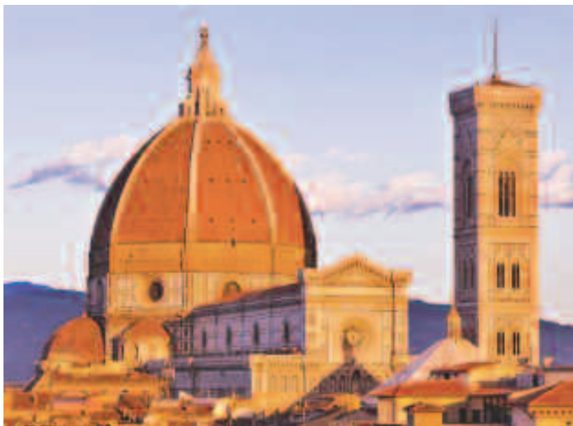
Domul Santa Maria del Fiore (Basilica di Santa Maria del Fiore) este fără îndoială unul dintre cele mai frumoase monumente, o construcție armonioasă cu bogate ornamente în piatră, a cărei cupolă domină panorama Cetății Renașterii, străbătută de străduțe medievale mereu pline de turiști uimiți de frumusețea și densitatea operelor de artă.

instituția Signoriei fiind piața cu același nume, anume, Piazza della Signoria, unde este situat și palatul. Palatul cu alură de fortăreață este dominat de un impresionant ceas cu turn care țășnește din acoperișul crenelat al Palazzo Vecchio, însă inventarul artistic interior al edificiului depășește aspectul său exterior în stil gotic. Mulți artiști renascentiști și manierști au fost convocați să contribuie la înfrumusețarea palatului, precum Leonardo da Vinci și Michelangelo (și care, cel puțin în parte, nu au reușit să își ducă la capăt sarcina din varii motive).