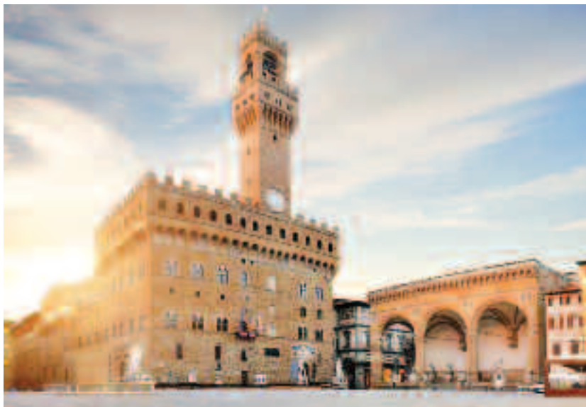
În prezent, Palazzo Vecchio servește drept Primărie, însă cea mai mare parte a sa a fost transformată în muzeu, ținând cont de uriașul patrimoniu artistic cu care este populat

Familia de Medici, ulterior ascensiunii sale în viața politică a Florenței, a obținut dreptul de a folosi palatul ca reședință și sediu. Numele actual al palatului datează din momentul în care familia Medici s-a mutat în partea de sud a râului Arno în Palazzo Pitti (la jumătatea secolului al XVI-lea); de aici fostul Palazzo della Signoria a devenit Palazzo Vecchio, singurul reper care aduce aminte de