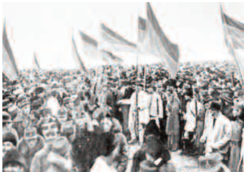
Marea Adunare Națională de la Alba Iulia din 1 Decembrie 1918

Caracterul profund popular al actului Unirii, amplele manifestări românești, au influențat pozitiv și minoritățile naționale, pentru a adera la acel act strălucit de la Alba Iulia, Capitala Unirii de la 1