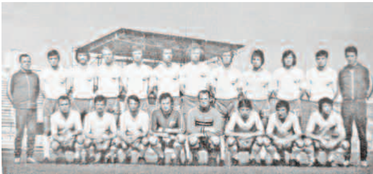
Anii 70, perioada de care se leagă cele mai mari realizări fotbalistice ale clubului sătmărean