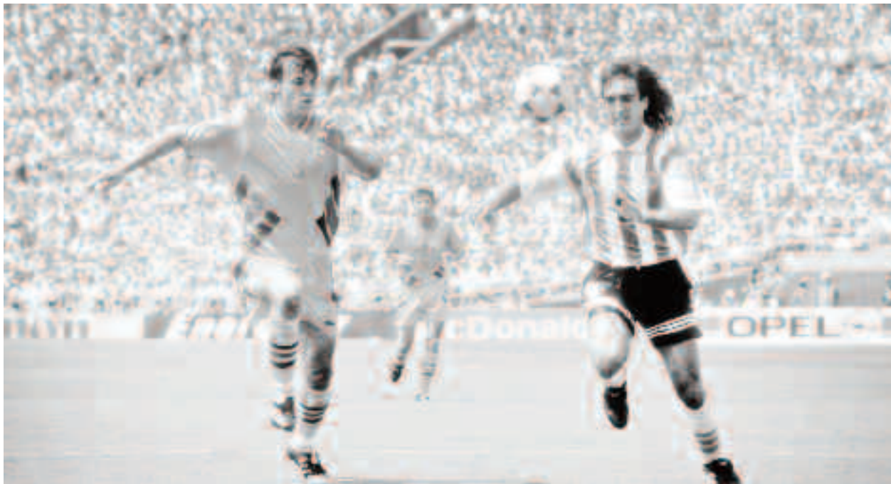
Daniel Prodan este cel mai valoros sătmărean care a jucat la FC Olimpia. Îl recomandă calitățile, realizările, numeroasele meciuri jucate în echipa națională a României, participările la C.M. și C.E., echipele de club la care a jucat etc.

Dar sub alte denumiri, impuse de vremurile noi în care s-a trăit în acea perioadă, Olimpia reapare în circuitul fotbalistic din România imediat după încheierea războiului, sub diverse denumiri: Someșana, Metalul, Sanitas,