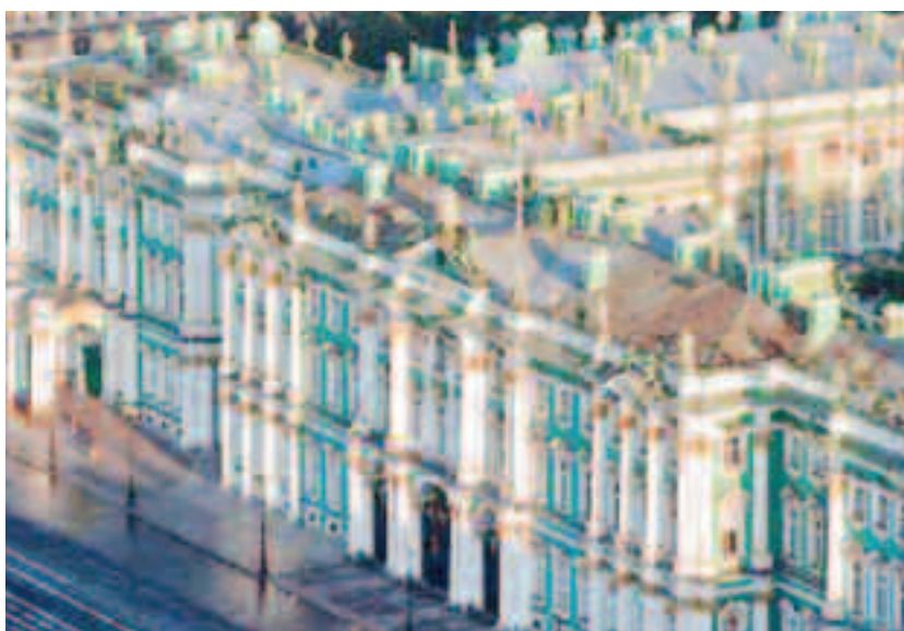
Membrii familiei imperiale nu au fost singurii locuitori ai palatului: sub cadrul metalic de la mansarde trăia o armată de servitori. Atât de vaste erau încăperile destinate servitorilor că un fost slujitor și familia sa, fără știrea autorităților palatului, s-a mutat sub același acoperiș