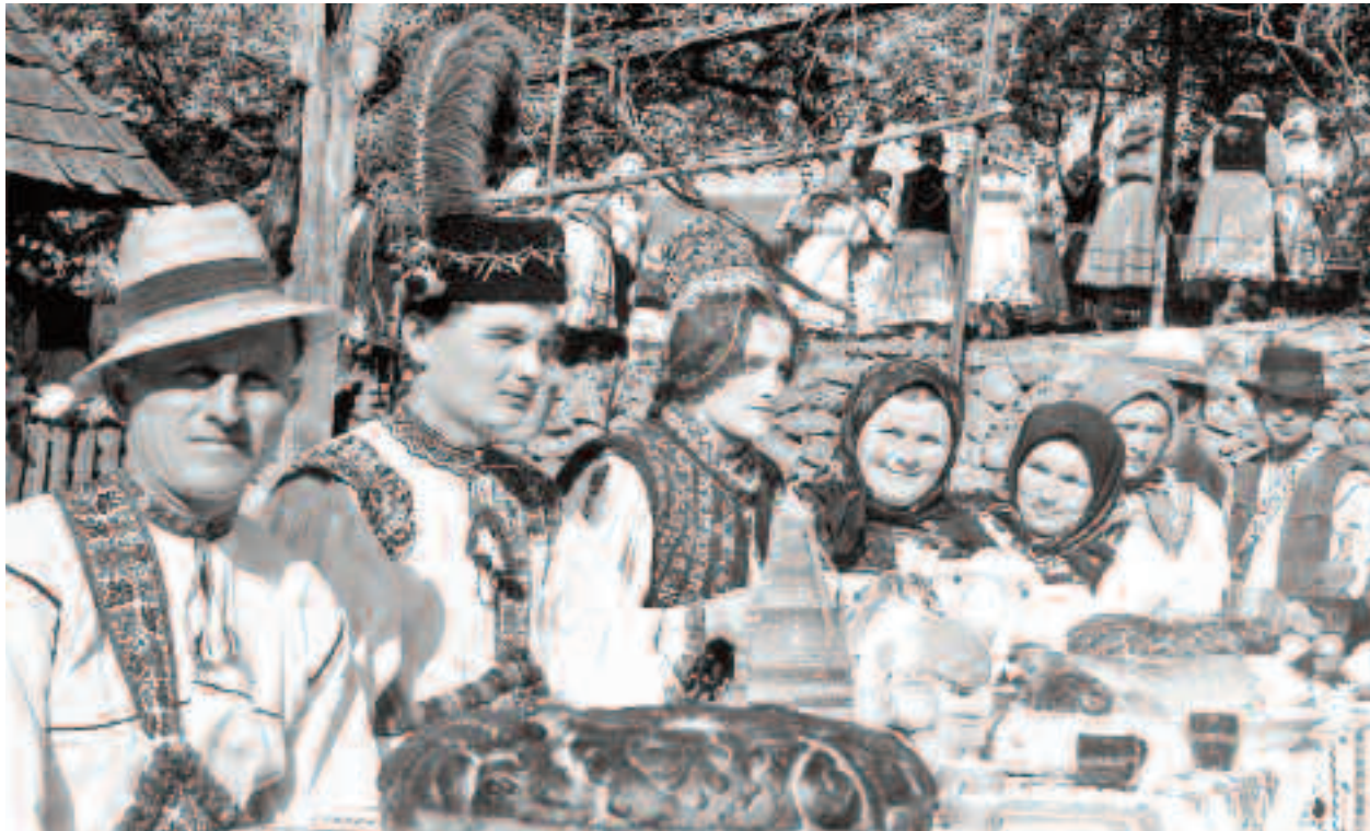
La nunta tradițională se mănca din blide de lut, cu linguri de lemn, și se bea vinul, pâlince sau apa din strachini de lut

Este un meșteșug care se moștenește în familie, mama predând secretele împletitului în plasă tinerei fete. Nuntă fără mireasă împletită nu există în Țara Oașului, nici în zilele noastre. La fel se