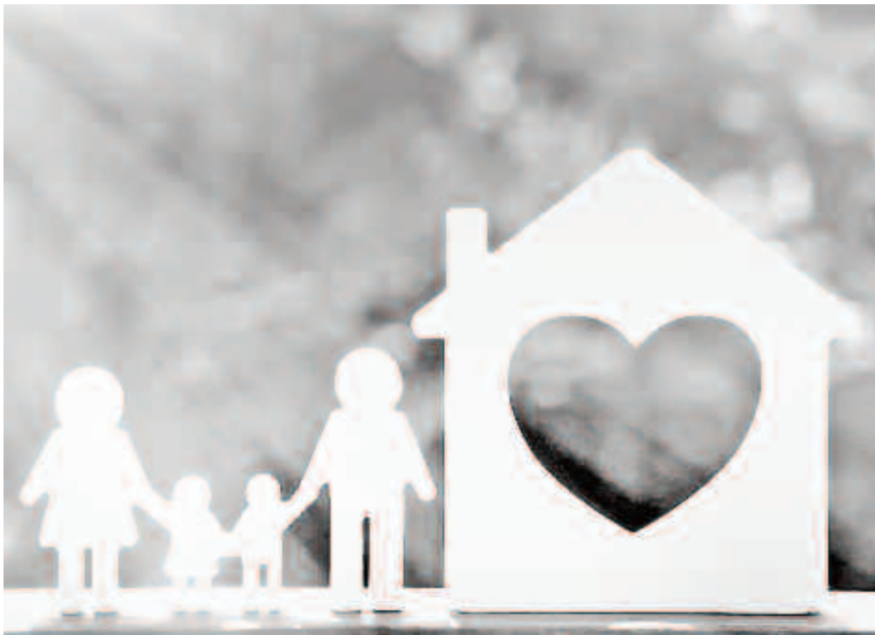
Privită sub aspect moral-creștin, familia este o instituție de origine divină stabilită de la Creație

Privită sub aspect sociologic, familia poate fi definită ca o formă specifică de comunitate umană, formată dintr-un grup de persoane unite prin căsătorie, filiație sau rudenie, care se caracterizează prin comunitate de viață, interese și înțelegere. Comunitatea socială familială are trăsături