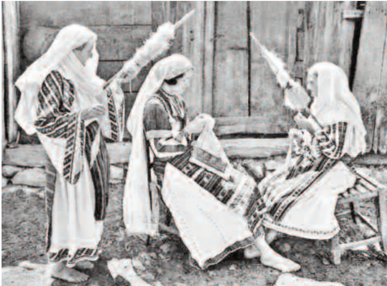
În prima săptămână din Postul Sfințelor Paști, fetele nu obișnuiesc, deloc să iasă din case, și mai ales pentru șezători. Preferă să lucreze în siguranță de acasă

În marțea vaselor se obișnuia ca vasele folosite în tot restul anului să fie