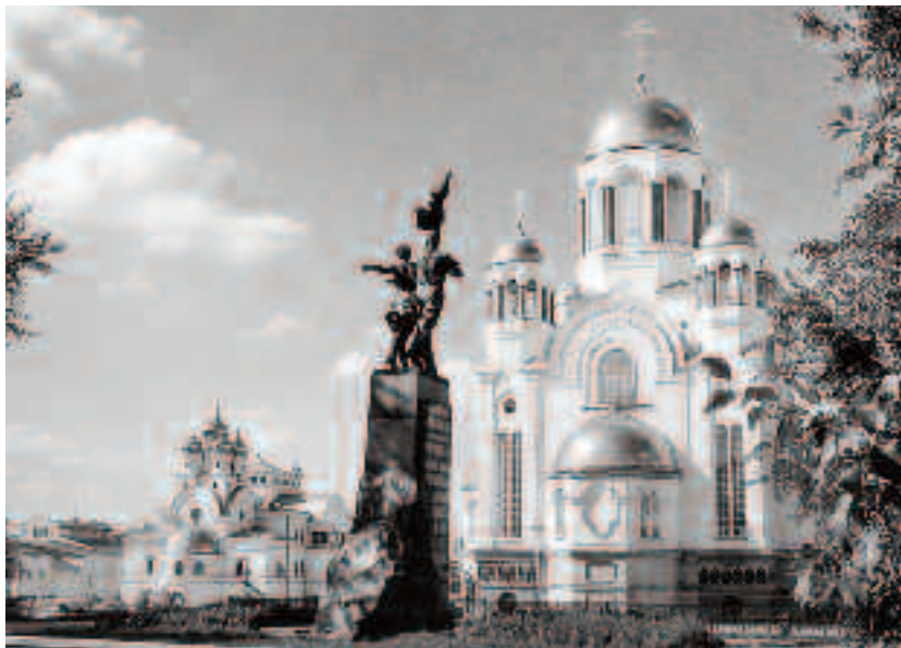
Biserica din Yekaterinburg, construită pe locul casei unde ultimul țar și familia sa au fost uciși

moștenirea Rurik și tronul în Timpurile turburi. Falsul Dimitri I l-a făcut metropolitan iar falsul Dimitri al II-lea l-a ridicat la demnitatea de patriarh. După expluzarea polonezilor din Moscova în 1612, Zemsky Sobor a oferit coroana rusească mai multor prinți Rurik și Gedimin, însă mulți dintre ei au refuzat onoarea.