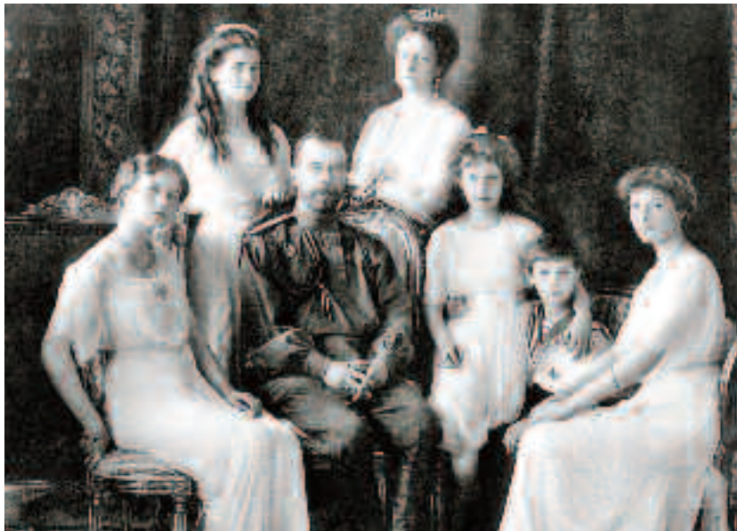
Țarul Nicolae al II-lea alături de soția sa, țarina Alexandra, și cei cinci copii, Olga, Tatiana, Maria, Anastasia și Alexei

Averea Romanovilor s-a schimbat dramatic odată cu căderea dinastiei Godunov, în iunie 1605. Ca fost lider al grupului anti-Godunov și vărul ultimului țar legitim, Filaret Romanov a fost căutat de impostorii care au încercat să pretindă