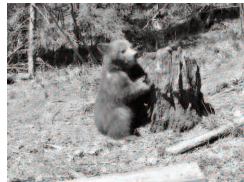
Oamenii de la sate puneau schimbarea vremii pe seama schimbării comportamentului ursului, numit în popor Al Mare sau Martin

din Frigia (Asia Mică). Încă de tânăr va săvârși două minuni: a oprit invazia lăcustelor asupra locurilor natale; a izgonit demonii arătați în chip de câine negru cu ochii de foc, din trupul ficei împăratului roman Gordion. Și-a săvârșit pașii în cărările Domnului, la 250, în vremea împăratului Decius, aprigul prigonitor al creștinilor, „pe ger și omăt greu”.