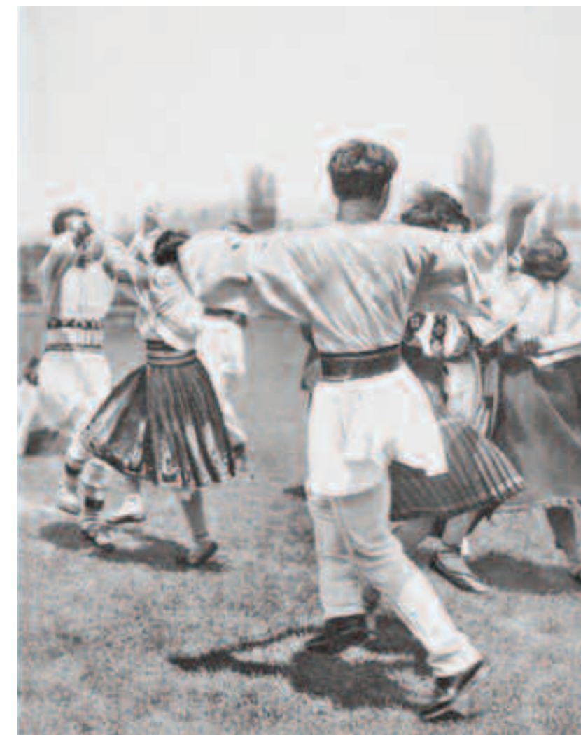
După rugăciunea adresată Sfântului Trifon urmează și un ospăț în capul viei, plin de voie bună și veselie

Locuitorii satelor obișnuiau să urce pe colinele podgorenilor, consacrați cu corzi de vie, să ocolească plantația (de unde și denumirea de târcolit). Corzile de vie erau tăiate în cruce și apoi afumate, după care urma dezgroparea sticlei de vin care s-a îngropat cu un an în urmă. În acest timp, se obișnuiește a se spune o rugăciune.