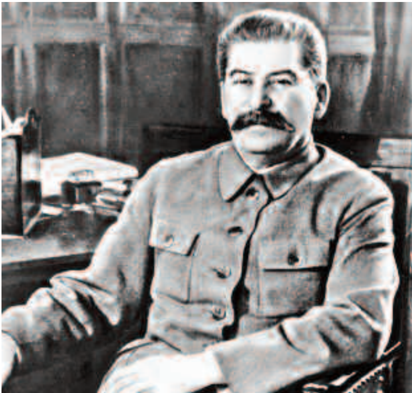
Stalin în anul 1950

din toate funcțiile ocupate și apoi arestat, condamnat și executat.