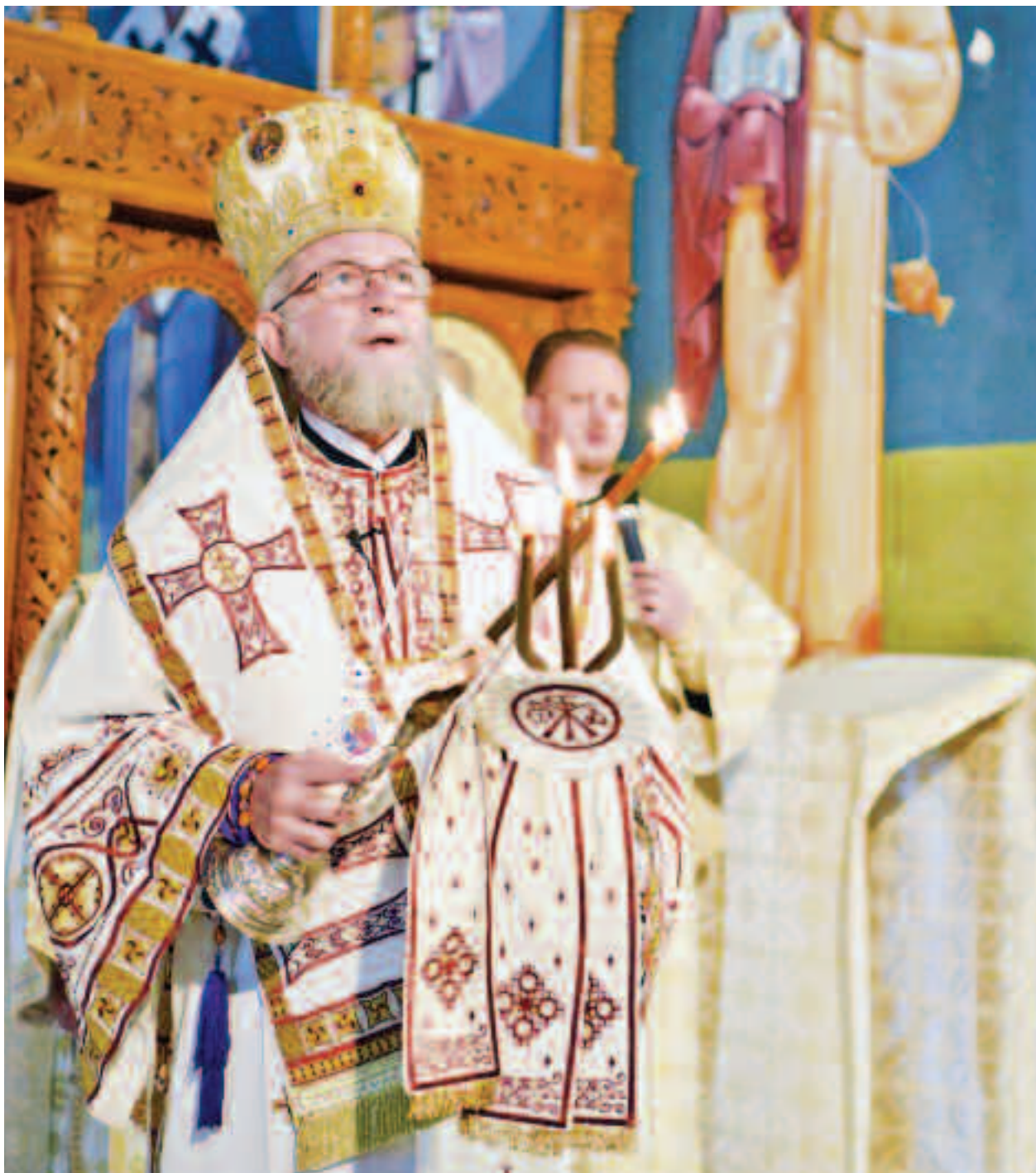
Preasfințitul Iustin: “Nimeni să nu se simtă sărac, părăsit și singur, ci să înțeleagă prin gesturile iubirii și milostivirii noastre, că Dumnezeu este cu ei”

În părțile din Nord-Vestul României, locuite din cele mai străvechi timpuri de dacii liberi, un popor curat (neamestecat cu alte neamuri), creștinismul s-a întâlnit cu tradițiile dacice locale, care au o frumusețe, o diversitate, dar și o autenticitate fără egal! Zonele, sau