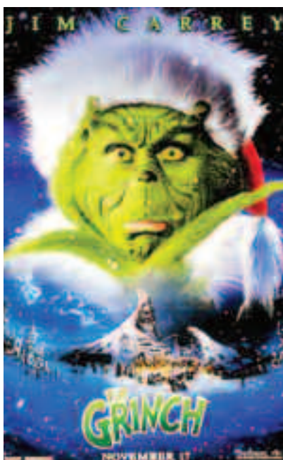
Cum a furat Grinch Crăciunul (2000)