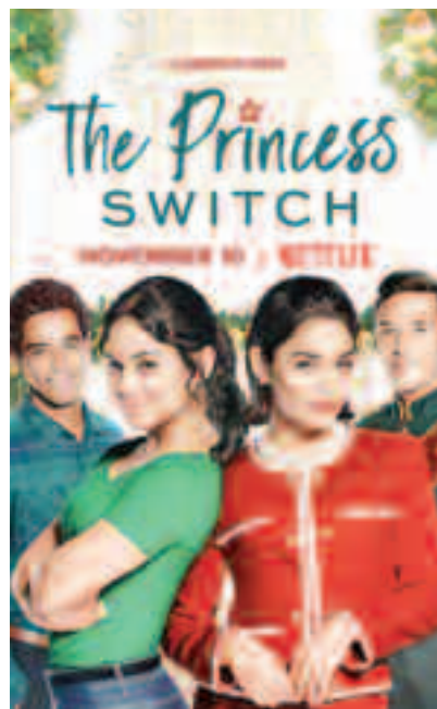
Un schimb regal (2018)