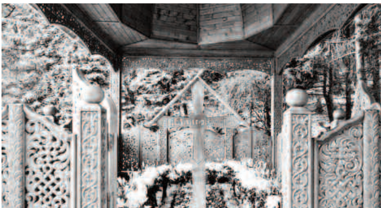
Mormântul din Hațeg, veșnic acoperit de flori

prezentăm câteva dintre aceste mărturii. ➔ A participat la înmormântarea mamei lui, deși era încarcerat