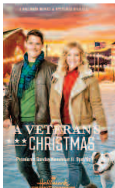
Crăciun de veteran (2018)