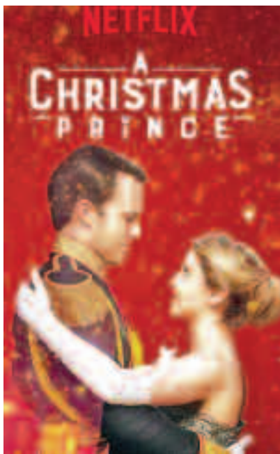
Un prinț de Crăciun (2017)

Puterea de a ne desprinde de banalul cotidian și de a intra în "magia Crăciunului" cere a fi construită dintr-un ansamblu de elemente, între care realizarea unui cadru adecvat este un element de neînlocuit. Calitatea de "cadru de Crăciun" a Castelului Károlyi a fost recunoscută de către producătorii filmului "Un schimb regal/ The Princess Switch", turnat la Carei în urmă cu doi ani. Fără îndoială că pentru această alegere a contribuit albul imaculat și luminos al castelului careian, care nu transmite acea frică și