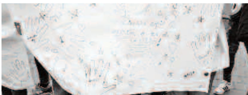
Orice copil merită o șansă la viață

- Cum este privită acum meseria de psiholog?