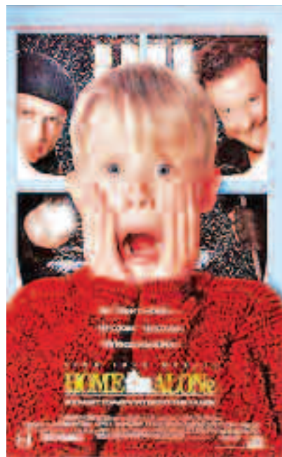
Singur acasă (1990)