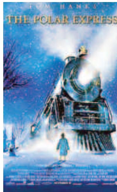
Expresul Polar (2004)

întunecime pe care o au multe cetăți și castele medievale.