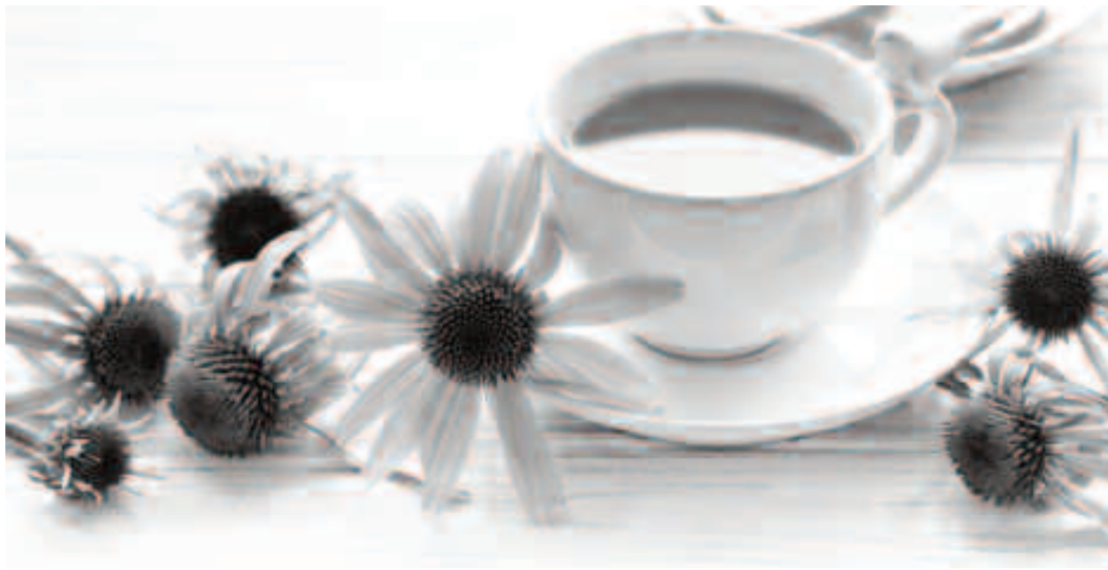
Echinacea s-a dovedit a fi una dintre cele mai importante resurse naturale în efortul de întărire a imunității organismului

plantă medicinală s-a mutat astfel, la începutul secolului XX, din America în Europa. La început, homeopatia a manifestat un interes pentru ea, ca remediu homeopatic recomandat în supurații și limfangite (furuncule, antrax, abcese diverse, septicemie, leucemie, cangrenă, etc.). În aceste scopuri, se folosește în diluții joase decimale sau centezimale, precum și ca tinctură mamă (Echinacea T.M. materia primă de fabricație a remediiului homeopatic) singură sau asociată cu tinctură de gălbenele, Calendula Officinalis T.M. și / sau cu tinctură de cărmaz, Phytolacca Americana T.M. Poate, de asemenea completa un tratament cu antibiotice.