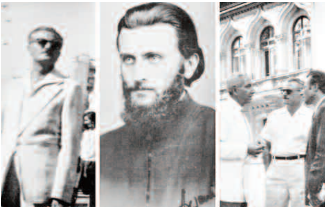
Arsenie Boca, imagini din perioada când i s-a interzis să poarte haine monahale și era pictor în București

De-a lungul timpului, i-au fost atribuite o mulțime de minuni, unele de domeniul fantasticului. Chiar dacă au trecut decenii de când s-au întâmplat, chiar și acum oamenii încearcă să le înțeleagă. În cele ce urmează, vă