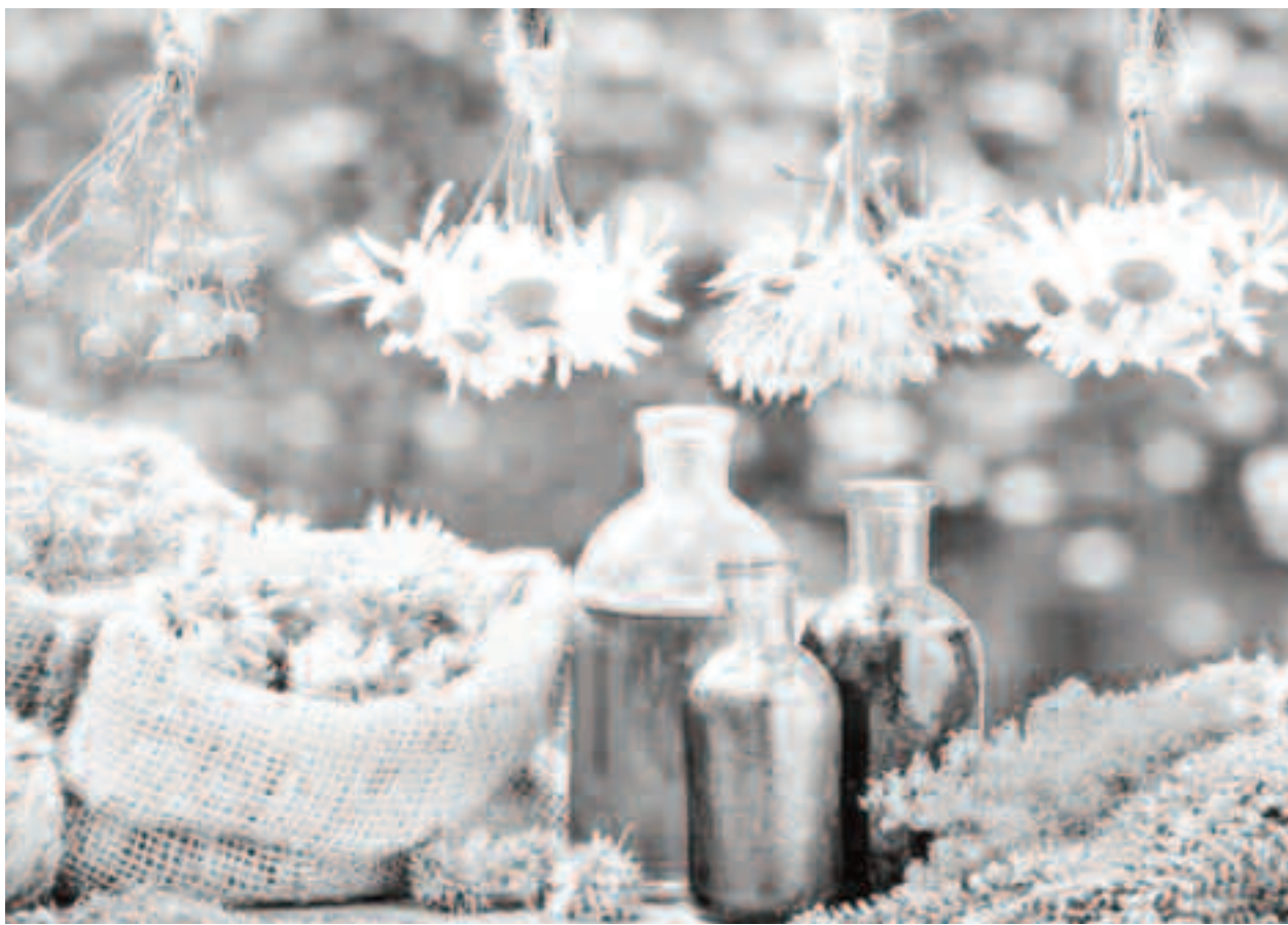
Principiile active din plante medicinale sunt substanțe chimice, farmacologice active, care determină acțiunea terapeutică a acestor plante

5) Acțiunea multor produse vegetale este complexă, datorită complexității compoziției chimice și se