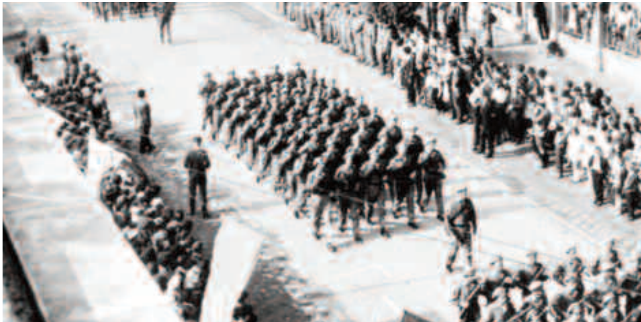
23 august a rămas întipărită în memoria multor români, care au primit titlaturi precum șoimi ai patriei sau pionieri. Nici muncitorii din acea vreme nu vor uita momentele festive, deoarece cu toții defilau la grandioasele manifestări pe 23 August, în cinstea partidului, precum și a conducătorului iubit

August, în cinstea partidului, precum și a conducătorului iubit. Erau luați din fabrici, împărțiți în grupuri și pregătiți pentru parade. În toate orașele țării, cântecele patriotice și lozincile care preaslăveau poporul român, partidul, precum și conducătorii răsunau ziua întreagă.