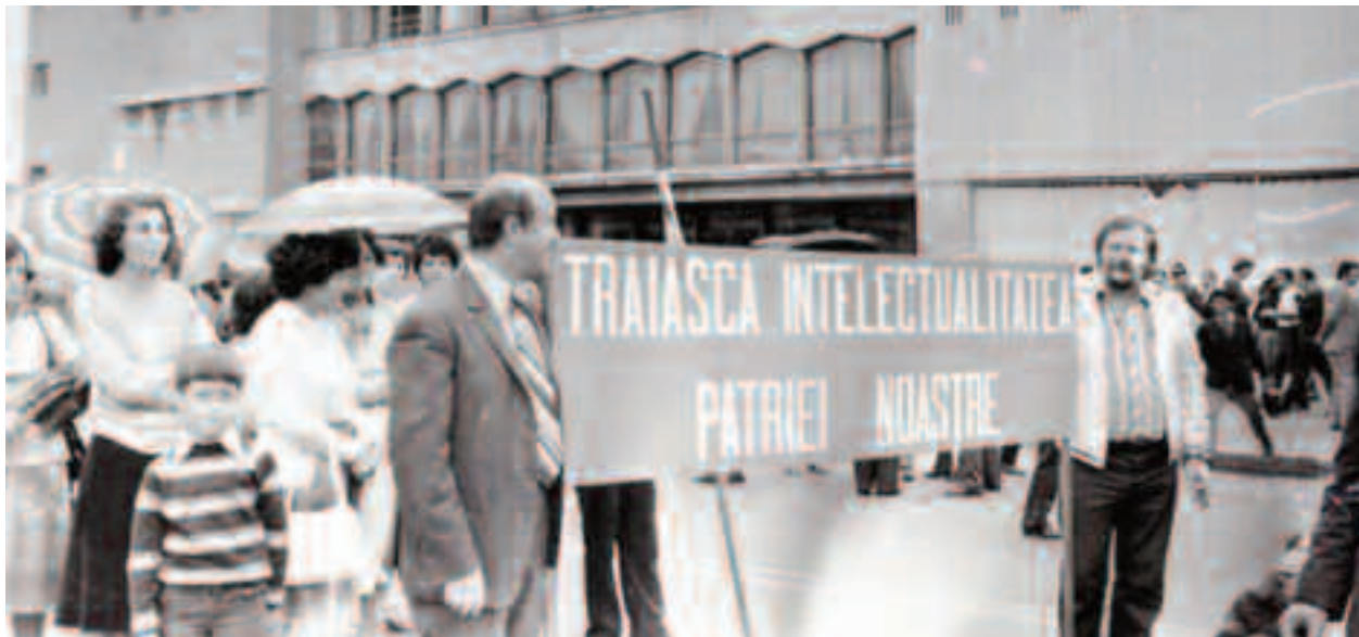
Fiecare întreprindere, uzină, fabrică sau atelier mobiliza o armată de oameni, pe cei mai pricepuți și îndemânatici, care se ocupa de execuția panourilor propagandistice care trebuia purtate pe brațe la defilare

Nici muncitorii din acea vreme nu vor uita momentele festive, deoarece cu toții defilau la grandioasele manifestări pe 23