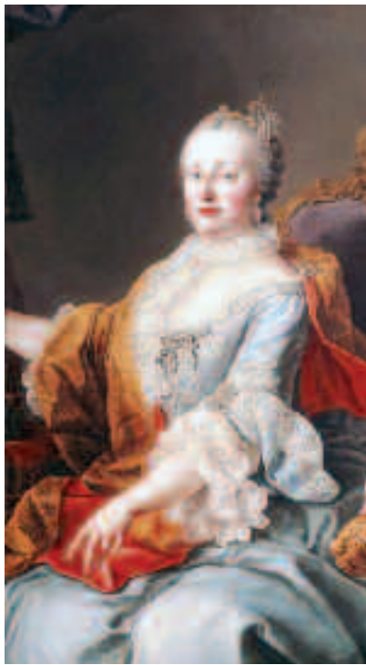
Numele ei întreg a fost Maria Theresia Walburga Amalia Christina