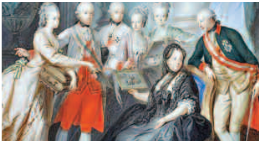
Împărăteasa văduvă împreună cu șase dintre copiii ei, anul 1776

de stat cu ea, considerându-o imatură pentru un asemenea rol. Chiar dacă și-a petrecut ultimele decenii din viață asigurând moștenirea Mariei Tereza, Carol a așteptat întotdeauna un fiu și niciodată nu și-a pregătit fiica pentru viitorul ei rol ca suveran.