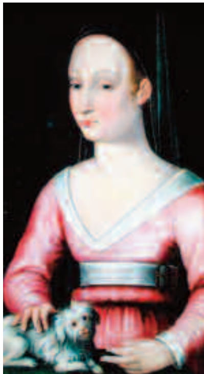
Agnès Sorel (n. 1422 - d. februarie 1450)