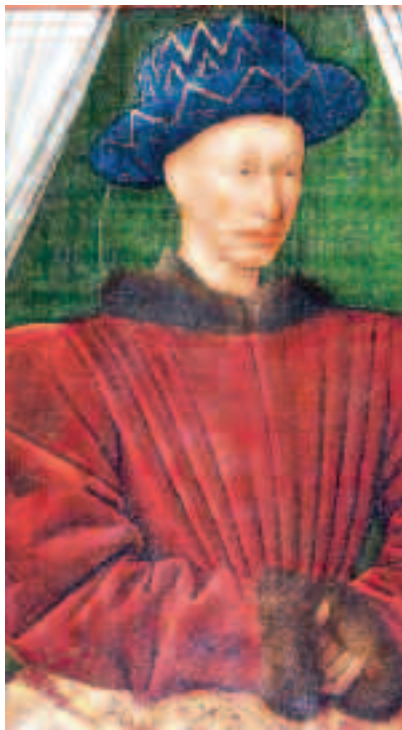
Carol al 7-lea, numit Victorious

Pe data de 31 august 1422, la Vincennes, regele Henric al V-lea al Angliei încetează din viață iar la două luni este urmat de către Carol al VI-lea, în palatul Saint-Pol. Rege al Franței și al Angliei este numit un bebeluș în vârstă de 11 luni, care va purta titulatura de Henric al VI-lea, însă Carol nu este de acord. Se proclamă rege al Franței la Bourges, în noiembrie 1422, sub numele Carol al VII-lea. Ioana d'Arc reușește să câștige