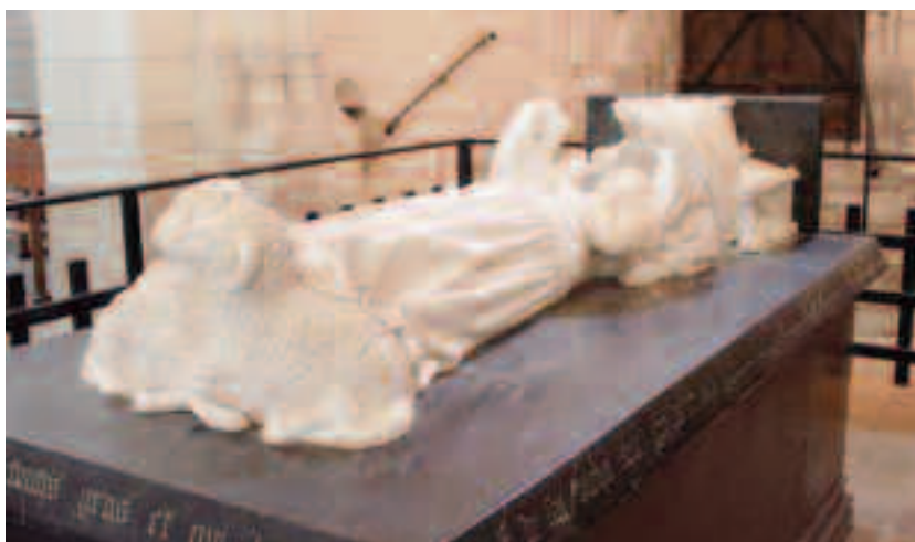
Mormântul lui Agnes Sorel se află în biserica Saint-Ours de la Loches

încrederea regelui, eliberează Orleans-ul și obține numirea regelui Carol al VII-lea la Reims, în iulie. Și, de atunci, noul rege al Franței, adoptă o nouă strategie politică, de pe urma căreia va cunoaște numai beneficii. Formează o alianță cu suveranul Sfântului Imperiu Romano-German, împăratul Sigismund, în 1434. Negociază Tratatul de la Arras cu Filip cel Bun, ducele de Burgundia. Acest tratat recunoaște titulatura de rege al lui Carol și rupe Burgundia de alianța engleză, ceea ce duce eliberarea Parisului în anul 1436. Carol al VII-lea sărbătorește acest fapt un an mai târziu, în 1437, pe data de 12 noiembrie, când intră triumfal în Paris. Acest moment de fericire nu durează prea mult, deoarece părăsește orașul după doar trei săptămâni, preferând să se retragă pe malul Loirei. Mutarea aceasta îi este benefică, monarhul dând dovadă de o energie surprinzătoare.