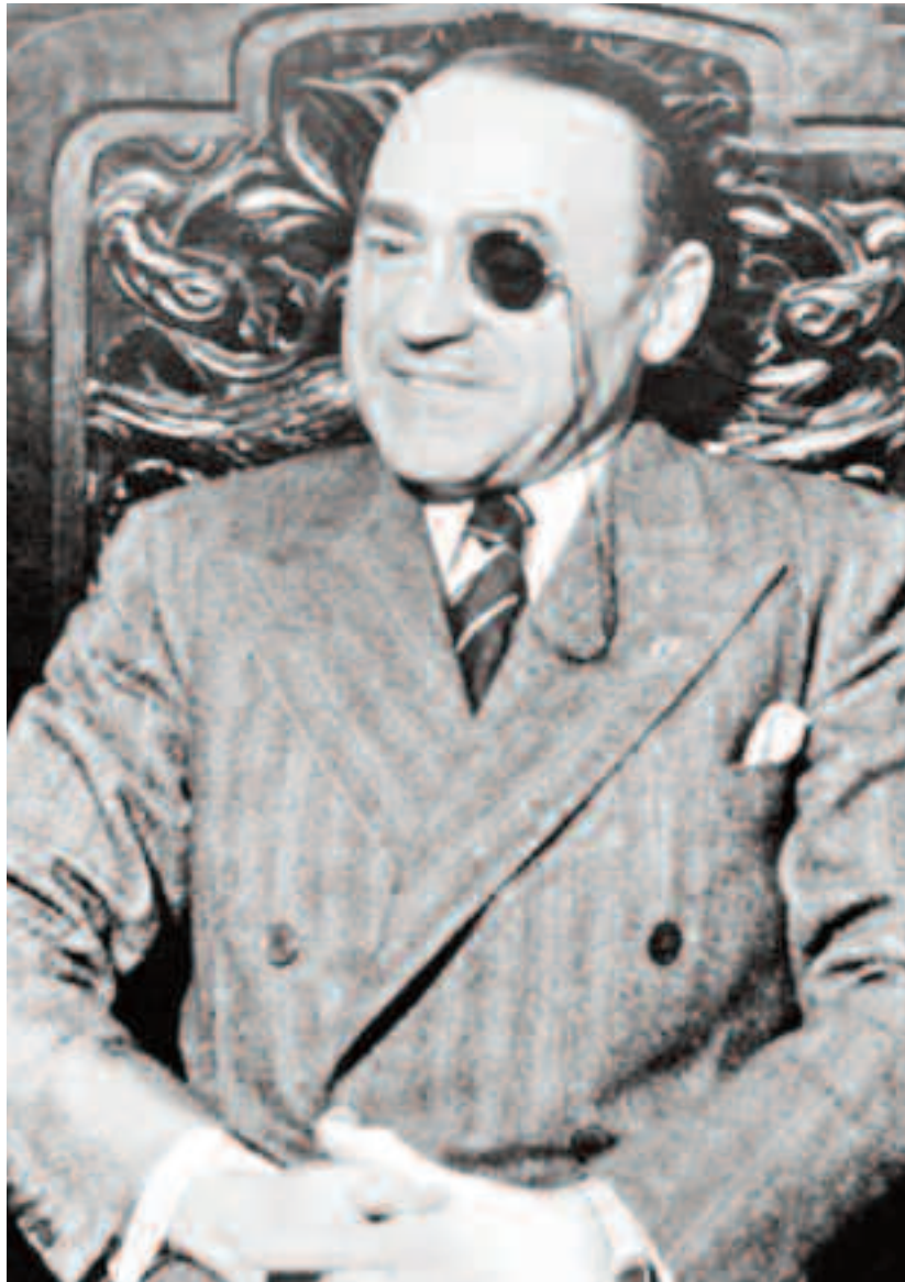
Armand Călinescu (n. 22 mai 1893, Pitești - d. 21 septembrie 1939) - om politic, prim-ministru (7 martie-21 septembrie 1939), ministru și economist. Asasinat la București, în data de 21 septembrie 1939

Descentralizarea sau autonomia se realizează mai întâi prin asigurarea independenței organelor de conducere a comunelor și județelor. Am introdus, desigur, încă de acum 70 de ani organele electivă, dar ele au fost în permanentă