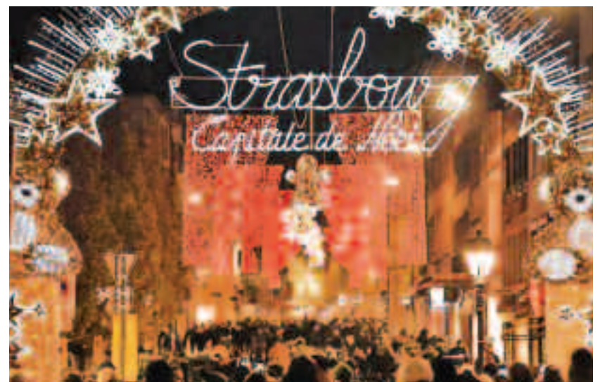
Imagine de la târgul de Crăciun din Strasbourg, noiembrie 2019

La începutul lui octombrie, capitala regiunii Alsacia nutrea încă speranțe că va reuși să mențină târgul de Crăciun, o tradiție multiseclară, cu prețul unor ajustări pentru a face față crizei sanitare