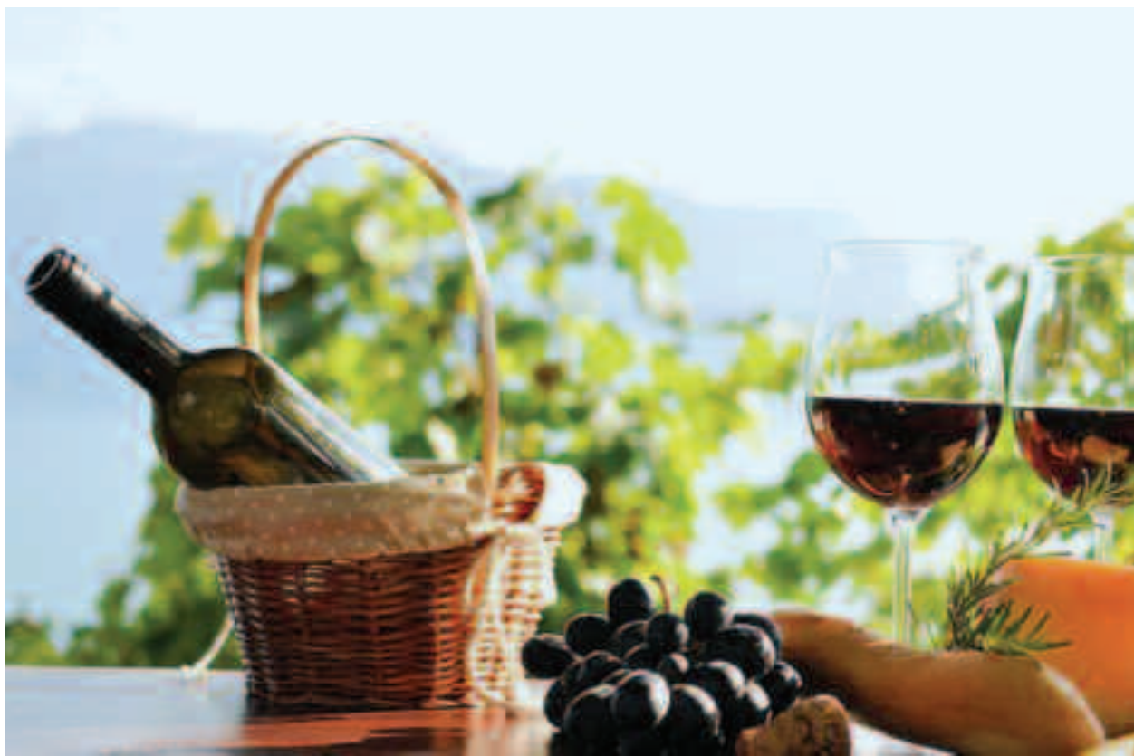
Strugurii și vinul roșu, o sursă bogată în antioxidanți și flavonoizi cu efect protector asupra inimii

Digestia deficitară și tulburările de absorbție ale alimentelor au drept rezultat producerea de toxine metabolice și prin acestea, de radicali liberi.