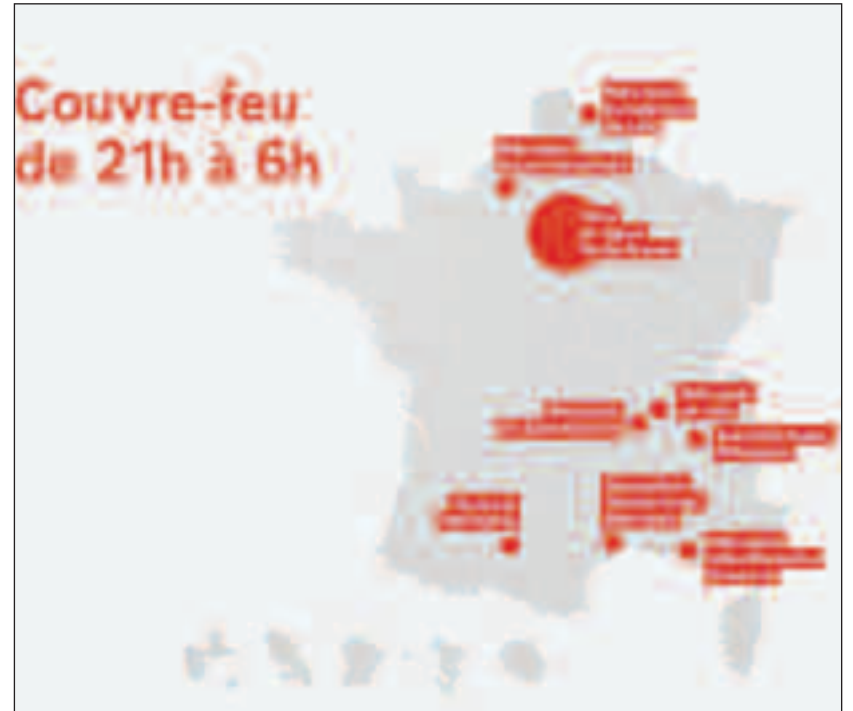
harta Franței cu zonele aflate în stare de urgență

Aceste restricții, ce s-ar putea aplica pe întreg teritoriul sau în unele regiuni, vor fi adaptate în funcție de intensitatea epidemiei. Adunarea Națională a Franței s-a reunit în mod excepțional sâmbătă și duminică pentru a examina acest proiect de lege, ce va fi supus apoi votului în Senat.