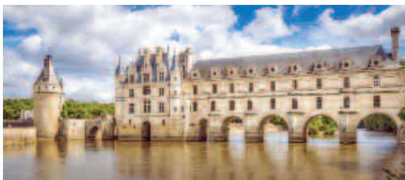
Castelul Chenonceau, bijuteria de pe Valea Loarei

reprezentare și de muzeu. Până în 1947, devine spațiu reprezentativ pentru vizitele oficiale sau locație pentru ceremoniile cu caracter militar.