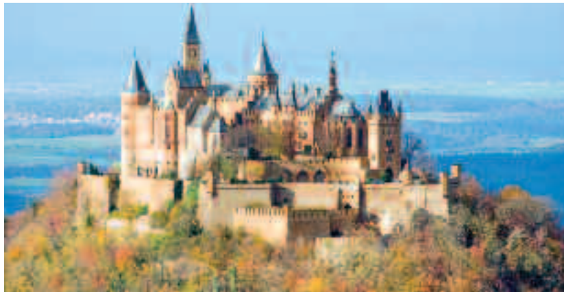
Castelul Hohenzollern, locația dinastia de Hohenzollern

După anul 1914, castelul a continuat să își exercite funcția de