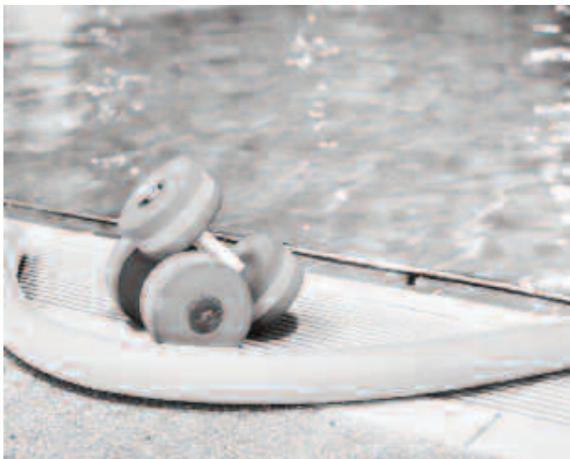
Curele cu apă, de uz intern sau extern s-au perpetuat până în prezent

Cine cunoaște cum acționează apa și diversele sale posibilități de folosire, va dispune de un leac pe care nimic nu-l poate întrece. Nici un alt remediu nu se poate întrecuți în feluri atât de variate ca apa. Fiecare procedură se poate face în mai multe feluri, ceea ce