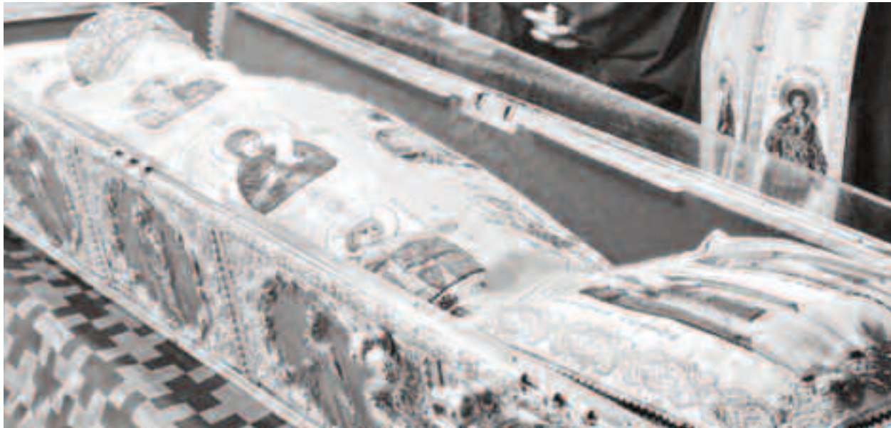
Sfânta Parascheva este nu numai ocrotitoarea Moldovei, ci a întregii țări, dovadă stând imensa iubire pe care i-o poartă credincioșii

Ascultând de chemarea lăuntrică de a-l urma pe Hristos, tânăra părăsește casa părintească și merge la Constantinopol unde petrece o vreme la mănăstirile din zonă, după care s-a