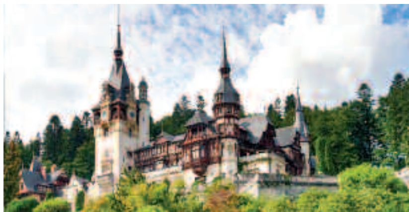
Castelul Peleş din Sinaia, România