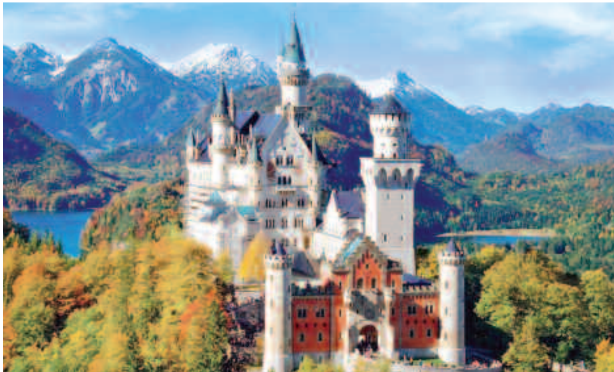
Castelul Neuschwanstein din Bavaria

Castelul Hohenzollern, reședința unei dinastii