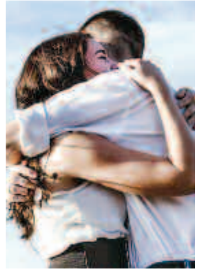
Pe lângă echilibrul relațional, iertarea este totodată o izbândă personală PAGINA 4