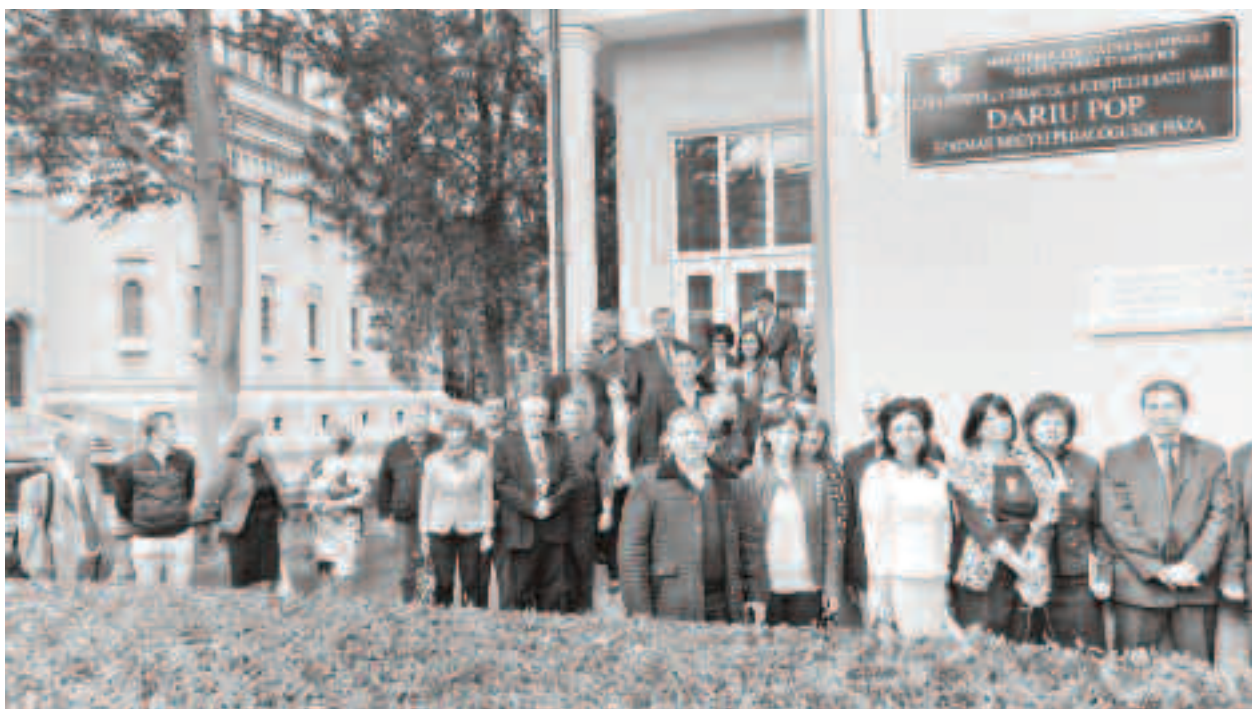
Casa Corpului Didactic din Satu Mare a primit numele „Darius Pop”