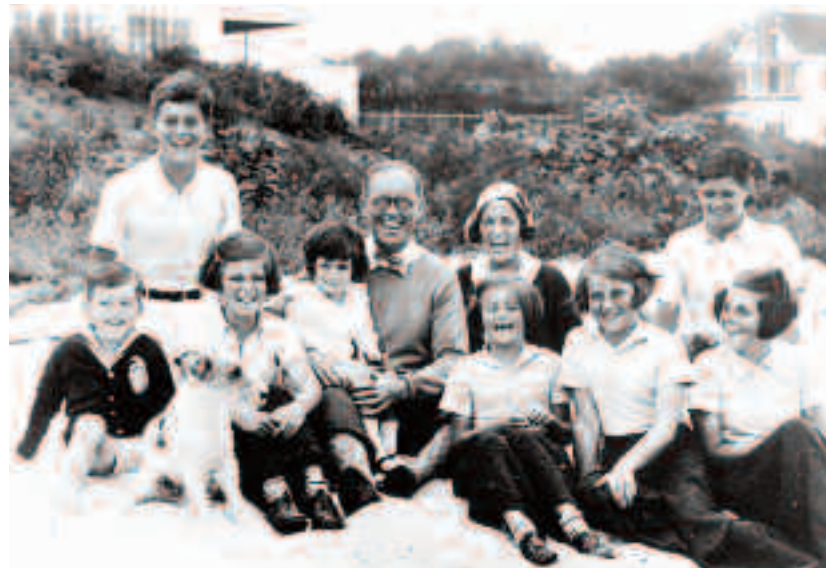
Familia Kennedy în Hyannis Port, Massachusetts, anul 1931

Alți autori susțin că "blestemul" a pornit de la bunicul lui Joseph Senior, care a fugit din Irlanda natală pentru a scăpa de foamete, sperând la izbăvire în America, dar a călătorit în așa-zisele "navele sicriu", ambarcațiuni pline cu