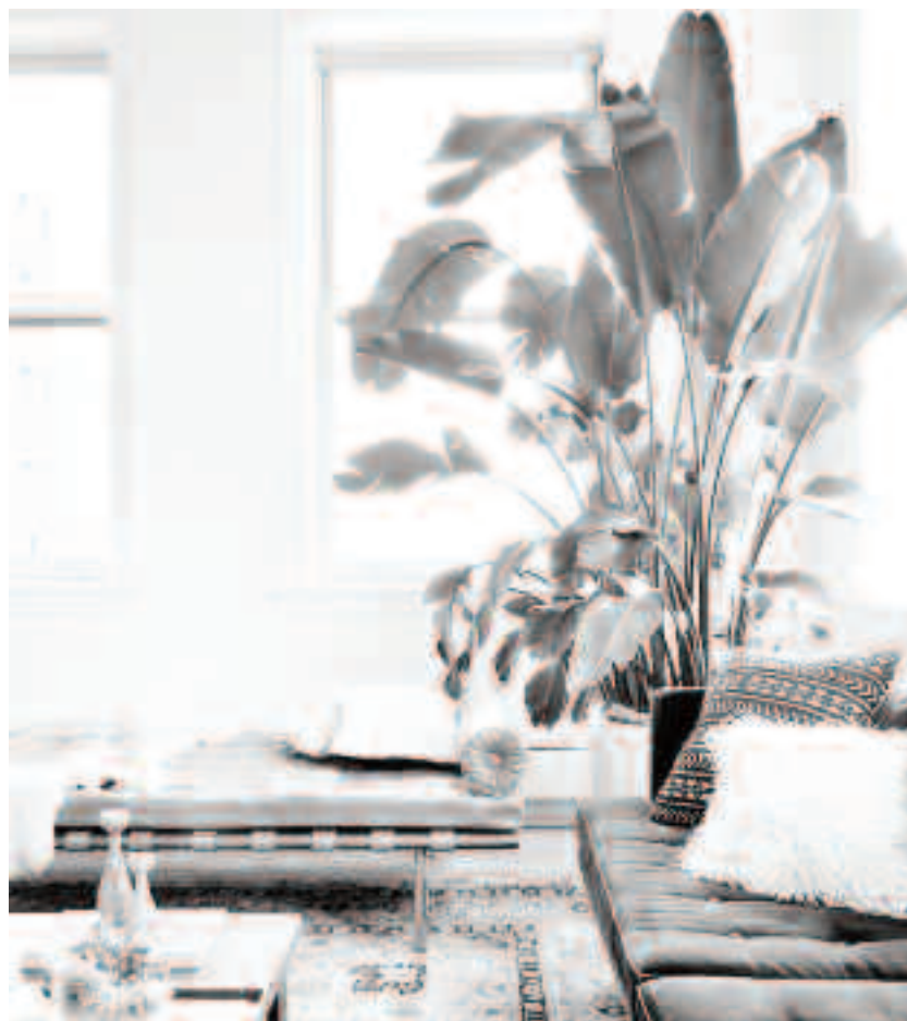
Plantele verzi îmbrospătează aerul din locuință

Îmbrăcămintea și accesoriile sunt importante în zilele noastre. Hainele sintetice confecționate din nailon, poliester și acril, împiedică circulația fluxului de energie prin organism. De aceea, este indicată utilizarea în contact direct cu pielea a unor materiale mai naturale precum bumbacul (mai ales pentru lenjeria intimă, ciorapi și maeiuri), inul, mătasea sau lână. De asemenea, prosoapele, cearceafurile, păturile și covoarele sintetice este bine să fie înlocuite cu unele naturale. Accesoriile metalice, precum inelele, brățările, colierele și alte bijuterii este bine să fie în cantitate mică, pentru că purtarea lor directă pe piele determină blocarea unor meridiane energetice.