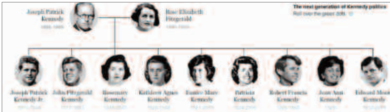
Copiii lui Joseph și Rose Elizabeth Kennedy

Iar dramele pot continua. Unul dintre fiii lui Robert, David, marcat fiind de pierderea tatălui său, apelează la droguri, grăbindu-și astfel sfârșitul. David a murit la vârsta de 28 de ani, în urma unei supradoze de cocaină, într-un hotel din Florida, în anul 1984. În 2019, Soirose