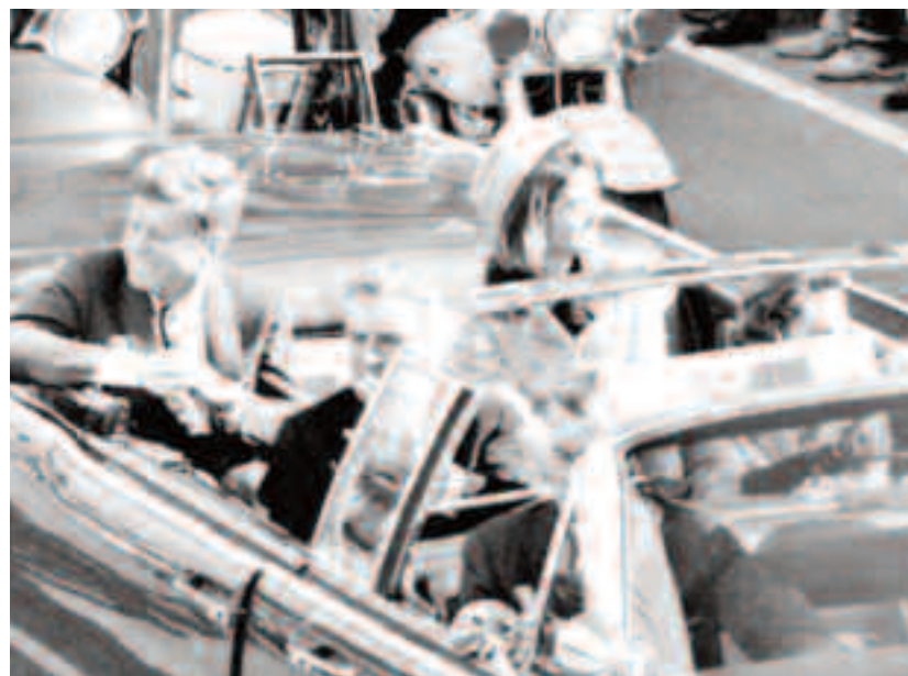
John F. Kennedy, ultima fotografie cu el în viață

emigranți săraci, care aduceau cu ei și numeroase boli.