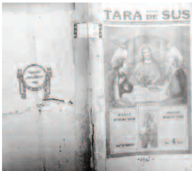
Revista „Țara de Sus”, numărul 4, mai 1921