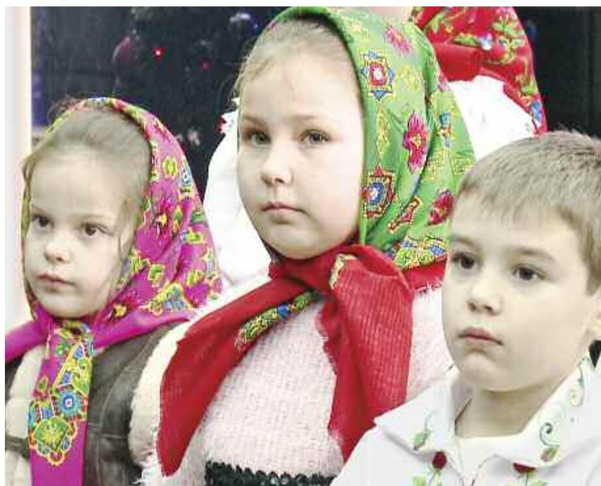
Colindători din Călinești la Redacțiile Informația Zilei și ITV PAGINA 3

Plugușorul și sorcova, tradiții de pe vremea dacilor