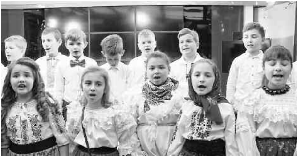
Colindători din Călinești la Informația Zilei și ITV

Cei mai mulți își petrec noaptea în compania familiei și a cunoscuților, transformând-o într-un motiv de petrecere și de voie bună. Fetele tinere așteaptă cu nerăbdare această noapte, sperând că în timpul somnului își vor visa ursitul sau viitorul soț. În ziua de Anul Nou fiecare om are mare grijă în tot ceea ce întreprinde, să nu se certe cu nimeni, să nu facă fapte rele, să nu-și atragă ura nimănui, deoarece așa cum se comportă în această primă zi, așa îi va merge tot anul. Inșă, pe lângă aceste superstiții transmise de-a lungul anilor, locuitorii județului nostru au păstrat cu sfințenie și alte obiceiuri, care oglindesc credința, traiul, bucuriile și aspirațiile lor.