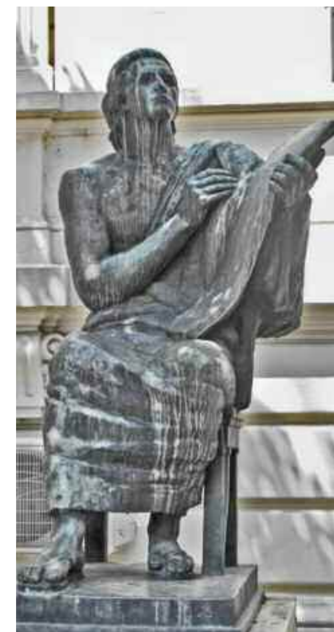
În curtea Ministerului Afacerilor Externe regăsim statuia lui Eminescu stând, din bronz, operă a sculptorului Ion Jalea