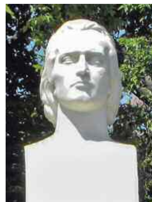
În Parcul Cișmigiu, în cadrul ansamblului Rotondei scriitorilor regăsim un bust din marmură făcut de Ion Jalea (1887-1983) ce a fost amplasat aici în 1943