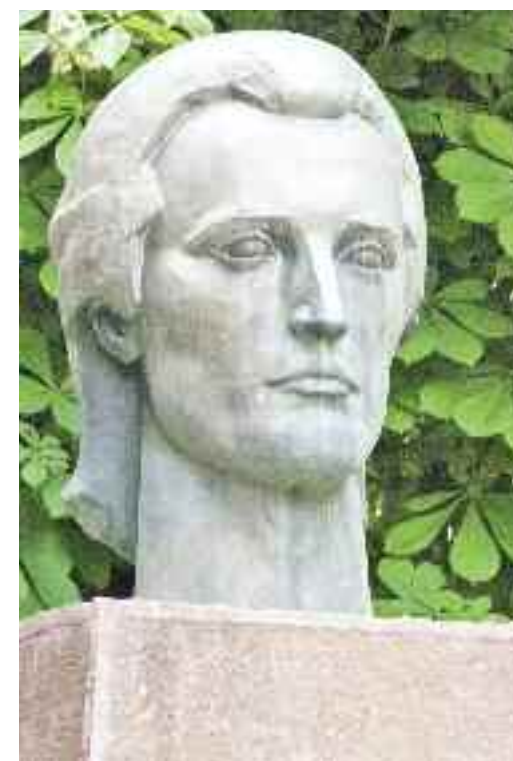
Statuia lui Eminescu din Satu Mare, din fața Colegiului Național Mihai Eminescu