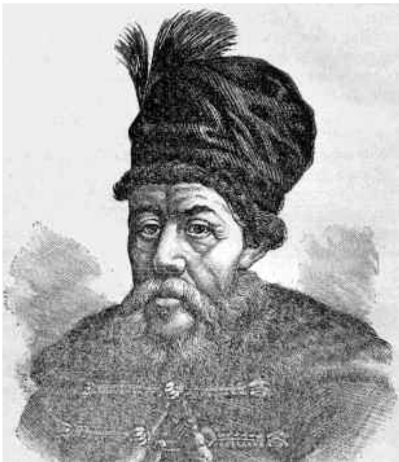
Matei Basarab a domnit în Țara Românească în perioada 1632 – 1654

În cei 22 de ani de domnie, Matei Basarab reușește să confere țării prosperitate economică, independență politică, afirmarea culturii românești în țară și ferme hatoare. Ultimul an de domnie coincide cu un eveniment dramatic : seimnii și dorobanții (lefeșii domnești) cărora nu li se plățiseră soldele, s-au răsculat tulburându-l pe bătrânul domnitor. Matei Basarab se sfârșește de inimă rea (9 aprilie 1654) și e înmormântat la biserica Domnească din Târgoviște, iar mai târziu reinhumat la mănăstirea Arnota.