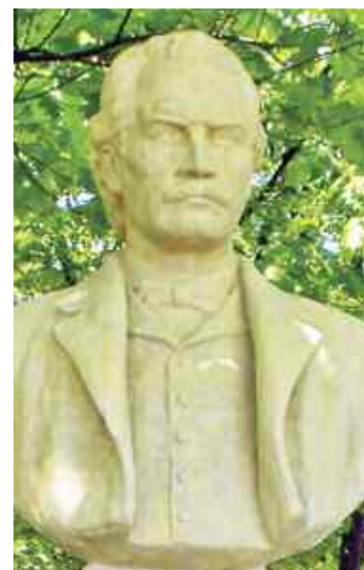
Statuia lui Eminescu din Parcul Herăstrău este opera sculptorului Mihai Onofrei și a fost amplasată aici în 1953 în cadrul unui amplu program de reamenajare a parcurilor bucureștene la care au participat o parte importantă a sculptorilor români