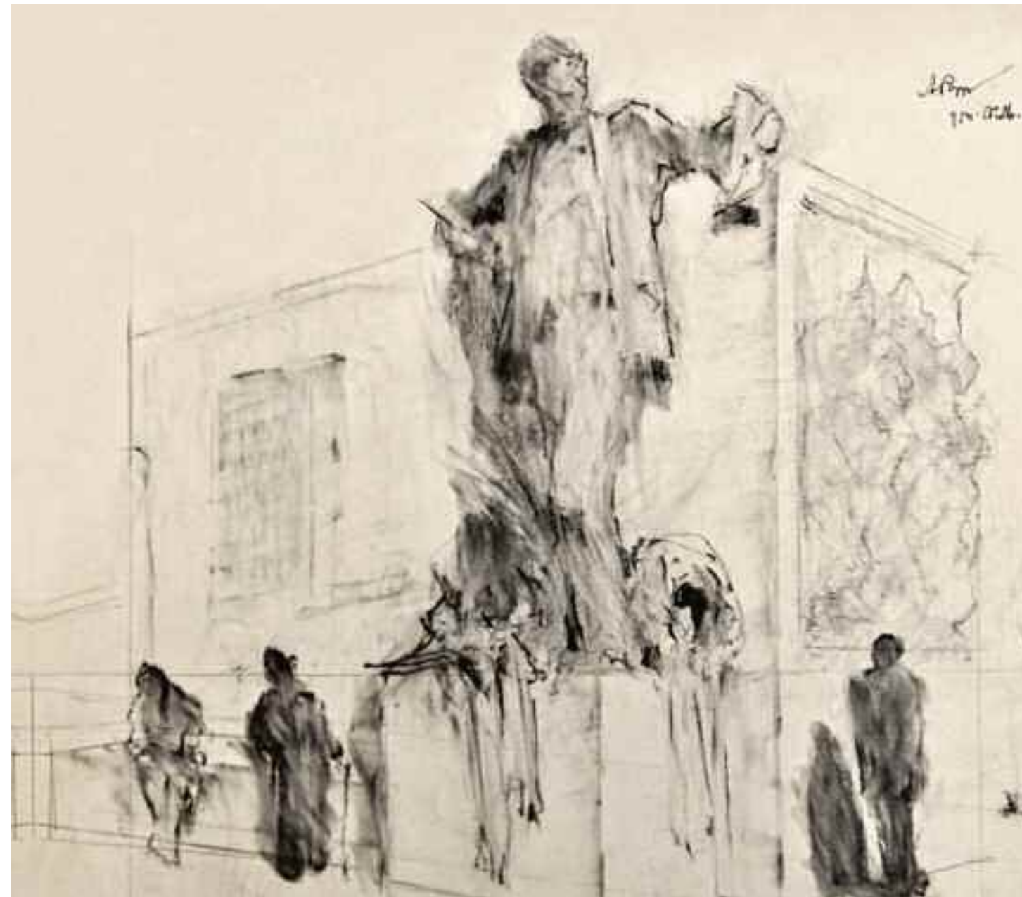
Proiect "Monument Eminescu" de Aurel Popp