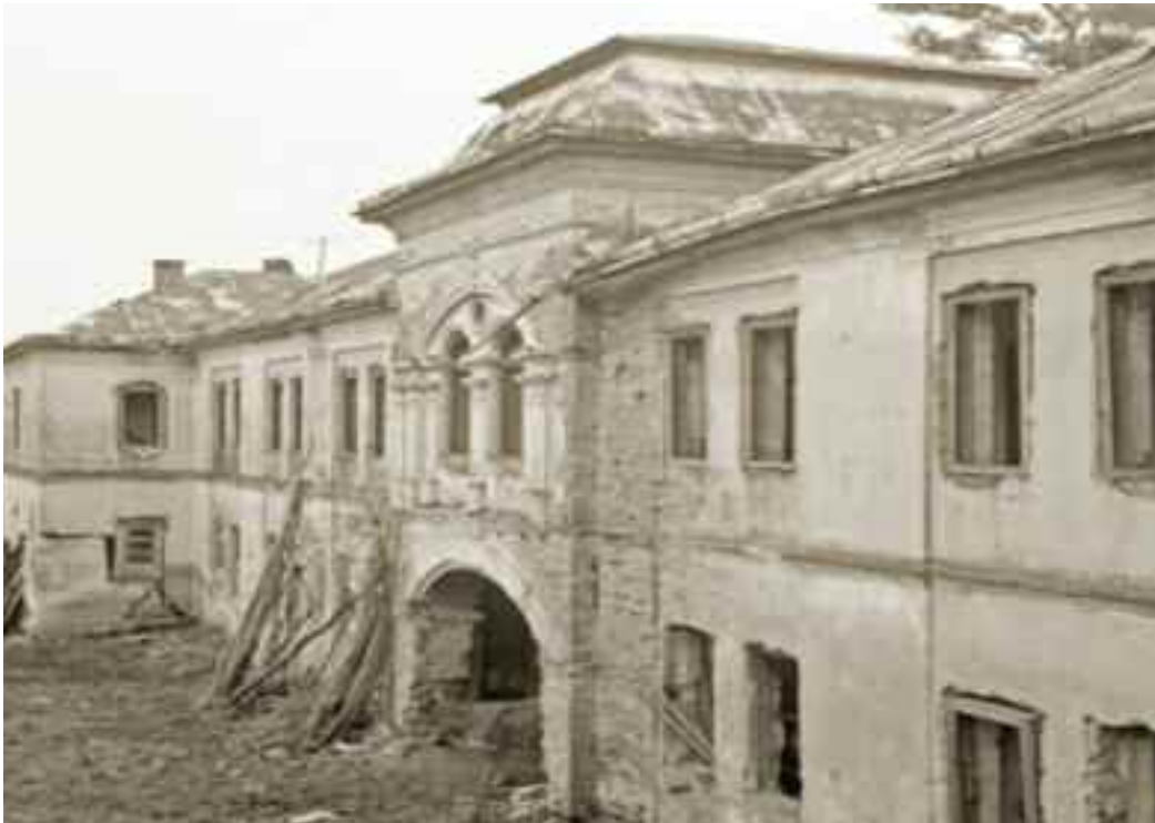
Ruinele falansterului din Tur.