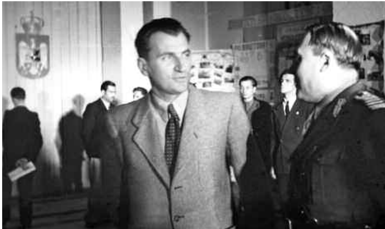
Lucrețiu Pătrășcanu în anul 1945, la inaugurarea expoziției militare a regimentelor participante la război

La revenirea în țară a fost arestat și a fost încarcerat la închisoarea de la Jilava. În anul 1924, Partidul Comunist din România, ca secție a Cominternului, prin legea Mărzescu a fost scos în afara legii, declarat ca o organizație antinațională. Cauzele? Această formațiune politică și-a însușit teza moscovită că România a fost un stat imperialist și multinațional care a cucerit teritorii străine prin actul de la 1 Decembrie 1918, precum și drep-