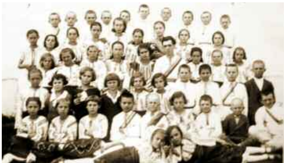
Anul școlar 1934-1935, grup de elevi