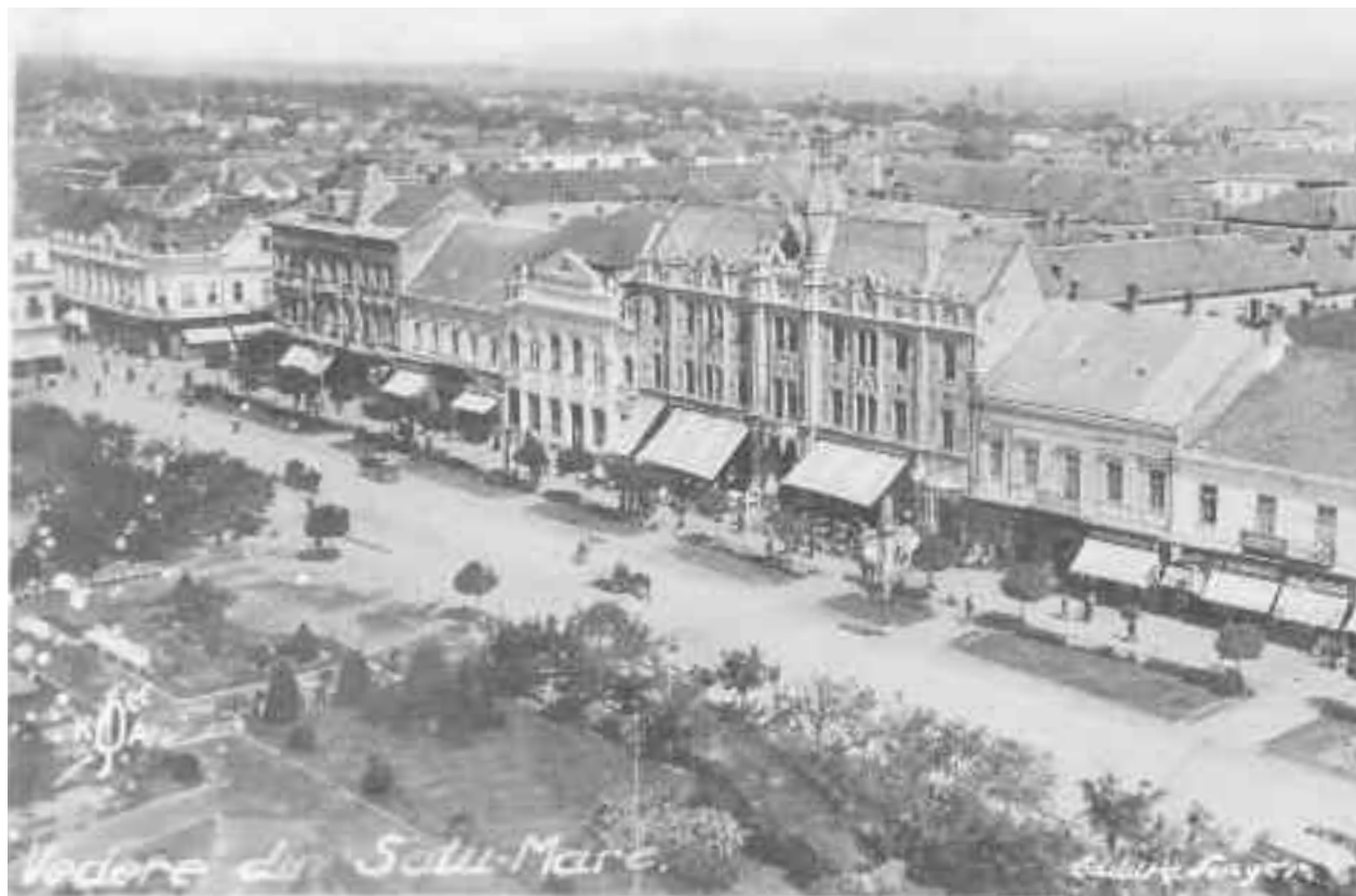
Imagine cu centrul orașului Satu Mare din perioada interbelică

În ceea ce privește școlile primare de stat în 1940 există următoarele date: în județul Satu Mare sunt 237 școli primare rurale mixte de stat, 23 școli primare ur-