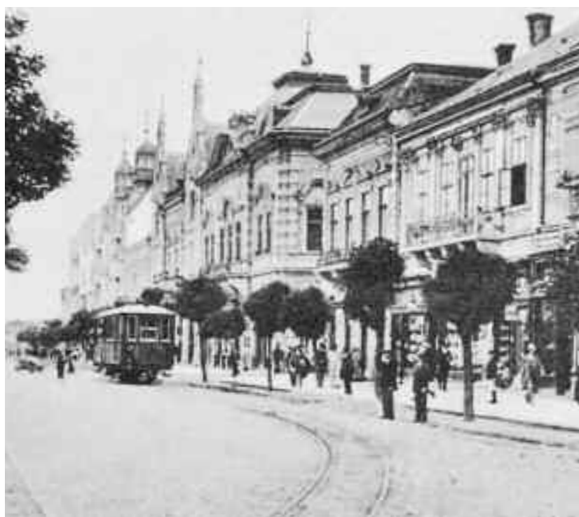
Actuala piață a Libertății cu linia de tramvai

Acei câțiva oameni, chiar fiind doar o parte mică din întregul publicului, simt greutatea responsabilității, care însă nu ar trebui purtată tocmai de ei, ci de tot publicul. Dar ce fel de responsabilitate ar avea marele public, s-ar putea întreba oricine. Căci este vorba de o chestiune privată a fiecăruia dacă merge sau nu merge la teatru. Păi, este adevărat, că această atitudine nu se lovește de niciun fel de cod scris, și după unii poate este chiar un lucru fără gust să se facă