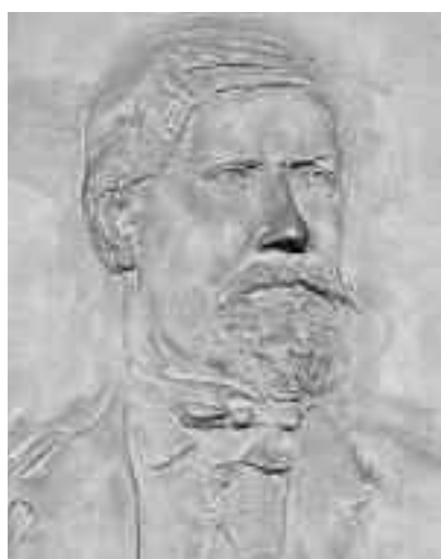
Fundația de Protecție a Patrimoniului de Cale Ferată din Ungaria a dezvelit plăci comemorative pe fațada multor clădiri din multe gări, dedicate lui Paff Ferenc

Caracteristicile clădirilor garilor proiectate și construite după proiectele lui Paff Ferenc sunt: clădiri compuse din 3 corpuri - dominant, mai mare