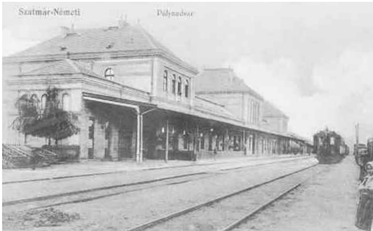
Gara Satu Mare poate fi considerată una din cele mai reușite construcții de acest gen a Imperiului Austro-Ungar a anilor de sfârșit de deceniu și secol XIX

În ce constau asemănările: stil arhitectural renanșantist, eclectic; motivele