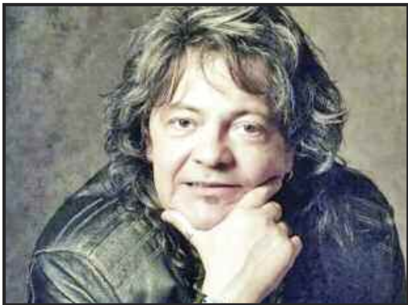
Nimic nu l-a ținut departe pe artist de scenă și de publicul care îl iubea