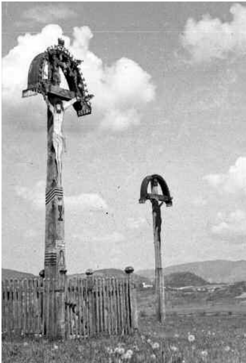
Cruci din Oaș