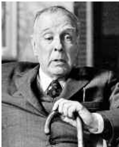
Jorge Luis Borges s-a născut pe 24 august 1899 la Buenos Aires și a trecut la cele veșnice pe 14 iunie 1986 la Geneva

Jorge Luis Borges s-a născut pe 24 august 1899 la Buenos Aires și a trecut la cele veșnice pe 14 iunie 1986 la Geneva, Elveția; de fapt Jorge Francisco Isidoro Luis Borges Acevedo a fost unul dintre cei mai importanți scriitori ai secolului al XX-lea. Romancier, poet, eseist argentinian, este faimos pentru povestirile sale fantastice, în care a unit cu măiestrie idei filozofice și metafizice cu temele clasice ale fantasticului (și anume: dublul, realitatea paralelă a visului, cărțile misterioase și vrăjite, sal-