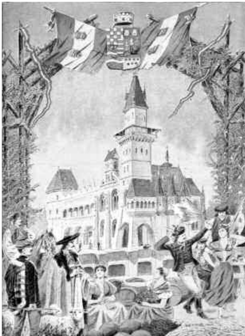
Foto: Expoziția Universală Paris 1900, Pavilionul Ungariei, cu imaginea fațadei Palatului Rákóczi (azi în Prešov, Slovacia), apărută în „Le Petit Journal. Supplément illustré”, martie 1900

Vai, vine gogorița! S-a terminat cu minunata vacanță! Mulțimea de elevi se mișcă deja altfel, inima micului școlar bate deja altfel față de începutul vacanței. Începe noul an școlar! Pentru mulți elevi