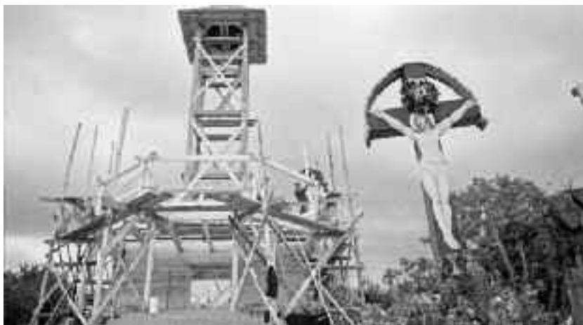
Biserica din Oaș

Prin cruce se sfințește în fiecare zi omul, făcându-și semnul ei și tot crucea îl ajută pe creștin în orice împrejurare, când diavolul și duhurile rele se apropie de el. În tot cuprinsul județului nostru, în Țara Oașului, în zona Codrului, în Câmpia Sătmăruului, pe Valea Someșului, credincioșii știu că în această zi se cade ca toată lumea să