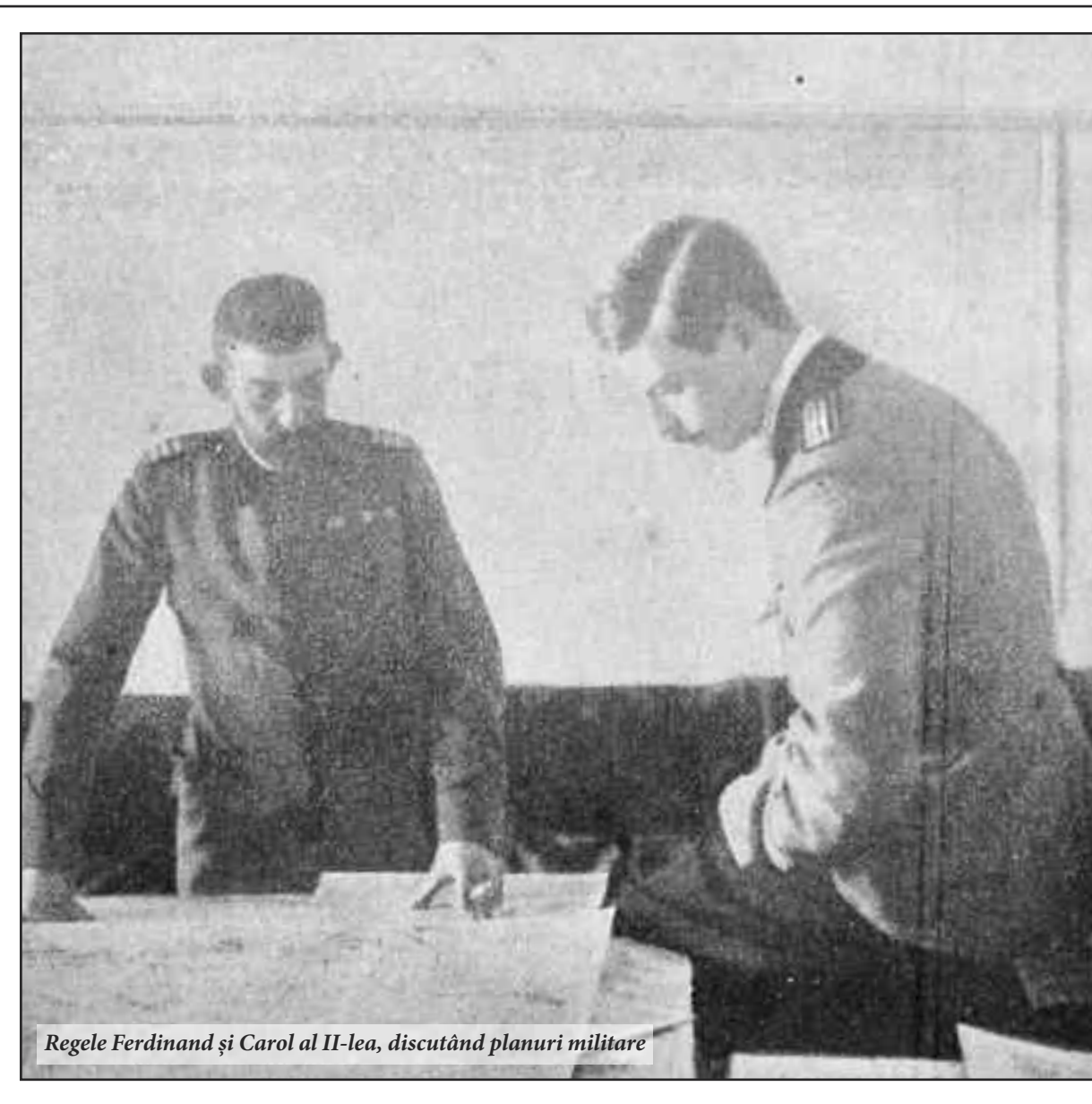
Regele Ferdinand și Carol al II-lea, discutând planuri militare

"Marșul nostru pe Mureș se prelungi până la sfârșitul lui septembrie. Un atac repede din partea Românilor, l-ar fi spulberat. Întârziată de marile succese obținute de feldmareșalul von Mackensen în cursul irupțiunii sale în Dobrogea și mai cu seamă tot așteptând ca rușii să se hotărască să treacă Carpații, armata română înainta cu iuțea unui melc. Iși păstrase aripa stângă de la Orșova la Sibiu, unde era un grup mai important. Forțele ei principale câștigă teren în direcțiunea Sud-Vest pornind din Brașov și frontiera muntoasă a Moldovei, în strânsă legătură cu aripa stângă rusă. Se pare că intențiunea Rusiei și a României coborârea în linie strânsă între Carpați și Dunăre, în câmpia joasă a Ungariei. Iar pentru aceasta trebuiau svârșite dincolo de Carpați forțe rusești importante. Iar românii, intervenind viguros împotriva concentrărilor noastre de trupe, ar fi trebuit să deschidă rușilor trecătorile Carpaților. Au făcut tocmai contrarul. Necunoscând războiul în stil mare, n-au știut deloc să profite de împrejurările favorabile ce li se ofereau mereu, noi fiind siliți să ne îndreptăm diviziunile noastre spre Nistru și în Carpați. Înaintau foarte încet și astfel au pierdut mult timp. Fiecare zi ne aducea noi avantaje! Și rușii lucrau și ei tot fără nicio logică; preferau mai bine să se repeadă prin Carpați decât să dea o lovitură prin Moldova flancului nostru deschis. Intrarea României în campanie se făcea fără nici-o metodă și cooperatiune cu