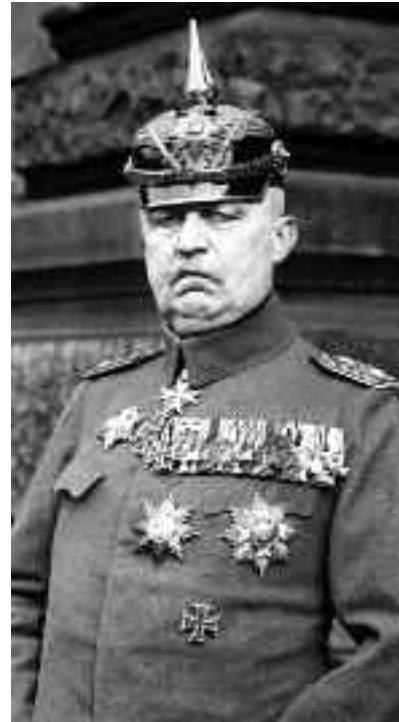
Generalul Erich von Ludendorff responsabil cu campania împotriva României