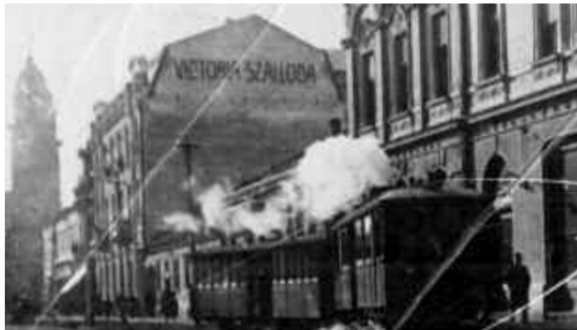
Trenul avea locomotiva cu aburi

Faptul că publicul nostru ignoră grădina Kossuth de dragul căii ferate și a excursiilor la Vii este ceva natural. Toată lumea se refugiază cu plăcere din orașul nostru cu solul necanalizat, prăfuit, cu o posibilă infecție cu malarie, la aerul curat de munte, mai mult, oamenii cu familie sunt chiar datori să se refugieze aici pentru păstrarea sănătății copiilor. Din această cauză am stabilit niște tarife extrem de mici, iar când am primit reclamații din cauza căldurii din vagoane societatea noastră a pus la dispoziție băuturi răcoritoare până când se va termina sistemul de răcire a vagoanelor cu apă lăsată peste ele de la înălțime, am pus la dispoziția publicului un restaurant la Vii, am angajat acolo și un cofetar, așa că orașenii care se recrează la Vii nu trebuie să renunțe nici la produsele de panificație proaspete, mai mult, și ideea în-