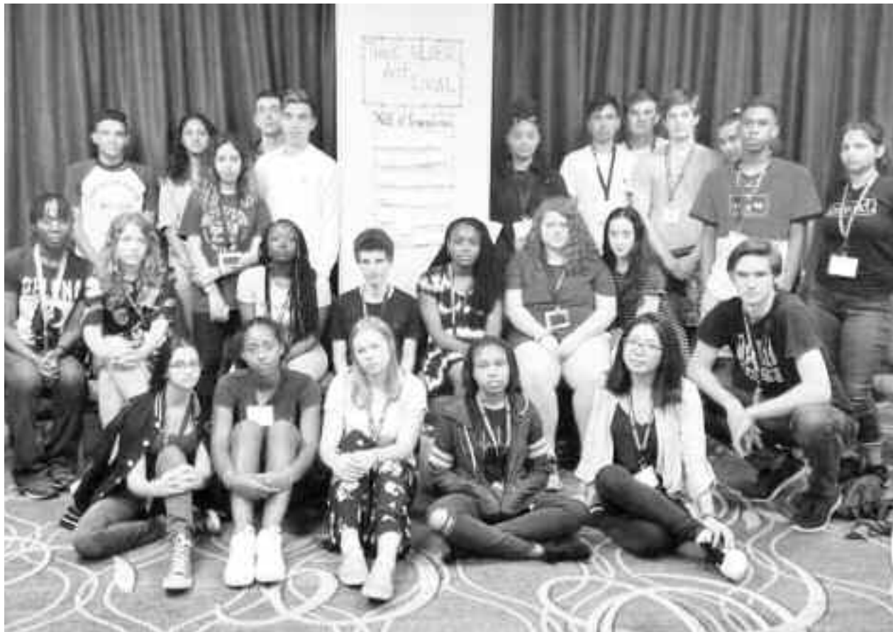
Din grupul de lucru au făcut parte elevi ce proveneau dintr-o varietate de culturi, fiecare cu diverse și impresionante povești de viață

În demersul nostru, au susținut discursuri reprezentanți ai Băncii Mondiale, ai Departamentului de Stat, ai Organizației Națiunilor Unite, profesori universitari de la marile universități americane, ambasadori ai mai mul-