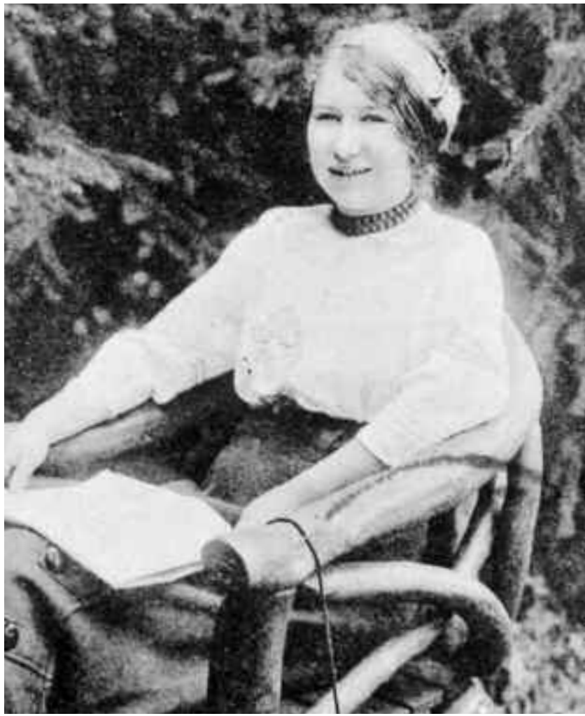
Portretul unei tinere doamne pe o felicitare de la Valea Măriei de la începutul secolului XX

În tot comitatul nostru este cunoscută mica „Țară a Oașului”, înconjurată de Munții Oașului, care cuprinde aproximativ 13 comune. Printre aceste comune se numără Vama și Tur.