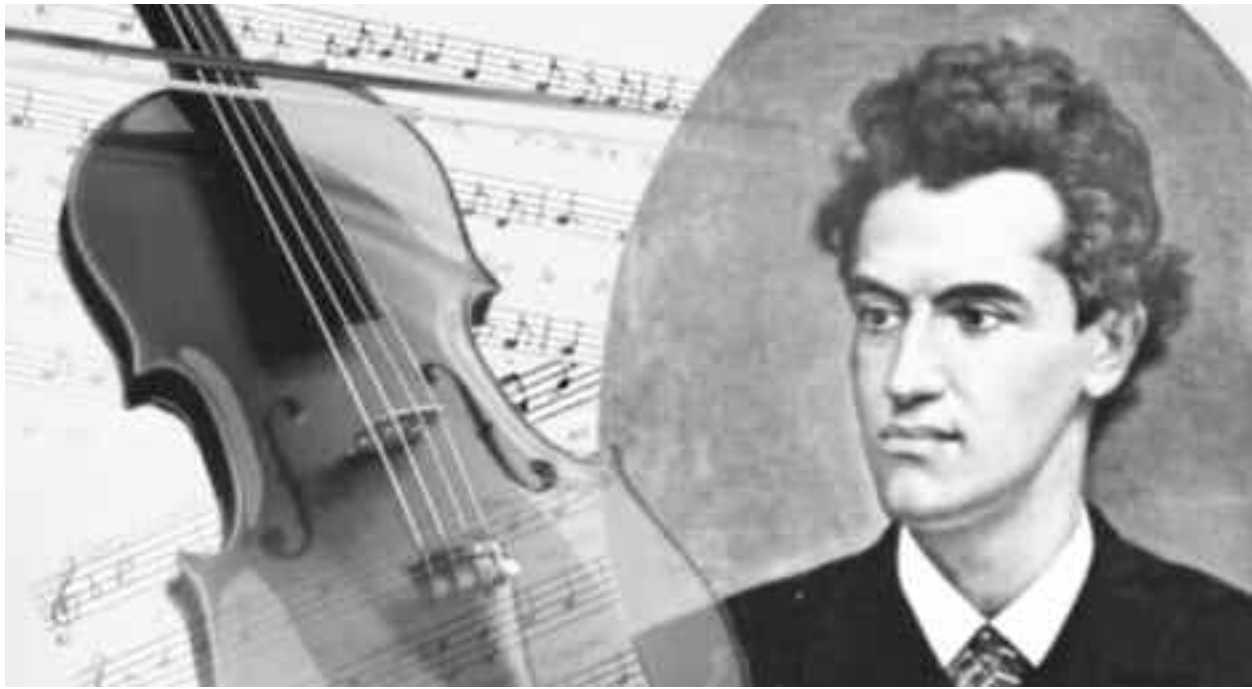
După ce a cântat la vioară cu lacrimi în ochi la Putna, în 14/26 august 1871, Ciprian Porumbescu s-a adresat tatălui său, spunând: "Tată, am cântat Daciei întregi"

Apoi, am fost invitați să vizităm muzeul. În camera din față era un pian, o masă cu șase scaune, un pat, o bibliotecă cu cărți, iar deasupra pianului era expusă o vioară. De asemenea, se mai aflau multe documente și note muzicale, aparținând compozitorului Ciprian Porumbescu. În interiorul muzeului se mai afla și o carte de impresii, în care vizitatorii își scriau părerile și impresiile. Am scris și noi în acel document, pe care l-am semnat atât părinții, cât și copiii. Despre localitatea Măzănăștii vom scrie un material separat.