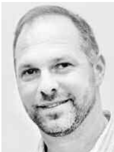
Consacrarea internațională a lui Vlad Ivanov a venit odată cu rolul principal interpretat în filmul „4 luni, 3 săptămâni și 2 zile”