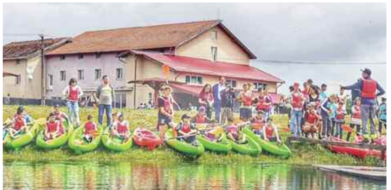
Joi, 30 mai, sute de copii de la centrele de plasament și casele de tip familial din județ au petrecut o zi minunată la un complex turistic din Livada