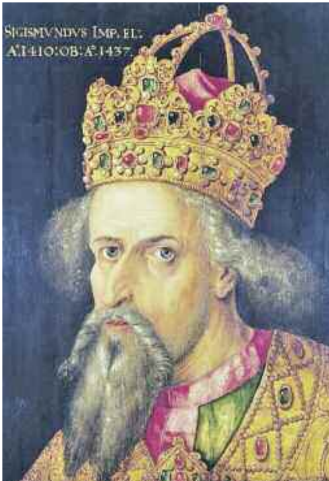
Sigismund I de Luxemburg, rege al Ungariei între 1387-1437. Este înmormântat în Cetatea din Oradea