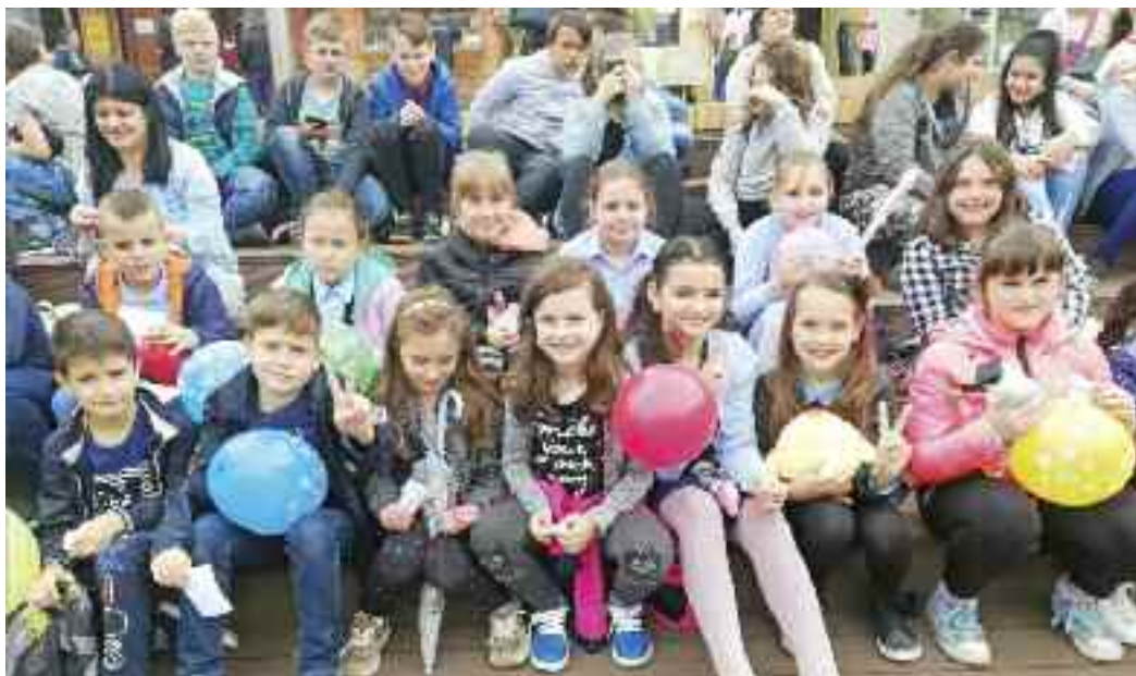
Activitate de promovare a lecturii în Pasajul Corneliu Coposu din centrul municipiului Satu Mare