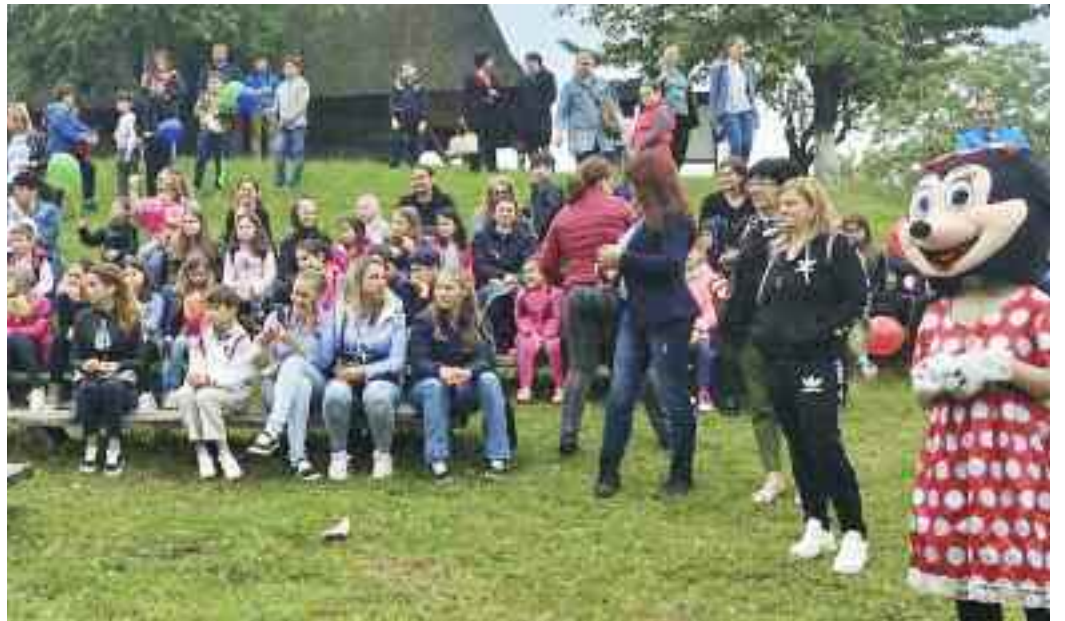
Spectacol de magie și teatru de păpuși la Muzeul Țării Oașului

1 Iunie e cunoscută la Ziua Internațională a Copilului. Această zi este sărbătorită la date diferite în multe țări din lume. Astfel, dacă în unele state e marcată în 20 noiembrie pentru că atunci a fost adoptată Declarația Națiunilor Unite pentru Drepturile Copilului, în altele se sărbătorește în prima zi a lunii iunie ca primă zi de vară în Emisfera Nordică.