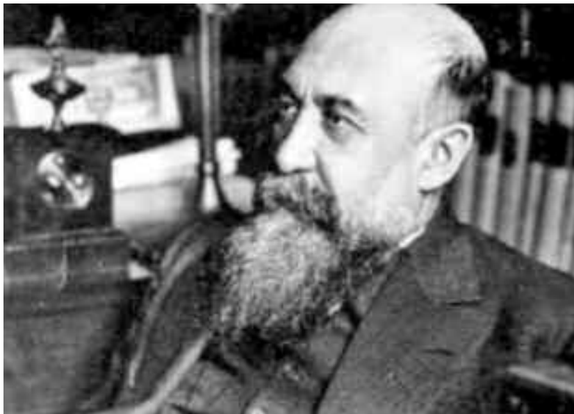
Nicolae Iorga s-a născut pe 5/17 iunie 1871 la Botoșani și a murit în 27 noiembrie 1940, la Strejnicu, județul Prahova

În anul 1921, ține prima lecție la Sorbona, iar în 1923 este numit membru corespondent al Academiei Suedeze. În anul 1927, Iorga efectuează călătorii în Franța, Danemarca, Suedia, Elveția și Italia. Primește titlul de Doctor Honoris causa al Universității din Geneva la 1