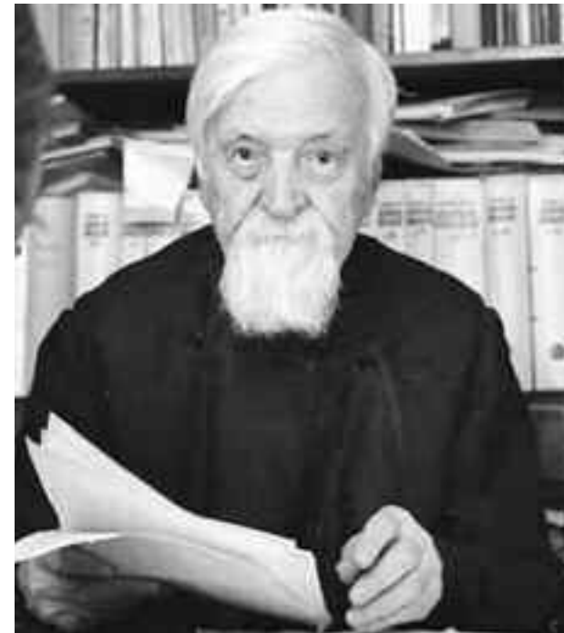
Dumitru Stăniloae își exprimă regretul că domnul Lucian Blaga a zădărnicit posibilitatea ca, creștinismul și în special ortodoxia românească să poată arăta în D-sa un exponent al lor, un luminător al unor taine fermecătoare ale lor

Domnul Lucian Blaga își mai sprijină teza religiei fără credință și fără fi-