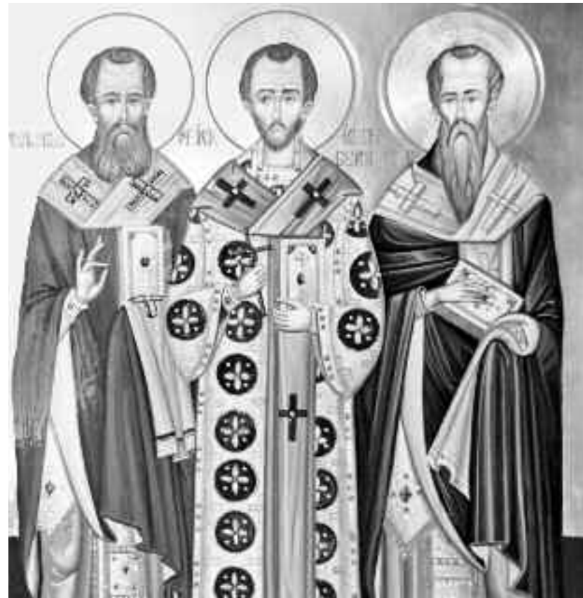
Sfinții Trei Ierarhi și mari dascăli ai lumii Vasile cel Mare, Grigorie de Dumnezeu Cuvântătorul (de Nazianz) și Ioan Gură de Aur

Sfântul Vasile este una dintre cele mai mari figuri ale creștinătății, distingându-se ca învățat, ascet, episcop și filantrop. În Cezarea, el a înființat instituții de asistență socială ca: azil, ospătarie, casă pentru reeducarea fetelor decăzute, școli tehnice și spitale, chiar și pentru leproși (leprozerii). Toate aceste așezăminte sunt cunoscute sub numele generic de "Vasilada". După moarte, Sfântul Vasile