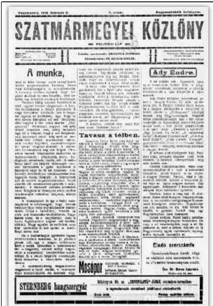
Szatmármegyei Közlöny, Carei, numărul 5, din 2 februarie 1919, pagina 1

Și în timp ce mi-am satisfăcut setea mea de cunoaștere cu wals și polka, atunci încă la modă, sete rămasă nesatisfăcută la cursurile de drept, s-a întâmplat și cu mine același lucru care s-a mai întâmplat cu unii studenți la drept în anul unu: m-am îndrăgostit.