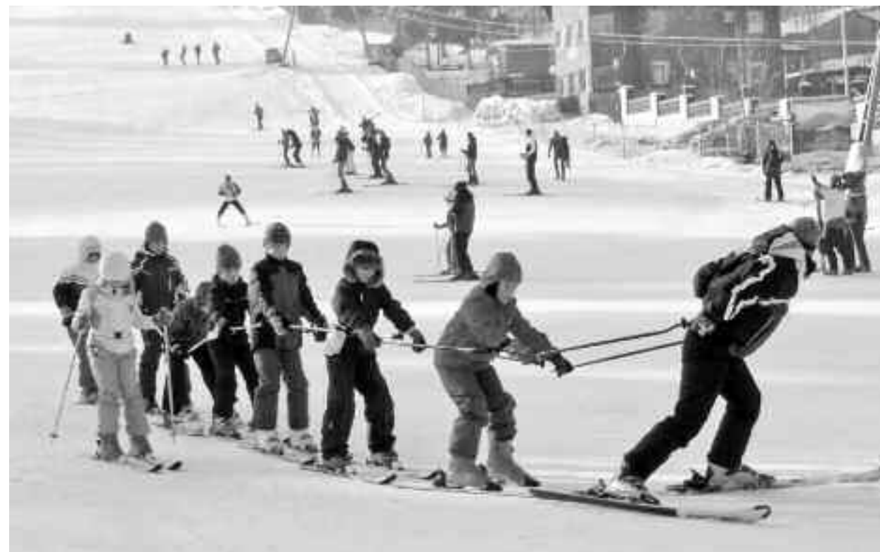
Tarifele, în cele mai multe stațiuni montane pornesc de la 250 de lei pe zi și cuprind pe lângă cazare și mese, activități diversificate, în special pentru copii

Cai, timp petrecut împreună, echitație, natură, familie și o atmosferă cu adevărat familială - acestea sunt promisiunile unor unități hoteliere pentru cei care își aleg să-și petreacă perioada vacanței din 3 - 8 februarie 2019 la ei. "Ne este dor de iernile copilăriei, de aceea vrem să le reproducem pentru toți cei care și-au păstrat sufletul de copil și pentru copiii lor. În lunile ianuarie și februarie te așteptăm să te bucuri de zăpadă, derdeluș, cai, natură și multe activități creative (olărit, pictură pe ceramică etc). Haideți să fim din nou copii alături de copiii noștri!" - astfel își invită oaspeții o pensiune cu profil de echitație, unde tariful în perioada sus menționată este de 1229 lei/persoană adultă în camera dublă/pachet 5 nopți. Se oferă pensiune completă (mic dejun, prânz, cină și gustări), începând cu cină de duminică și terminând cu micul dejun de vineri, acces la zona spa (saună, jacuzzi, camera salina), cu programare la recepție, atelieri pentru copii (olărit, pictură