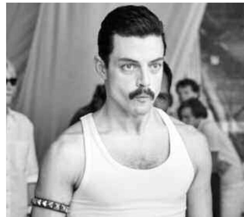
Rami Malek poate câștiga la Oscar cu rolul lui Freddie Mercury

Cel mai bun montaj de sunet: "Black Panther", "Bohemian Rhapsody", "First Man", "Roma" și "A Star Is Born".