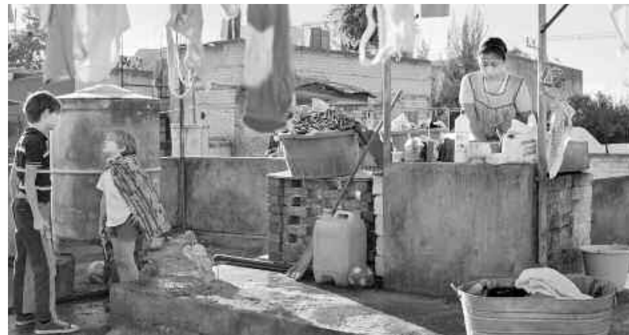
"Roma" este și prima producție Netflix care primește o nominalizare la categoria "cel mai bun film" a premiilor Oscar

Mahershala Ali ("Green Book"), Adam Driver ("BlackKkKlansman"), Sam Elliott ("A Star Is Born"), Richard E. Grant ("Can You Ever Forgive Me?") și Sam Rockwell ("Vice").