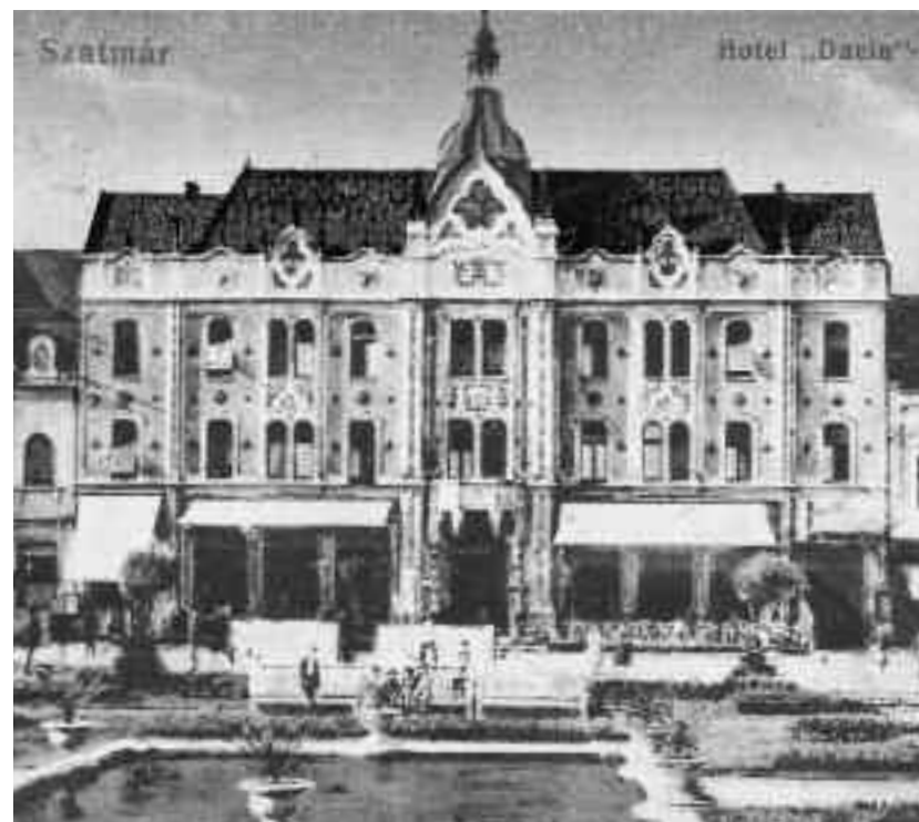
Hotelul Dacia în perioada interbelică

Domnul viceprimar a spus că comercializarea cărnii în condițiile menționate este impusă de normele sănătății publice, precum și de faptul ca cheltuielile mari făcute de oraș cu construirea noului aba-