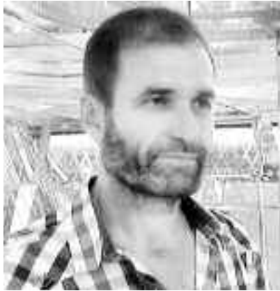
Gălățenii care au încercat deja tratamentele alternative ale psihologului spun că în interiorul piramidei și-au îmbunătățit starea de sănătate

„În momentul în care am făcut această piramidă dublă, suspendată, am avut dorința de a cerceta dacă există sau nu efectul de piramidă. Am urmărit să demontăm o legendă care spune că o piramidă simplă