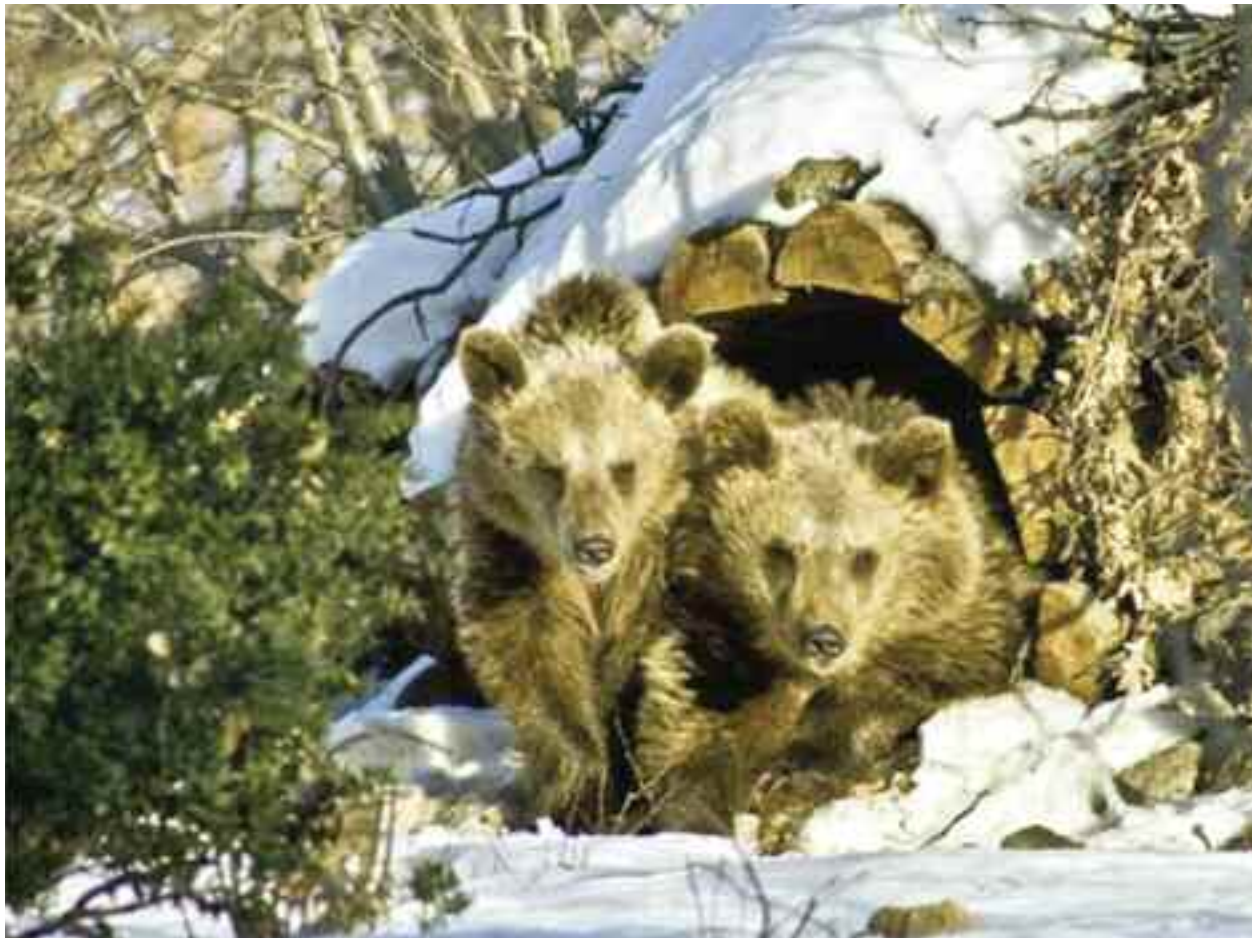
Ziua ursului, remarcă Simion Florea Marian, numită Sărbătoarea ursului, cade întotdeauna în ziua de Întâmpinarea Domnului. Românii știu că odată cu venirea iernii, a gerului și căderea zăpezii ursul își caută o vizuină, o peșteră în care își petrece toată iarna, hibernând sau "dormind somnul iernei"

Întâmpinarea Domnului se mai numește și Ziua cu lumina. Domnul este prin excelență Lumina spre care