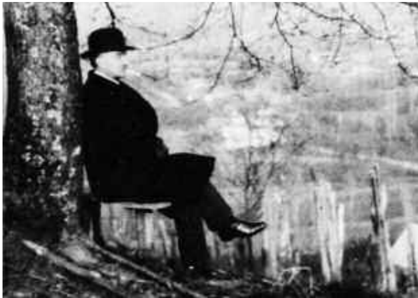
Iuliu Maniu pe “Dealul Țarinei” de la Bădăcin