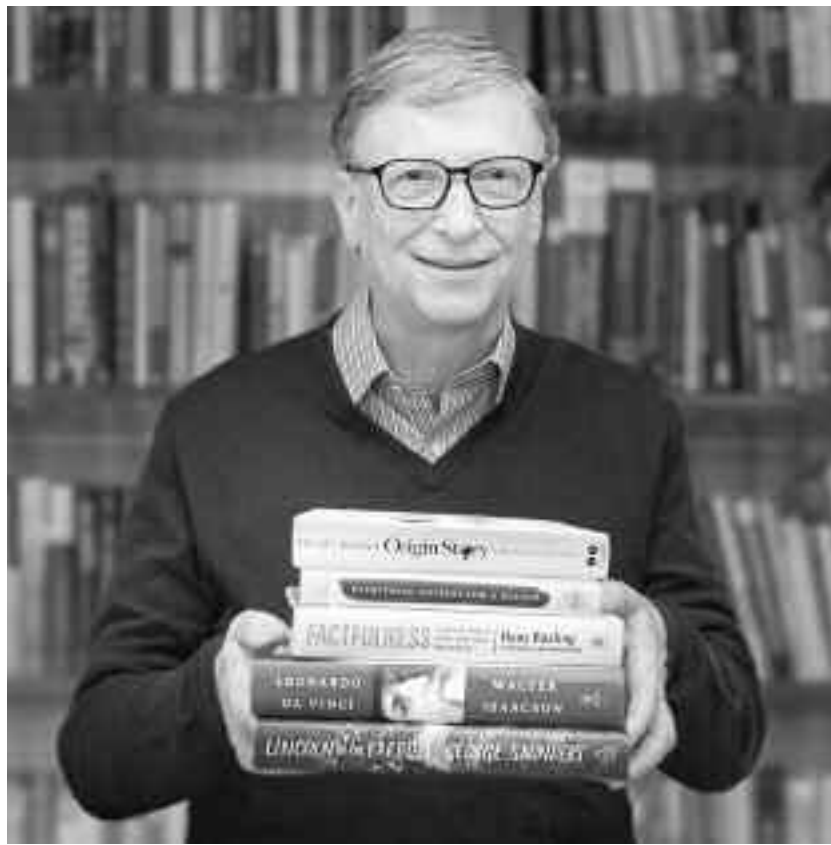
Gates are trei copii, iar fiecăruia îi va lăsa aproape 1,1% din averea sa, fiind de părere că este mai bine ca aceștia să își clădească singuri o carieră

Stalin este un personaj neobișnuit pentru istoria economică modernă: un dictator cu putere absolută care a controlat una dintre cele mai mari economii din lume. Deși este aproape imposibil de disociat averea lui Stalin de averea URSS, majoritatea economiștilor l-au declarat unul dintre cei mai bogați oameni din toate timpurile, în virtutea combinației unice dintre puterea economică pe care o avea și controlul complet al țării pe care a condus-o. Logica este simplă. Datele Organizației pentru Cooperare și Dezvoltare Economică (OCDE) arată că în 1950, cu trei ani înainte de moartea lui Stalin, URSS deținea în jur de 9,5% din economia mondială.