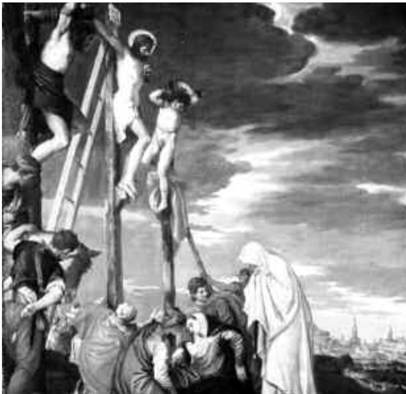
În biruirea morții pe Golgota se află obârșia forțelor care au putut aprinde din nou în sufletul omenesc forțele pierdute

Antroposofia nu este teorie, ci cunoaștere vie, ceea ce se reflectă în faptul că a pus toate premisele și a elaborat soluții valoroase în diferitele domenii aplicative