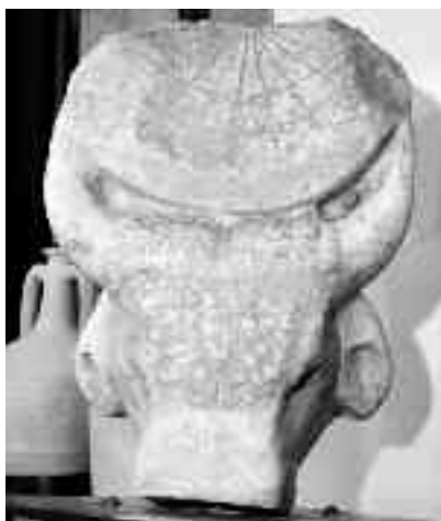
Este dovada că strămoșii noștri aveau cunoștințe temeinice de astronomie

amplasată într-un spațiu îngrijit, în fața Primăriei comunei Cumpăna, iar originalul se află la Muzeul de Istorie și Arheologie din Constanța (MINAC).