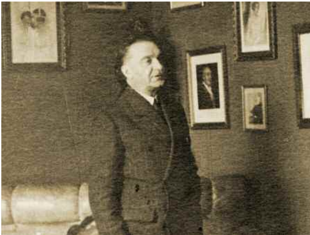
Iuliu Maniu în biroul său din casa natală de la Bădăcin. Printre tablourile de pe pereți îl avea și pe bătrânul liberal I.C. Brătianu.