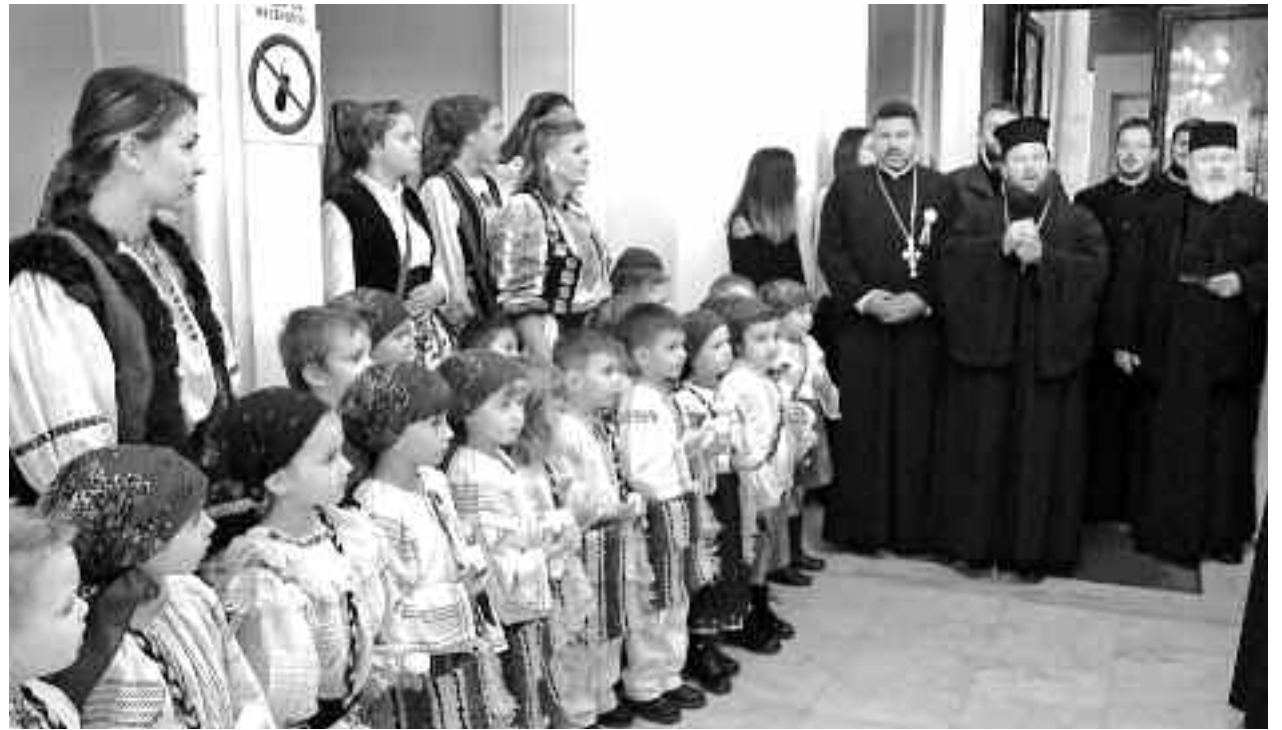
Momentul festiv a fost onorat de Preasfințitul episcop Timotei Sătmăreanul, arhiepiscop vicar al Episcopiei Ortodoxe a Maramureșului și Sătmăruului care a transmis mesajul de binecuvântare al episcopiei

Evenimentul, devenit unul cu tradiție, a fost onorat de: inspectorul general al Inspectoratului Județean