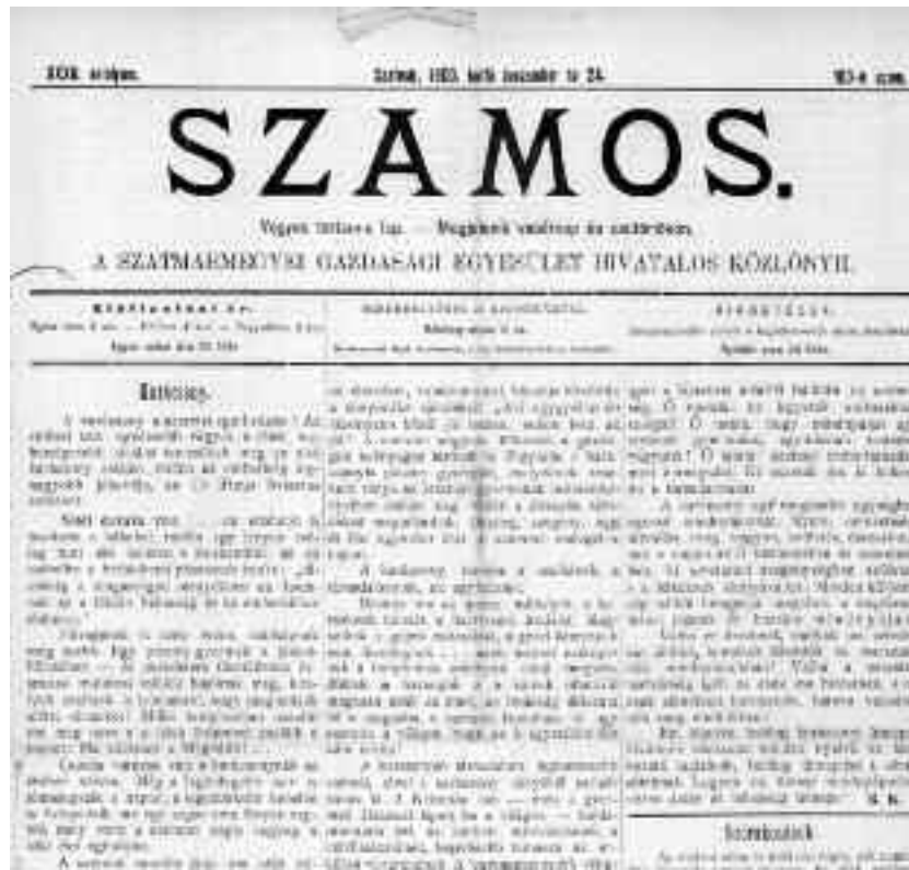
(Szamos, anul 23, nr. 103, 24 decembrie 1900, p. 1)

Cu această dorință urăm Crăciun fericit fiecărui locuitor al orașului nostru