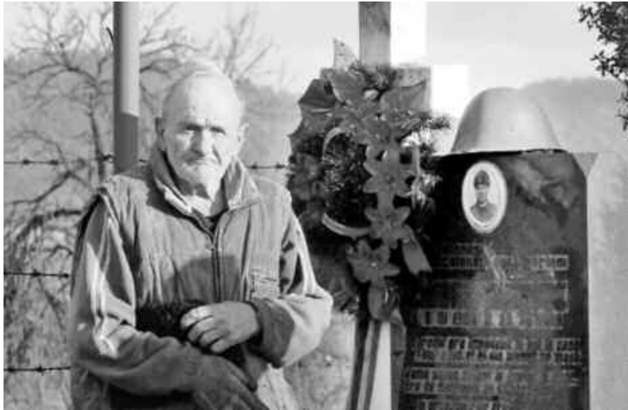
În județul Satu Mare cinstim în fiecare an memoria celor 7 tineri secerăți de gloanțele nu se știe ale cui