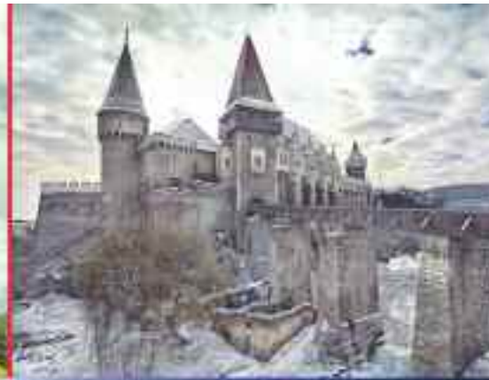
Castelul Bethlen, Arcalia