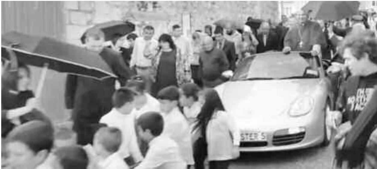
Videoclipul original a fost șters de pe internet de către reprezentanții bisericii din Malta, dar copii ale acestuia au reapărut pe YouTube și pe rețelele sociale, strângând deja milioane de vizualizări și indignarea internautilor din întreaga lume

"Îmi pare rău de reacția oamenilor care au văzut înregistrările, dar pentru mine acest lucru pur și simplu nu este o