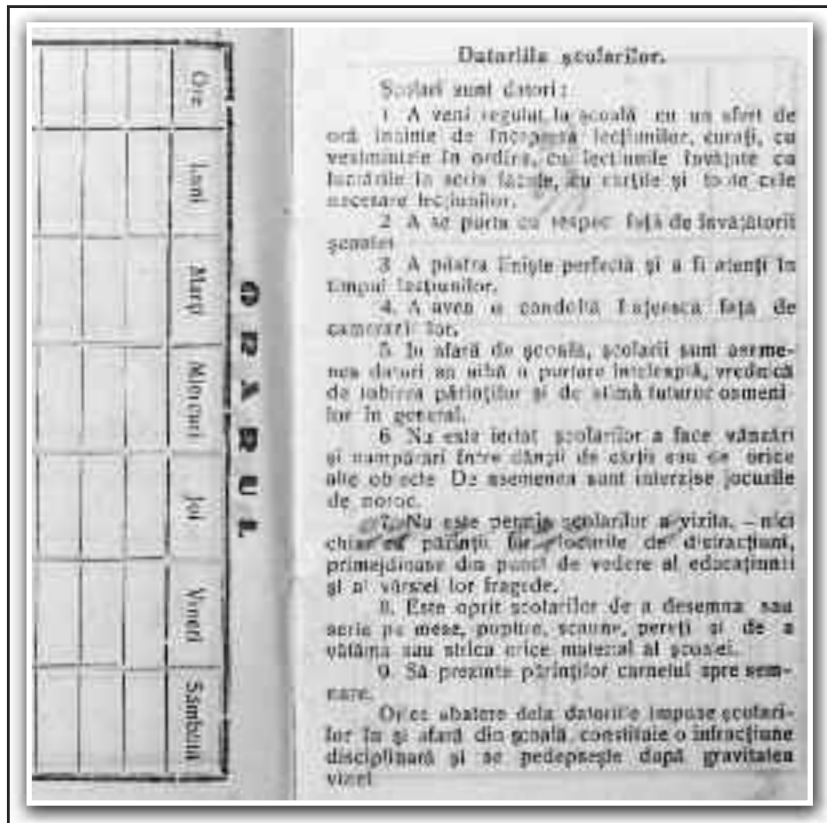
Carnetul școlarului din anul 1938 conținea și "Datoriile școlarelor"

Prima datorie a elevilor consta, în anul 1935, în „a veni regulat la școală cu un sfert de oră înainte de începerea lecțiilor, curății, cu veșmintele în ordine, cu lecțiile învățate, cu lucrările în scris făcute, cu cărțile și toate cele necesare lecțiilor”. Următoarele două reguli prevedeau ca elevii să se poarte cu respect față de fiecare dintre institutorii școlii, respectiv păstrarea liniștii perfecte și atenției maximă la ore. O altă obligație a elevilor în perioada interbelică era aceea de a avea o... purtare înțeleaptă, vrednică