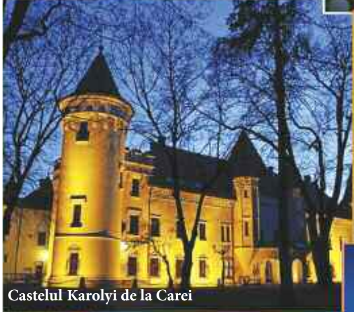
Castelul Karolyi de la Carei