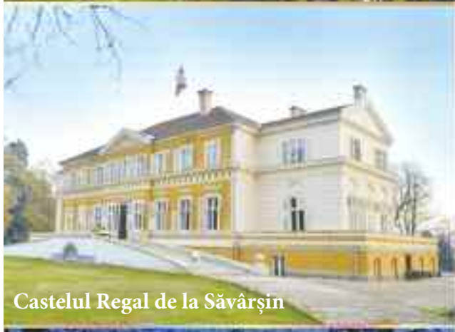
Castelul Regal de la Săvârșin