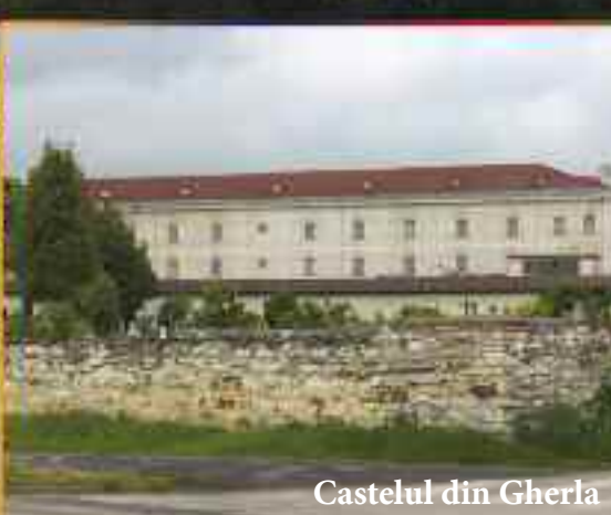
Castelul din Gherla