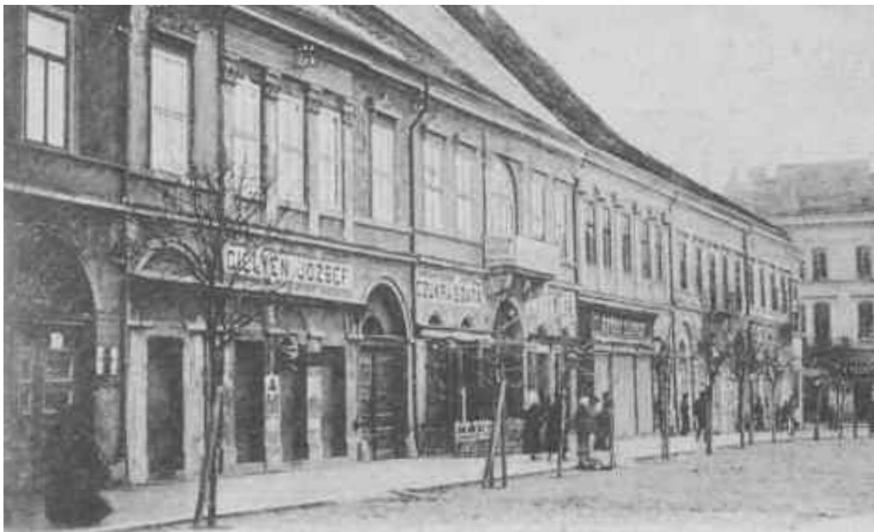
Piața Deak, azi Piața Libertății în anul 1900