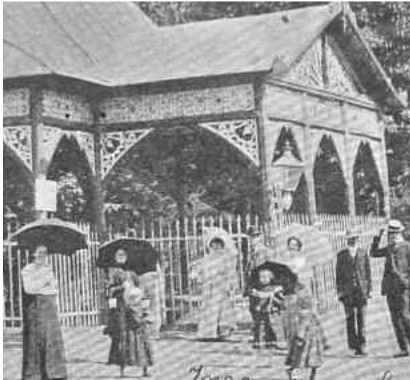
La început de secol XX, sătmărenii se relaxau la Băile Bixad sau Valea Măriei

Așa cum am procedat și până acum, asigurăm și în continuare spațiu publicistic pentru opinii opuse dacă ele poartă amprenta slujirii interesului public și a bune credințe. Însă nici în viitor nu vom privi nici o strădanie ca fiind o sarcină a