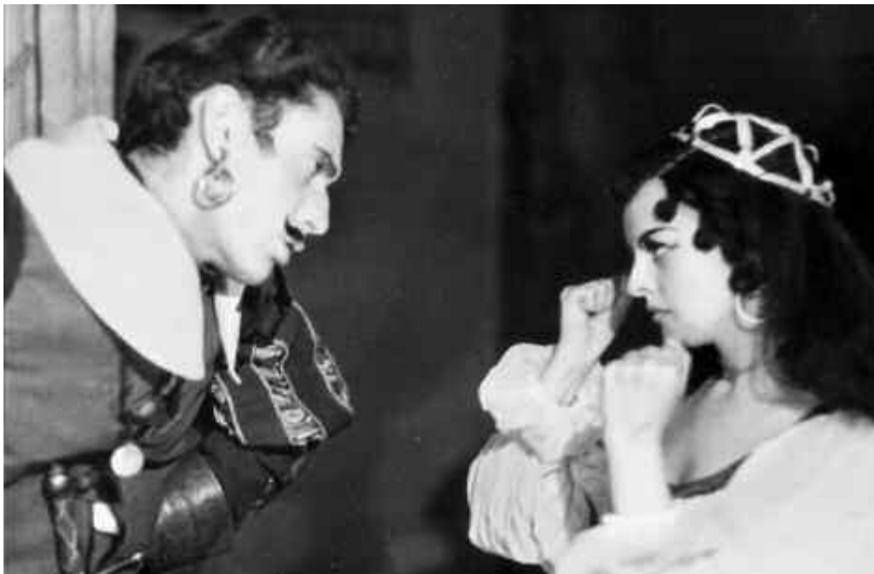
După război, pe perioada lucrărilor de renovare a clădirii teatrului, spectacolele sunt jucate în sala Cecil aflată în posesia bisericii romano-catolice