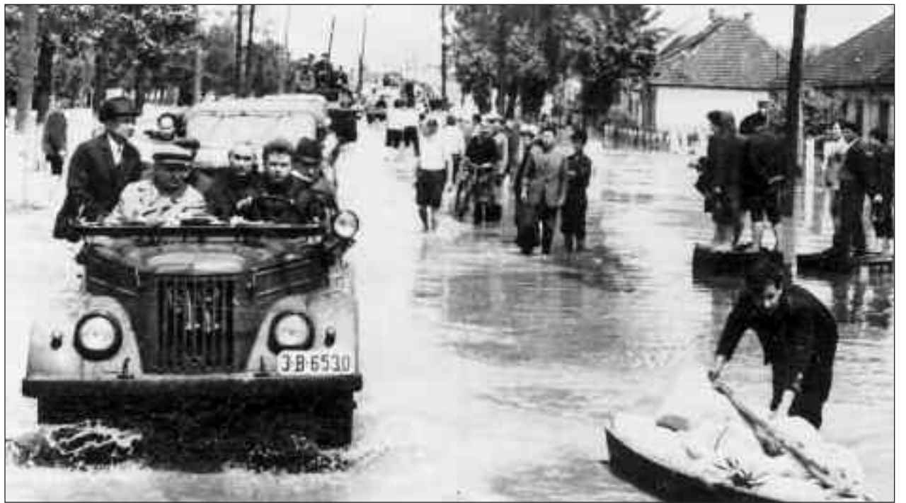
Nicolae Ceaușescu a vizitat Satu Mare în 16 mai 1970. După ce a văzut dezastrul produs de inundații, a luat legătura cu toți miniștrii, ordonându-le să vină la Satu Mare să participe la refacerea tuturor pagubelor din industrie și agricultură

Vizitarea comunei Urziceni s-a încheiat în jurul orei 15. În fața Comitetului Raional de partid Carei, s-au adunat peste 4000 de oameni. Nicolae Ceaușescu și-a exprimat mulțumirea pentru vizita la Carei și în localitățile învecinate și a insistat pentru unitatea tuturor locuitorilor, indiferent de naționalitate, pentru a face din România o țară prosperă, care să asigure un nivel înalt de viață pentru fiecare cetățean. Nicolae Ceaușescu a precizat că a venit la Carei, datorită faptului că aici la 25 Octombrie 1944 a fost eliberată ultima brazdă de pământ românesc de sub dominația horthysto-hitleristă, de către glorioasa armată română. Statuia Ostașului Român din Carei, opera marelui artist Vida Géza, s-a ridicat pentru cinstirea și amintirea pe vecie a eroilor Armatei Române, care au luptat vitejește, pentru ca Poporul Român să fie liber și independent, alături de toate popoarele lumii.