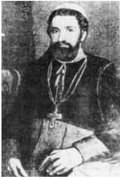
Inocențiu Micu-Klein avea vocația păstorului și politicianului înscut

Școala Ardeleană este opera preoților și dascălilor, fie că vorbim de sfera Blajului, fie de cea a Sibiului, Banatului,