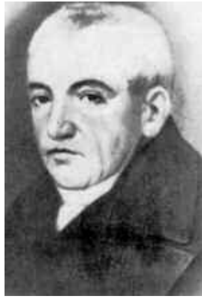
Petru Maior, vârful de lance al Școlii Ardelene

Discursul de la Blaj al lui Simion Bărnuțiu creează practic naționalismul românesc. Rațiunea politică imediată a Discursului de la Blaj a fost evitarea unirii politice a Ardealului cu Ungaria.