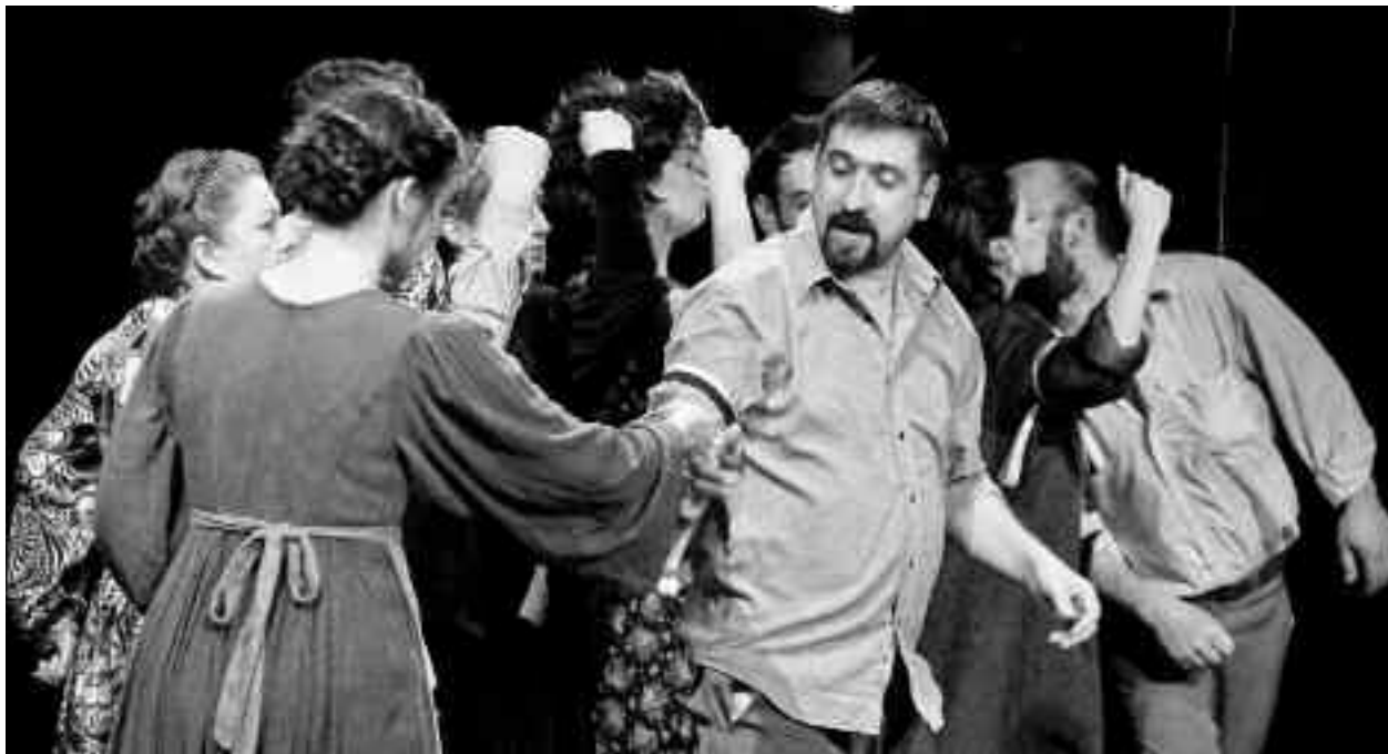
Mai ales în prima sa parte, spectacolul explorează cu atenție felul în care colectivitatea se transformă într-un monstru

Așadar, Uniunea Sovietică tocmai s-a destrămat. Căutându-și identitatea, moldovenii își proclamă independența și trec la grația latină, recunoscând că limba lor e, în fond și la urma urmei, cea română, cu răsmele de rigoare cu tot. La malul Nistrului, familia unui pădurar care răspunde și de o zonă de dincolo de râu intră în frenezia război-