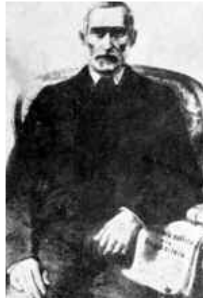
Discursul lui Simion Bărnuțiu creează practic naționalismul românesc

Alexandru Papiu Ilarian elaborează studiul despre responsabilitatea ministerială. Este răsturnat în noiembrie 1868, de către guvernul conservator al