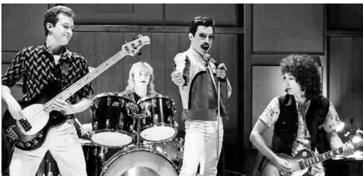
Trupa Queen, recreată pentru marele ecran de patru actori aleși pe sprânceană într-un film de mare succes la public

În primul rând, implicarea directă a lui Brian May și Roger Taylor în revizuirea scenariului a redus mult din impactul și provocările pe care filmul și le propunea inițial. E de înțeles ca membrii Queen rămași în activitate să își dorească un control asupra imaginii trupei lor. Castingul a fost făcut cu mare grijă, cei patru muzicieni găsindu-și actori pe măsură cel puțin din punct de vedere vizual. Unele momente au un plus de autenticitate, altele sunt pură