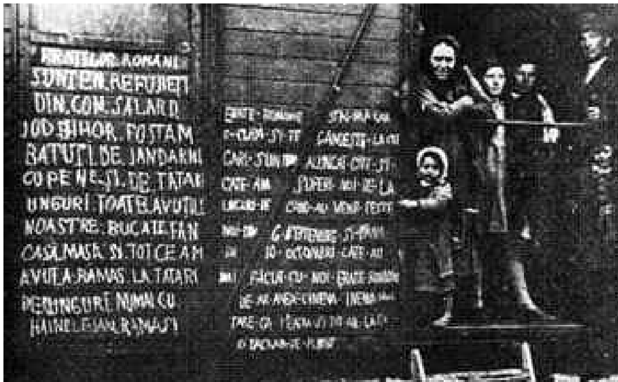
Refugiați din comuna Sălard, județul Bihor, îmbarcați în vagoane de marfă

Cu ocazia Adunării Generale, după Raportul prezentat, s-a trecut la alegerea Consiliului județean și a Consiliului de conducere format din 11 persoane, iar ca structură organizatorică: Conferința județeană și filiale în fiecare localitate în care s-au înregistrat refugiați, expulzați și deportați. Din datele deținute de Casa Județeană de Pensii, rezultă că în anul 2000 mai erau în viață peste 6000 de persoane care s-au încadrat în categoria prevăzută de Ordonanța Guvernului României nr. 105/1999 și de Legea nr. 189/2000. Tribunalul Satu Mare ne-a acordat Statutul de "personalitate juridică".