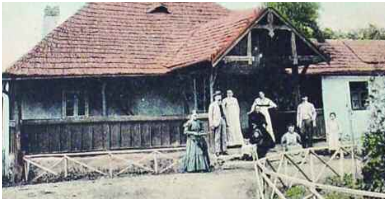
Vedere de la începutul secolului XX cu sediul Poștei din Vama