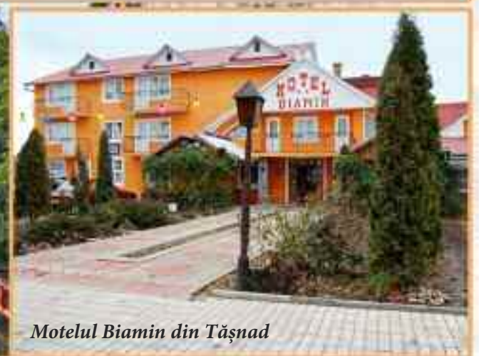
Motelul Biamin din Tășnad

În timp ce, cu câțiva ani în urmă abia cu 2-3 săptămâni înainte de sărbători am început să ne gândim unde vrem să petrecem Crăciunul sau Revelionul, în zilele noastre, cu 2-3 luni înainte, adică prin septembrie - octombrie se pare că suntem în întârziere și ne luptăm pentru ultimele locuri disponibile, dacă vrem să ne rezervăm o cameră în anumite stațiuni.