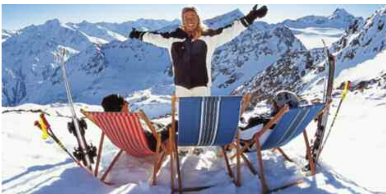
Dacă în decembrie e ger bun, atunci va fi vară secetoasă și călduroasă, iar dacă în luna aceasta va fi vremea domoală, vara va fi ploioasă

Dacă în decembrie e ger bun, atunci va fi vară secetoasă și călduroasă, iar dacă în luna aceasta va fi vremea domoală, vara va fi ploioasă. Alte prevestiri de timp spun că atunci când câinii latră la lună urmează ger mare, dar și faptul că neaua și gerul din decembrie vestesc grâu mult în anul care vine. Bătrânii mai obișnuiau să spună: