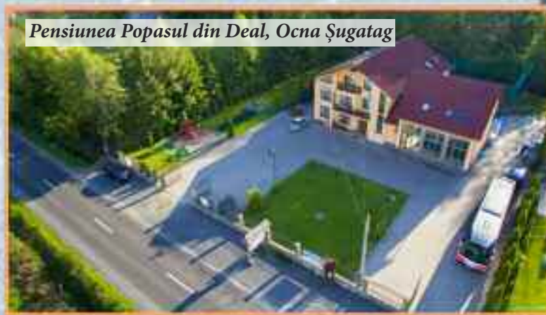
Pensiunea Popasul din Deal, Ocna Șugatag