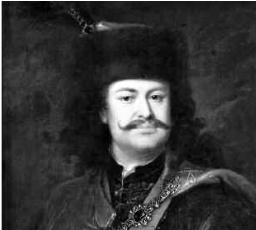
Răscoala condusă de Francisc Rákóczi al II-lea a încercat să-i unească pentru prima dată într-o singură tabără pe nobili și pe iobagi

În anul 1694, sfidând voința curții imperiale, s-a căsătorit cu Charlotte Amalie, prințesă de Hessen-Wanfried, cu care a avut trei copii. În urma căsătoriei a ajuns în relații de rudenie cu mai multe dinastii regale din vestul Europei, printre care regele Franței, Lu-