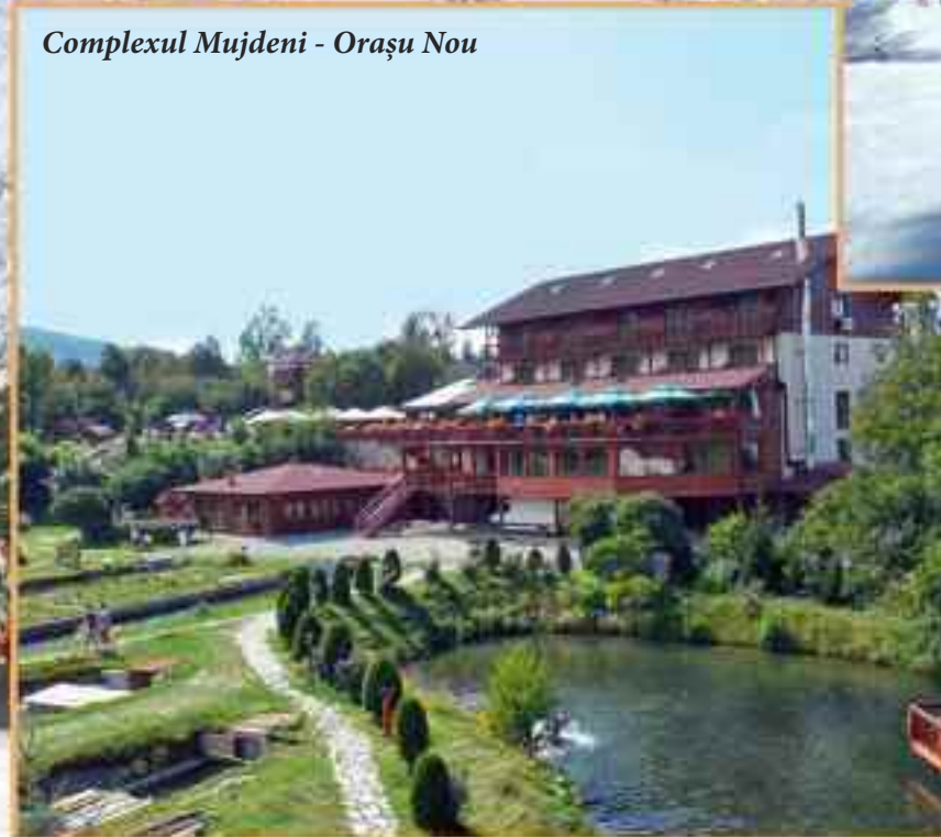
Complexul Mujdeni - Orașu Nou