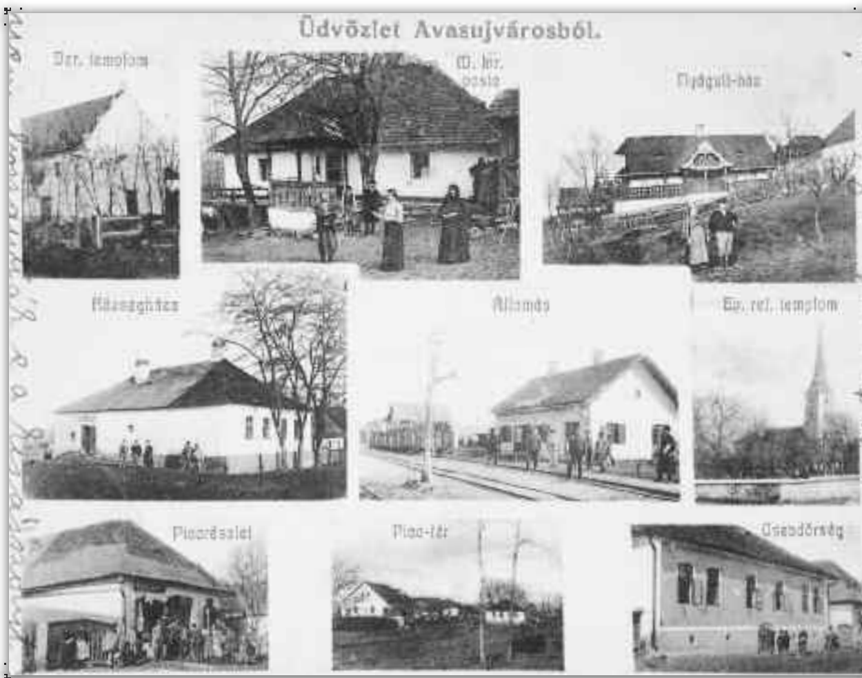
Carte poștală din Orașu Nou la începutul secolului XX

Plasa Oașiu era alcătuită din 16 sate, avea 28.300 locuitori, majoritatea români și se întindea pe o suprafață de 563 km 2 : Orașu Nou (1270, Nova Civitas); Racșa (1493, Rakos); Prilog (1270, poss. Barlag); Remetea Oașului