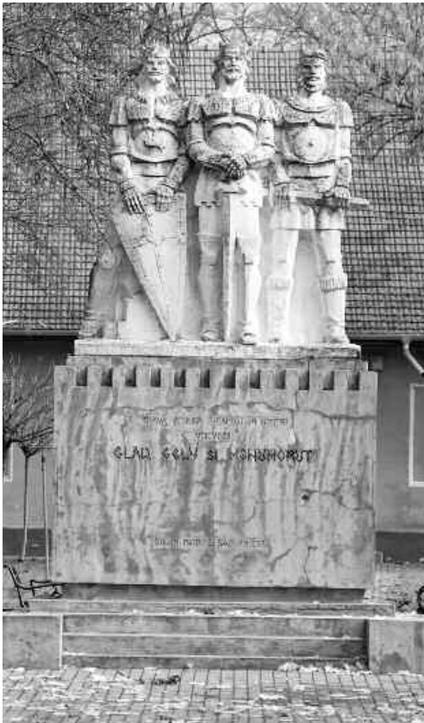
Statuile lui Glad, Gelu și Menumorut din comuna Macea, județul Arad

Gelu reprezintă simbolul luptei și jertfei pentru apărarea pământului străbun.