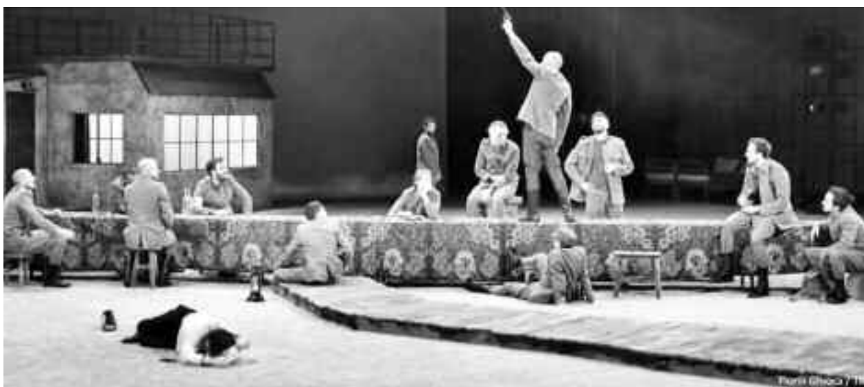
Premiera spectacolului va avea loc duminică, 16 decembrie 2018, ora 19.00, la Sala Mare

“Nu vreau să pun în scenă cartea lui Rebreanu, vreau să chestionez puțin ce s-a întâmplat cu noi în suta asta de ani și unde suntem... S-ar putea să fie ambițios, riscant, kitschos, greșit, dar aș vrea să pun față în față soldații aceia care au luptat pentru ceva atunci, deși mulți nu știau pentru ce luptă, cu niște tineri din zilele noastre, cu niște dialoguri și întrebări... Ce ați făcut în 100 de ani, cine eram noi la vârsta voastră, ce am făcut... Mi se pare că prea vorbim despre istoria noastră recentă ca despre