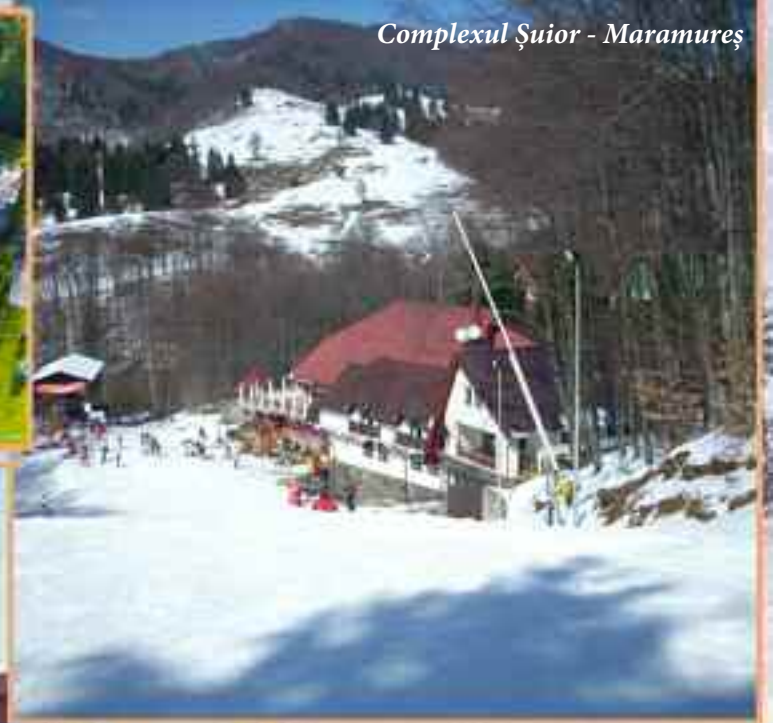
Complexul Șuior - Maramureș