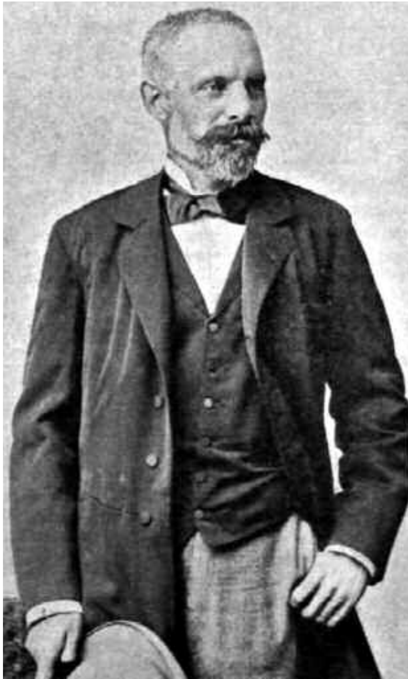
Plósz Sándor (1846-1925), ministru al justiției între 26 februarie 1899 - 18 iunie 1905, a promis o mai mare protecție pentru creditori

Așa cum am aflat, firma Neuschloss a achiziționat recent o pădure