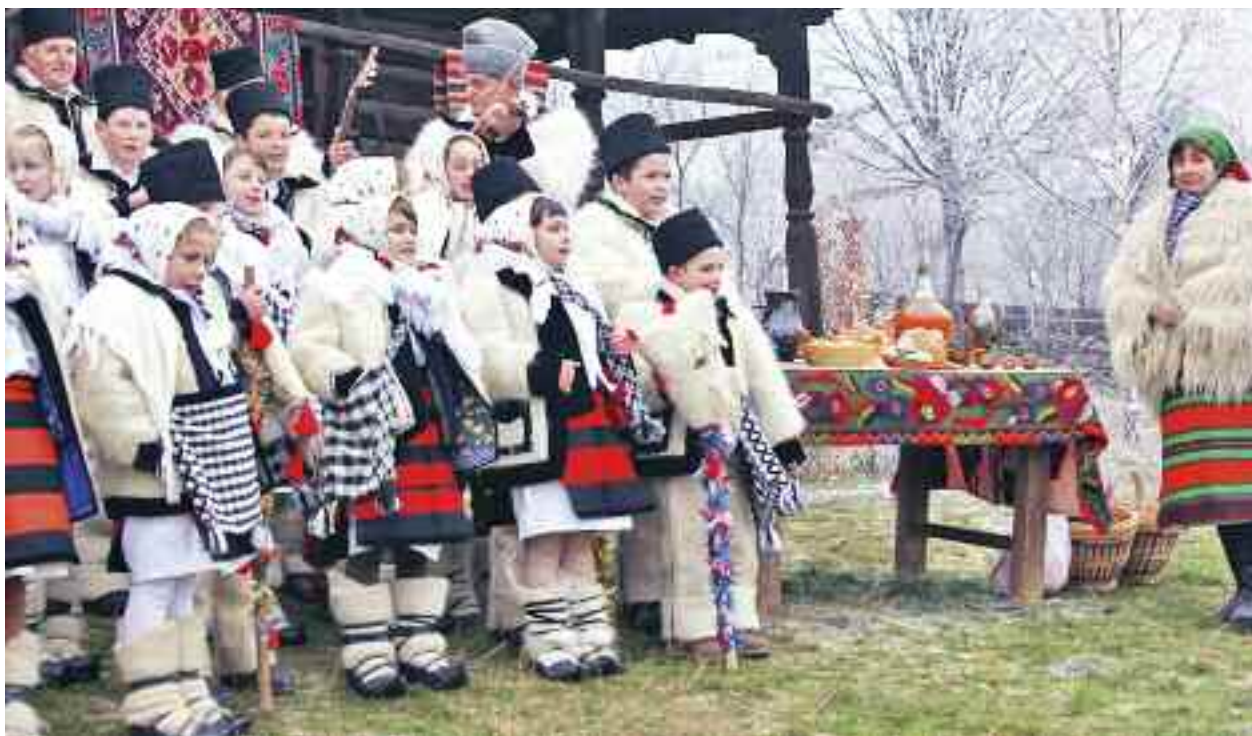
Colindătorii nu intră decât în casele care au porțile deschise și lumina aprinsă

Referitor la colindători, e bine de știut ca aceștia nu intră decât în casele care au porțile deschise și lumina aprinsă. Aceste două semne dau de veste colindătorului că gospodarul casei își dorește să primească vestea bună a nașterii Lui Hristos și că e mai mult decât bucuros să îi omenească pe colindători cu de-ale gurii.