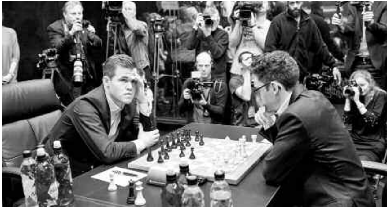
Campionul mondial Magnus Carlsen (stânga) și contracandidatul său Fabiano Caruana (dreapta) ocupau la începutul meciului de la Londra primele două locuri în clasamentul FIDE, fiind separați doar de 3 puncte Elo

1. e4 c5 2. Cf3 Cc6 3. Nb5 g6 4. Nxc6 dxc6 5. d3 Ng7 6. h3 Cf6 7. Cc3 Cd7 8. Ne3 e5 9. 0-0 b6 10. Ch2 Cf8 11. f4 exf4 12. Txf4 Ne6 13. Tf2 h6 14. Dd2 g5 15. Taf1 Dd6 16. Cg4 0-0-0 17. Cf6 Cd7 18. Ch5 Ne5 19. g4 f6 20. b3 Nf7 21. Cd1 Cf8 22. Cxf6 Ce6 23. Ch5 Nxh5 24. gxh5 Cf4 25. Nxf4 gxf4 26. Tg2 Thg8 27. De2 Tgx2+ 28. Dxc2 De6 29. Cf2 Tg8 30. Cg4 De8 31. Df3 Dxc5 32. Rf2 Nc7 33. Re2 Dg5 34. Ch2 h5 35. Tf2 Dg1 36. Cfl h4 37. Rd2 Rb7 38. c3 Ne5 39. Rc2 Dg7 40. Ch2 Nxc3 41. Dxf4 Nd4 42. Df7+ Ra6 43. Dxc7 Tg7 44. Te2 Tg3 45. Cg4 Txb3 46. e5 Tf3 47. e6 Tf8 48. e7 Te8 49. Ch6 h3 50. Cf5 Nf6 51. a3 b5 52. b4 cxb4 53. axb4 Nxe7 54. Cxe7 h2 55. Txb2 Txe7 56. Th6 Rb6 57. Rc3 Td7 58. Tg6 Rc7 59. Th6 Td6 60. Th8 Tg6 61. Ta8 Rb7 62. Th8 Tg5 63. Th7+ Rb6 64. Th6 Tg1 65. Rc2 Tf1 66. Tg6 Th1 67. Tf6 Th8 68. Rc3 Ta8 69. d4 Td8 70. Th6 Td7 71. Tg6 Rc7 72. Tg5 Td6 73. Tg8 Th6 74. Ta8 Th3+ 75. Rc2 Ta3 76. Rb2 Ta4 77. Rc3 a6 78. Th8 Ta3+ 79. Rb2 Tg3 80. Rc2 Tg5 81. Th6 Td5 82. Rc3 Td6 83. Th8 Tg6 84. Rc2 Rb7 85. Rc3 Tg3+ 86. Rc2 Tg1 87. Th5 Tg2+ 88. Rc3 Tg3+ 89. Rc2 Tg4 90. Rc3 Rb6 91. Th6 Tg5 92. Tf6 Th5 93. Tg6 Th3+ 94. Rc2 Th5 95. Rc3 Td5 96.