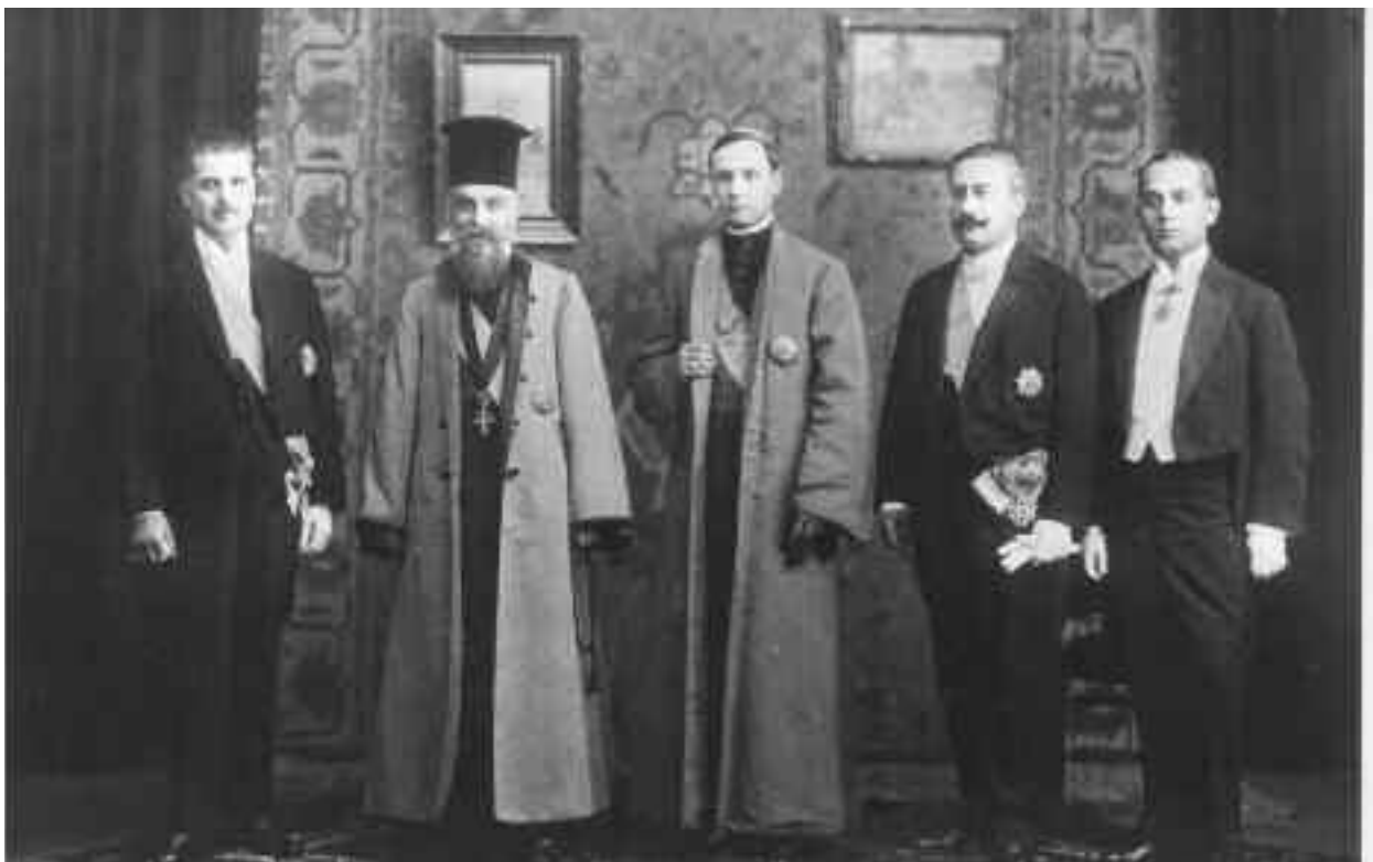
Delegația care a dus actul Unirii la București, Regelui Ferdinand I: Vasile Goldiș, Miron Cristea, Iuliu Hossu, Alexandru Vaida-Voevod și Caius Brediceanu