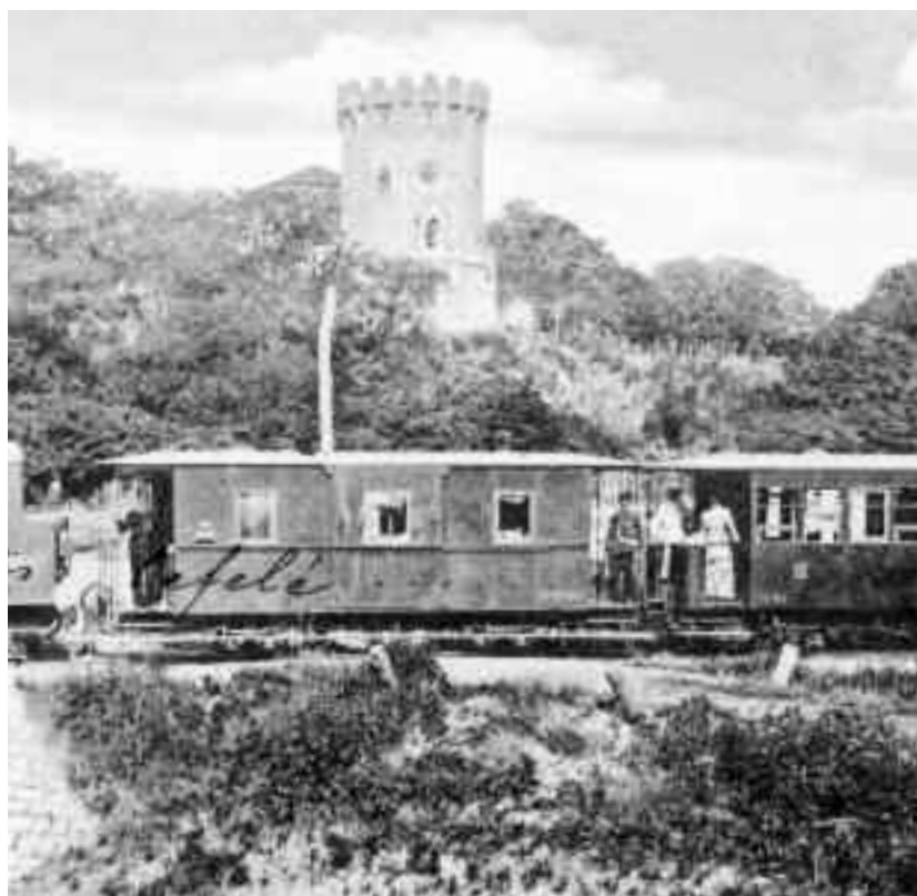
Carte poștală din 1902 cu trenul Zsuzsi care circula pe ruta Satu Mare-Arduș

S-a născut o clasă nouă în sânul societății noastre, un stat nou în cadrul statului: cel al delapidatorilor. Este vorba de o tabără impunătoare care sperie oamenii de rând prin obrăznicia și curajul ei.