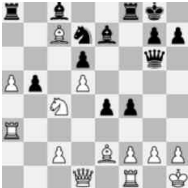
Partida a 10-a, cea mai intensă luptă a meciului. Poziția după mutarea 21 a negrului