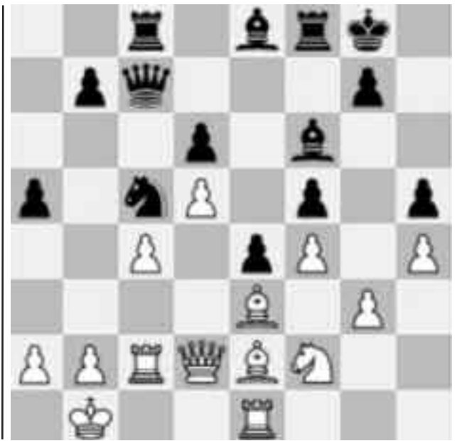
În ultima partidă cu timp de gândire standard Carlsen a dominat cu negrele, dar a propus remiză

Th6 Rc7 97. Th7+ Td7 98. Th5 Td6 99. Th8 Tg6 100. Tf8 Tg3+ 101. Rc2 Ta3 102. Tf7+ Rd6 103. Ta7 Rd5 104. Rb2 Td3 105. Txa6 Txd4 106. Rb3 Te4 107. Rc3 Tc4+ 108. Rb3 Rd4 109. Tb6 Rd3 110. Ta6 Tc2 111. Tb6 Tc3+ 112. Rb2 Tc4 113. Rb3 Rd4 114. Ta6 Rd5 115. Ta8 ½-½