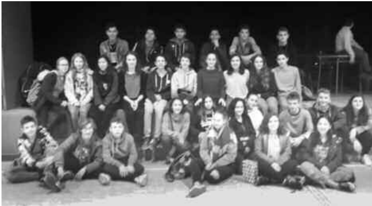
La întâlnire au participat reprezentanți membri în echipa de proiect din țările partenere, România, Turcia, Macedonia și Germania

Nici vizitele culturale nu au lipsit, acestea fiind organizate și sub semnul clădirilor de patrimoniu UNESCO.