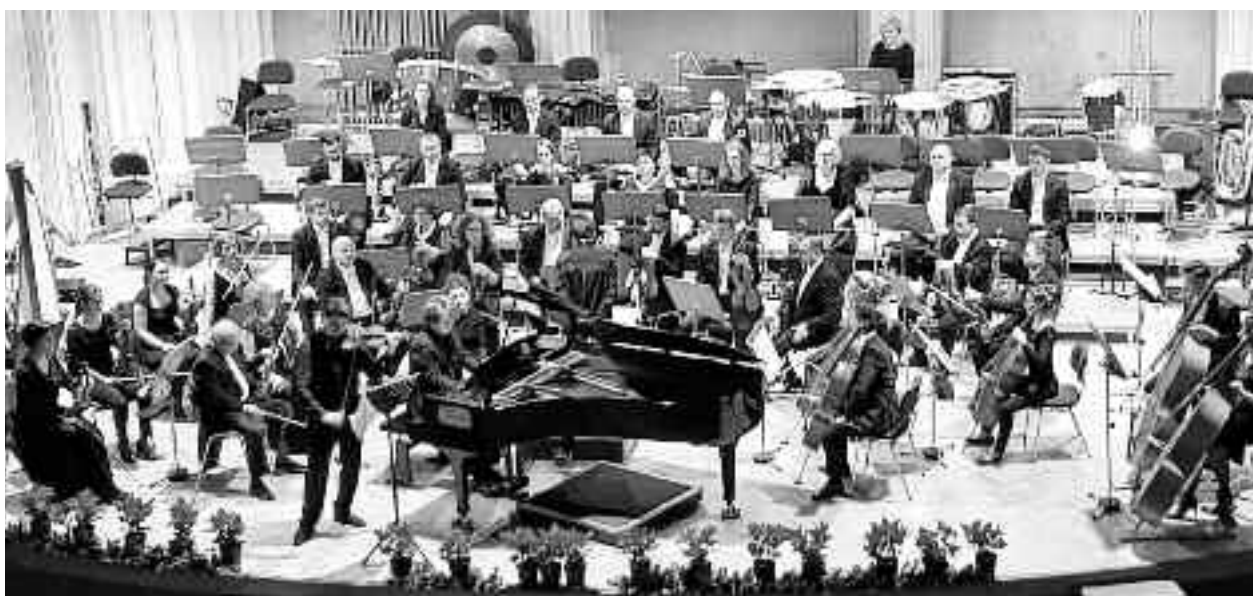
Programul a fost deschis de una din lucrările pe care Felix Mendelssohn-Bartholdy le-a compus în preajma vârstei de 14 ani, pe când ieșea de sub aura renumelui de copil-minune îndreptându-se spre maturitatea artistică