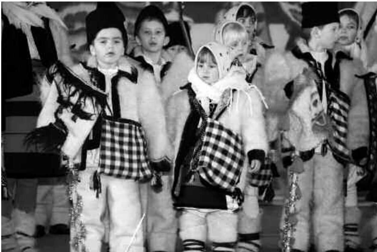
În Ajunul Crăciunului, pe înserat, în toate satele din țară, începe colindatul. Copiii cu steaua vestesc Nașterea Domnului și sunt primiți cu bucurie de gazdele care îi răsplătesc cu mere, nuci și colaci, fiind încă zi de post

La 6 decembrie este cinstit Sf. Nicolae, Sf. Neculai, Sf. Ierarh Nicolae, Arhiepiscopul Mirelor Lichiei, sfântul protector al copiilor, femeilor și corăbierilor, apărător de rele și făcător de minuni. Se considera