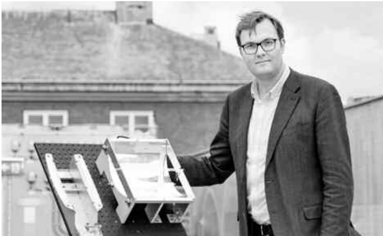
Dacă totul merge așa cum este planificat, Moth-Poulsen crede că tehnologia ar putea fi disponibilă pentru uz comercial în 10 ani

Fluidul este format din molecule speciale în formă lichidă, la a căror îmbunătățire oamenii de știință de la Universitatea de Tehnologie din Chalmers, Suedia, lucrează de un an. Această moleculă este compusă din carbon, hidrogen și azot, iar atunci când este expusă la lumina Soarelui, legăturile dintre atomii săi sunt rearanjate și se transformă în izomer. Energia de la Soare este astfel captată între legăturile chimice puternice ale izomerului și rămâne acolo chiar și atunci când mole-