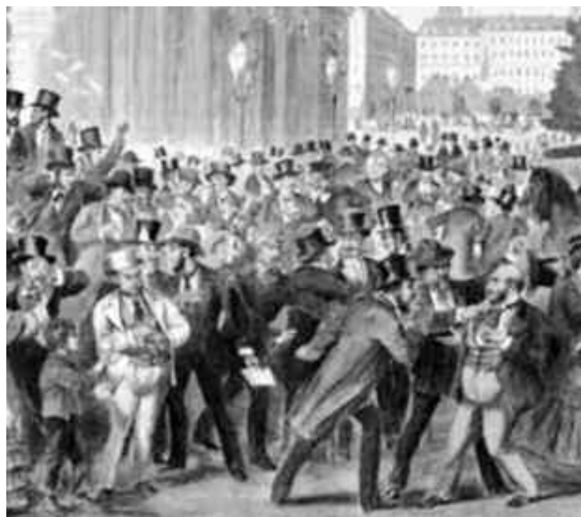
Viena 9 mai 1873, căderea Bursei