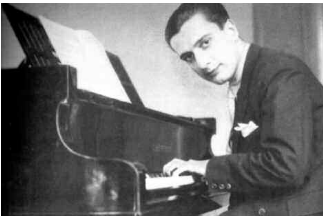
A rămas celebru în toată lumea concertul de la Besançon, din luna septembrie 1950, considerat cântecul lui de lebedă

După mai multe încercări, medicii i-au pus diagnosticul: o formă de leucemie, maladia Hodgkin. Madeleine, soția lui, a fost informată atunci că Dinu mai avea de trăit doar câteva luni. Și totuși, avea să