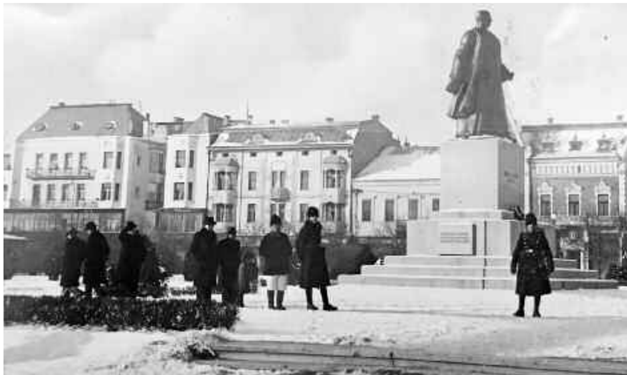
Parcul Carol al II-lea, statuia lui Vasile Lucaciu în perioada interbelică. Inscripția originală de pe soclu conținea textul “Neînfricatul apărător al drepturilor poporului român și apostol al Unirii”.

- Nu vreau - așa i-a spus el corespondentului nostru - ca această veste să se răspândească și prietenii mei să se folosească de ea pentru unele instigări, pe