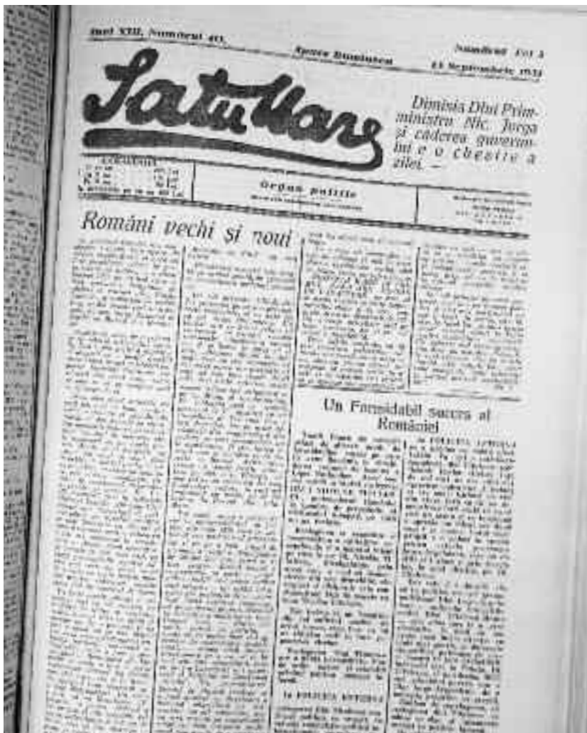
Satu Mare, Anul XIII, Nr. 40, 13 septembrie 1931, pag. 1

Cu toate acestea găsești și azi oameni care își zic români cu pretenții de stâlpi ai românismului, oameni care în orbia și dorința lor de a parveni și a-și face reclamă nu se dau înapoi nici de la crima distrugerii puținelor instituții românești. Confratele crede a face o glumă dând în Reuniunea "V. Lucaciu" și crede a face o operă românească slăvind doi domni, care atât acum cât și în trecutul apropiat s-au remarcat ca și buni distrugători. Un lucru este cert, că nu Reuniunea "V. Lucaciu" e prima victimă a lor; au fost și alte societăți, tot așa de infloritoare și tot așa de active, care au fost distruse - poate pe vecie - cu un singur gest. E destul să amintim