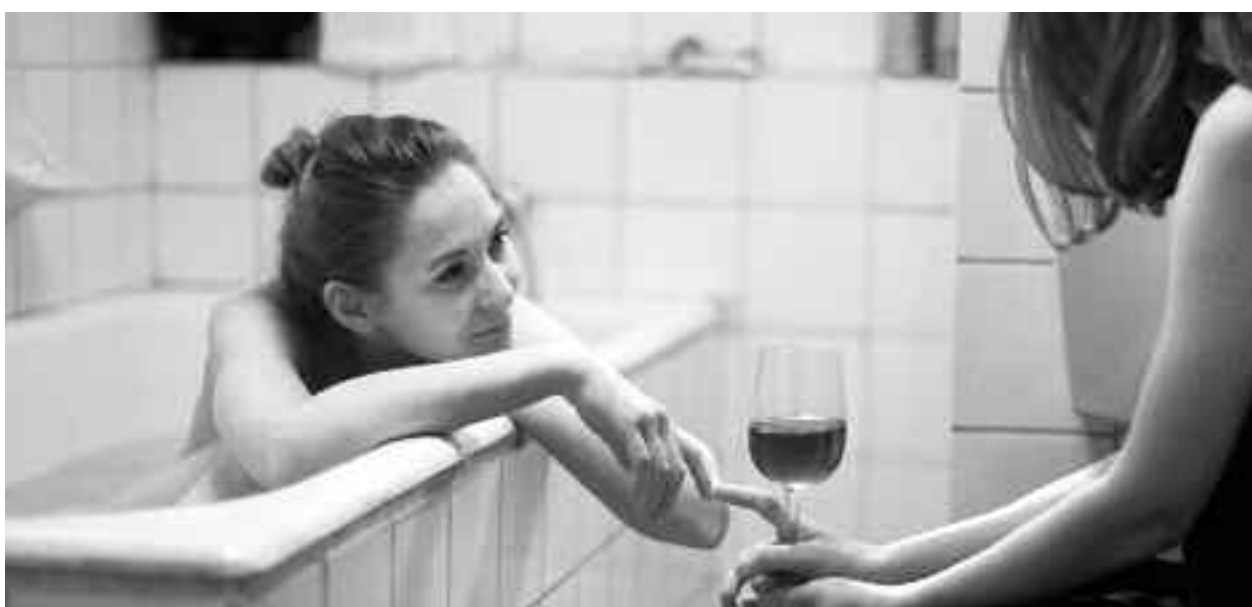
Scenă din filmul „Câteva conversații despre o fată foarte înaltă”, regizat de Bogdan Theodor Olteanu

El spune că este posibil ca direcția muzeului, Liliانا Passima, care a luat decizia, să aibă dreptate: „Conduce un muzeu extraordinar, care a trecut prin vremuri complicate și are de dus multe bătălii în intern, nu do-