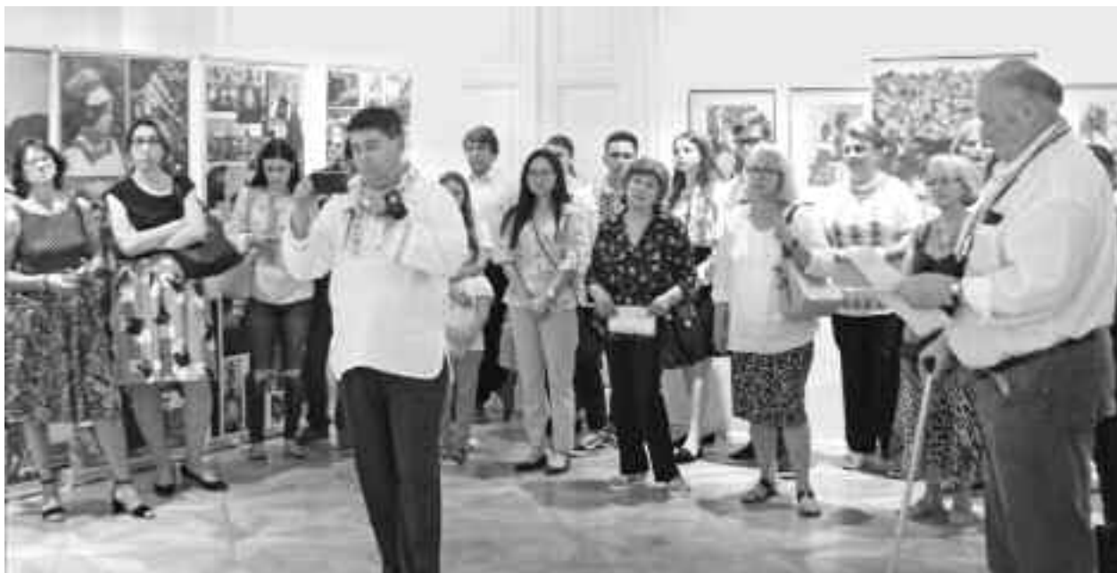
Expoziția "Centenarul în ipostaze identitare", ce a avut loc în data de 17 iunie, la Institutul Cultural Român din Viena