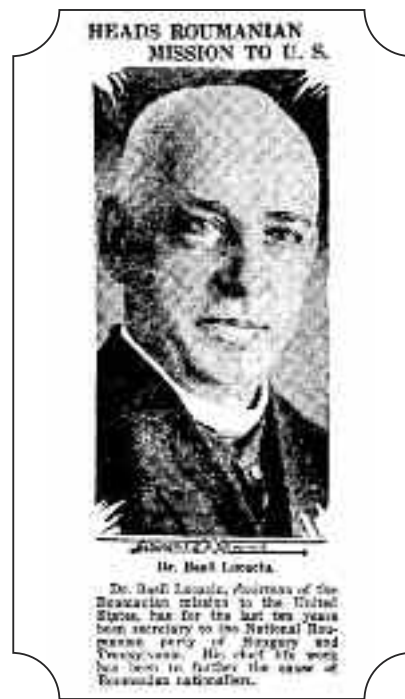
Fotografie apărută în ziarul american "Arizona Republic", numărul din 8 august 1917