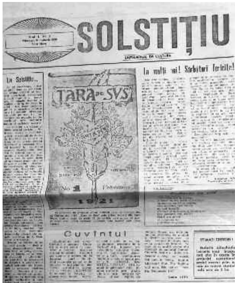
Solstițiu, săptămânal de cultură - Anul I, Nr. 1, pagina 1

Aceste bălți stătute de grandomanie sfidau până și dictonul "Minte sănătoasă în trup sănătos". Debilitatea lor intelectuală era în contrast evident cu prosperitatea fizică. Minți bolnave la trupuri pleznind de sănătate. "Spiritul lor revoluționar" s-a format inhalând grohăiturile sacadate ale "șefului", cuvinte rupte de înțelesul lor