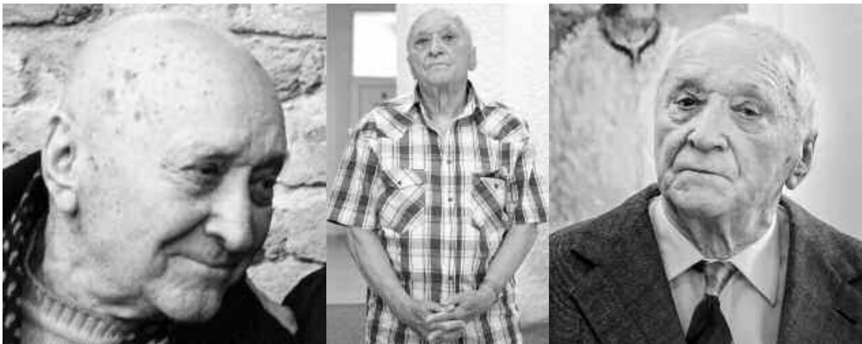
De la stânga la dreapta: una din ultimele fotografii ale artistului (16 februarie 2018) și imagini de la vernisaje desfășurate la Primărie și la Muzeul de Artă