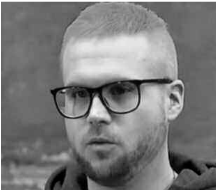
Christopher Wylie, britanicul care a dezvăluit presei afacerile dubioase ale companiei Cambridge Analytica

Într-o investigație jurnalistică sub acoperire difuzată de postul Channel 4 News, șefi din cadrul Cambridge Analytica au afirmat că atât firma pe care o reprezintă, cât și compania sa mamă, Strategic Communications Laboratories (SCL), au fost implicate în peste 200 de campanii electorale din diferite țări din lume, inclusiv din Nigeria, Kenya, Cehia, India și Argentina.