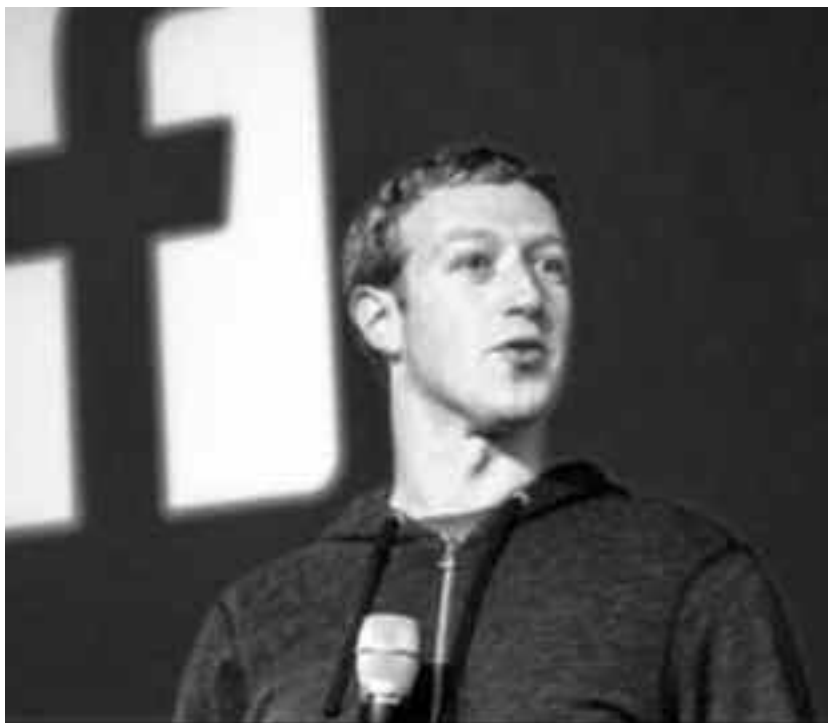
Mark Zuckerberg, președintele și fondatorul Facebook, este chemat la audieri de mai multe guverne