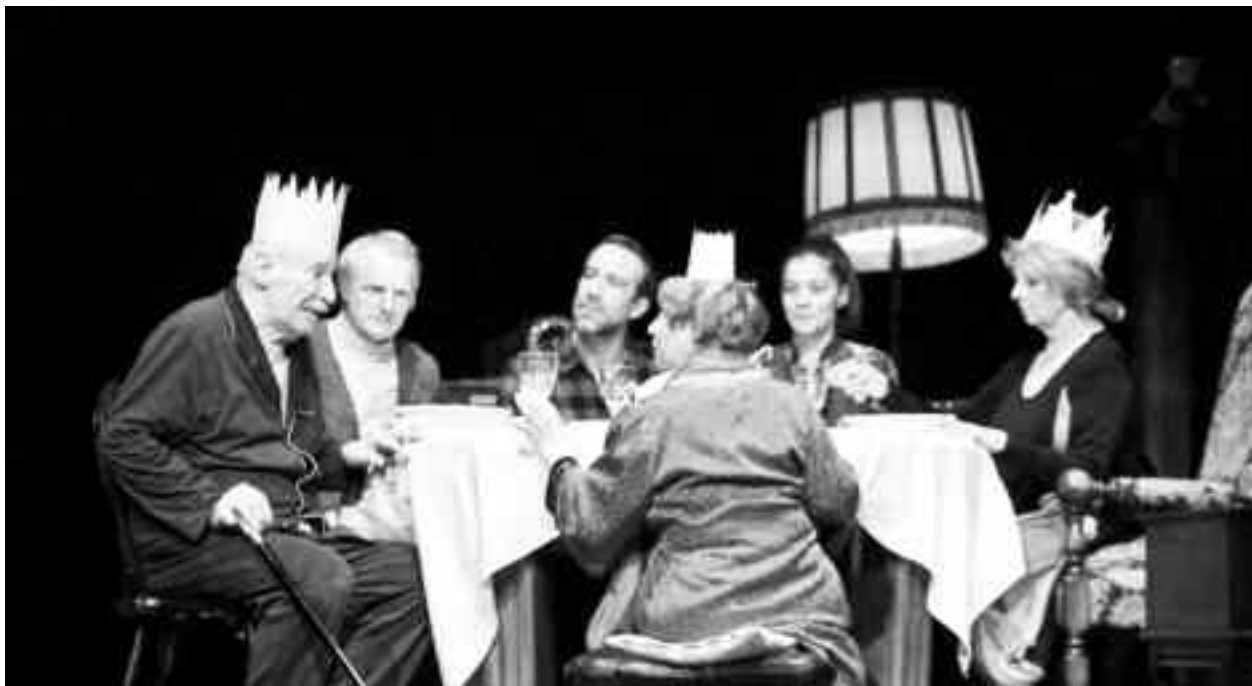
Cei șase protagoniști ai piesei lui Eugen Ionescu, în montarea regizată la TNB de Andreea și Andrei Grosu

Regatul i se prăbușește într-un ritm galopant, doctorul și astrologul curții a anunțat că a venit ceasul morții, regina tânără e disperată, regina bătrână e calmă și caustică, servitoarea nu mai prididește cu treaba, iar soldatul de gardă se transformă în ecou al evenimentelor.