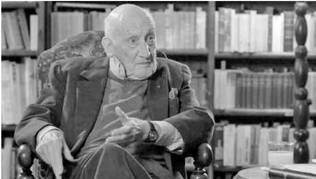
O carte cuprinzând 444 de fragmente memorabile ale lui Djuvara a fost cea mai furată din 2017 în librării

Calităților sale de scriitor i s-au adăugat și carisma indiscutabilă, plăcerea de a povesti și voioșia care l-au caracterizat până în ultimele săptămâni de viață și care l-au făcut cel mai îndrăgit dintre istoricii ajunși în conștiința publică, și asta cu toate că ideile sale au fost adesea prilej de controversă, atât în ce privește istoria trăită direct (mai ales perioada interbelică) cât și ipotezele sale referitoare la originile