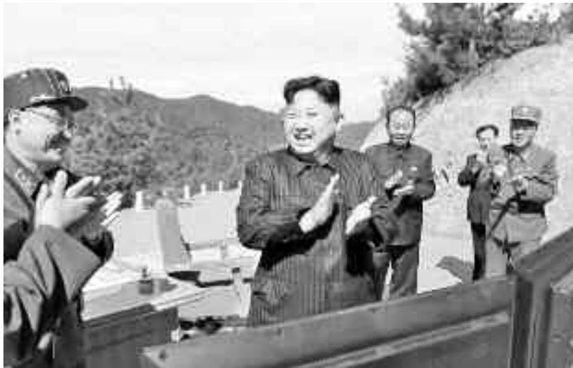
Despre Kim Jong-un se spune că a adoptat o abordare bazată pe meritocrație în ceea ce privește angajarea cercetătorilor, implicarea lor în programe militare și selectarea noilor generații de lideri științifici

Abordarea lui Gaddafi față de programul nuclear a fost în egală măsură ambivalent, discuțiile fiind marcate de controverse în sânul regimului libian pe marginea necesității și utilității dezvoltării unei astfel de infrastructuri. În anii 1990, Gaddafi a urmărit să pună la punct arsenalul nuclear, timp în care purta și discuții cu SUA în care se arăta de acord să renunțe la aceste manevre în schimbul îmbunătățirii relațiilor bilaterale. Până la urmă, acesta a abandonat programul ca parte a unei înțelegeri