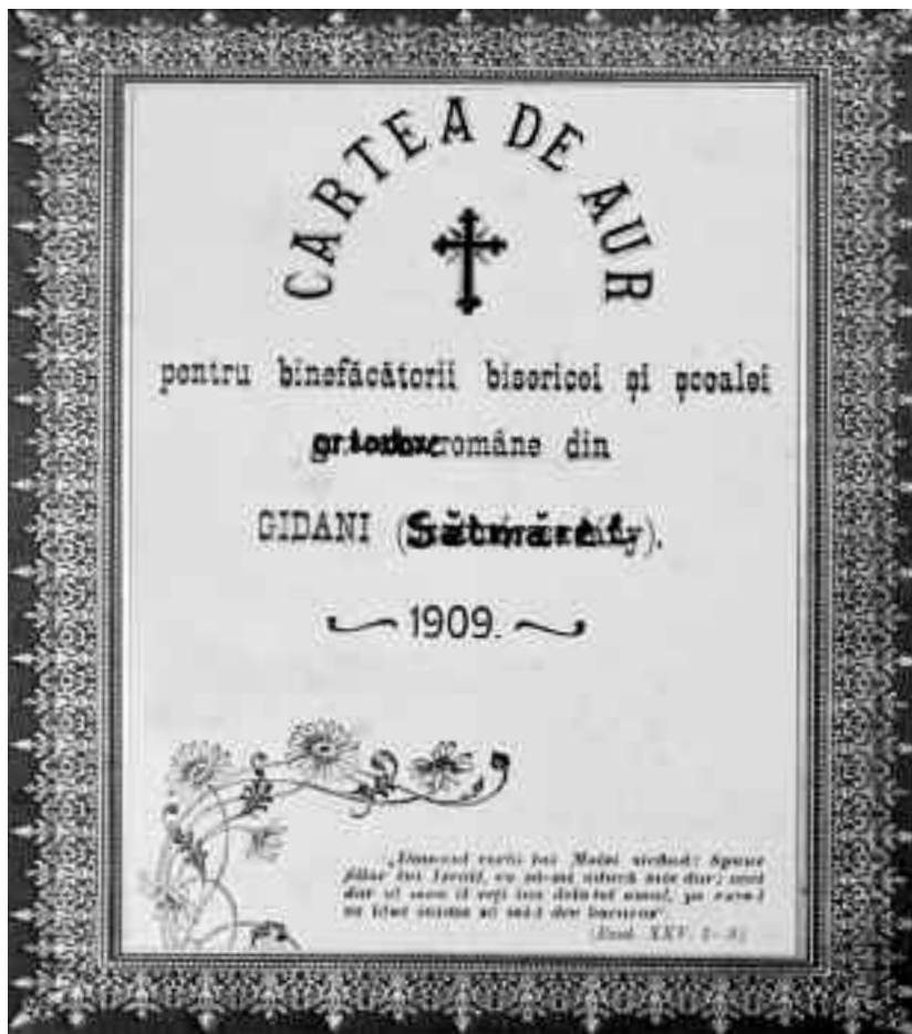
Cartea de Aur pentru binefăcătorii bisericii și școlii, tipărită în anul 1909

evului mediu în hotarul Sătmărelului de astăzi existau două localități care purtau același nume: Sătmărelul Mare (Nagy Zadan) și Sătmărelul Mic (Kis Zadan). Sătmărelul Mic era așezat după cum reiese dintr-o hotărânică din 3 august 1753 dintre orașul Satu Mare și Sătmărelul Mare, înspre orașul Satu Mare, înspre partea de sud vest.