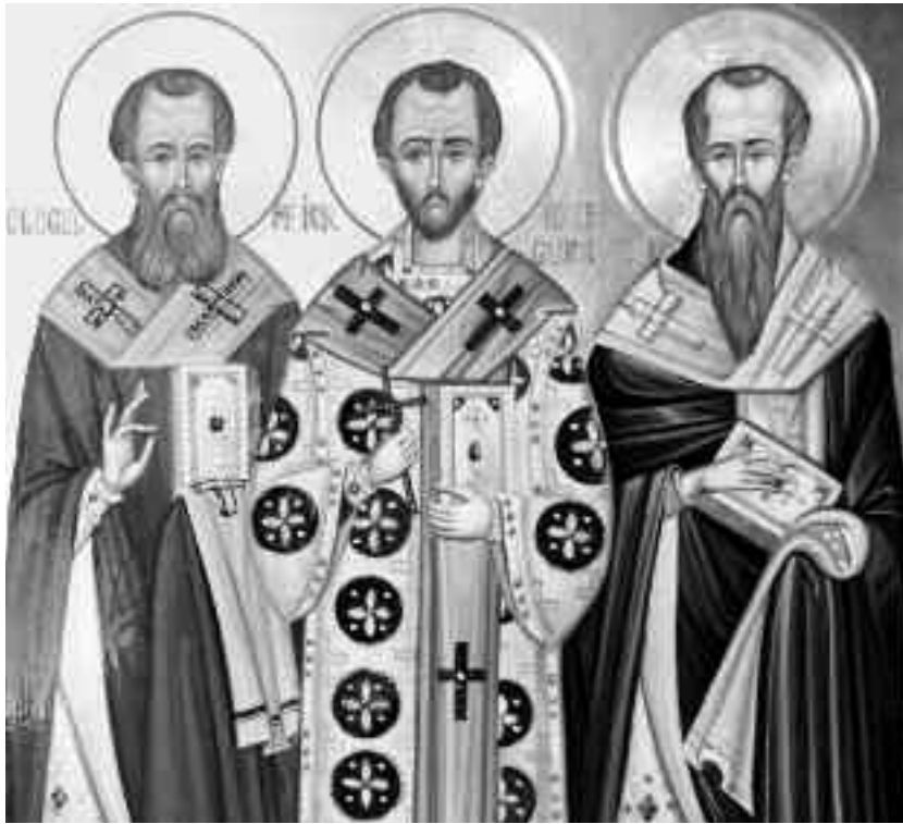
Sfinții Trei Ierarhi au lăsat Bisericii, pe lângă viața lor curată, sfântă și pilduitoare, zeci de cărți teologice, formând un inestimabil tezaur al întregii lumi creștine

În jurul anilor 355-356, Vasile s-a întors la Cezarea, a primit Taina Botezului, a intrat în monahism, împărțindu-și averea săracilor. Sfântul Vasile scrie Regulile vieții monahale mari și mici, care se păstrează până azi în mănăstirile ortodoxe.