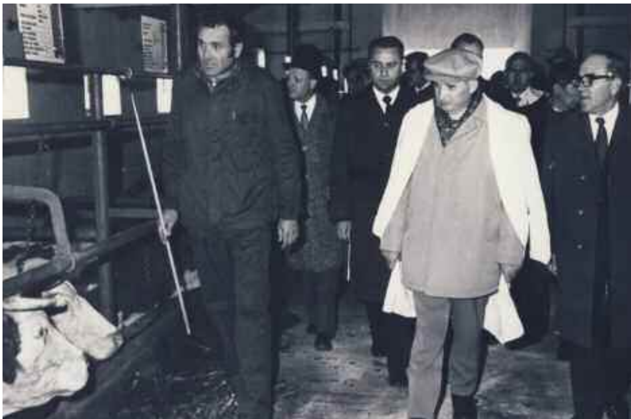
Vizită de lucru a tovarășului Nicolae Ceaușescu la CAP Petrești, 4 noiembrie 1981

Începând cu 1933 s-a apropiat de cercurile comuniste, mai întâi ca membru al tineretului comunist și apoi ca membru de partid. Făcând parte dintr-o organizație ilegală, a fost arestat de mai multe ori pentru infrațiuni contra ordinii publice, ieșind din închisoare abia în august 1944. În această perioadă și-a cultivat relațiile pe lângă liderii mișcării, în special Gheorghe Gheorghiu-Dej, fapt ce i-a adus funcția de secretar regional de partid imediat după război, atunci