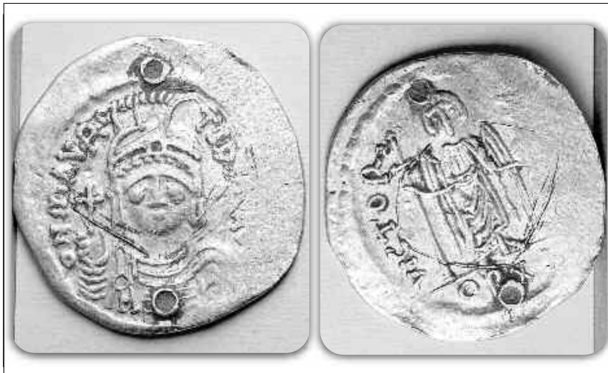
Monedă bizantină de la Dindești, avers și revers

Modernizarea drumului a atins situri în una dintre cele mai bogate regiuni arheologice din România, Valea Ierului. Din perspectivă geografică aceasta reprezintă un șanț tectonic format în urma mișcărilor de reasezare a plăcii tectonice transilvane la contact cu placa panonică. Situat pe direcție nord-est - sud-vest, acest șanț tectonic este mărginit la nord de Câmpia Careiului și la sud de Dealurile Tășnadului,