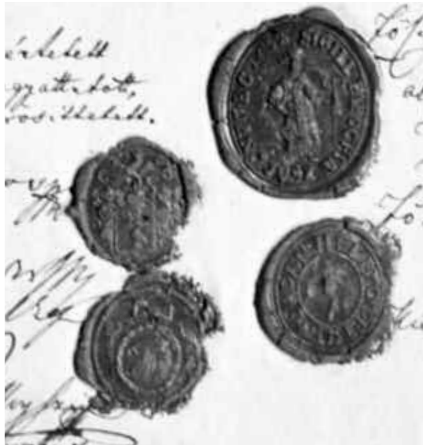
Sigiliu din 1831. Este inscripționat N/AGY/ SADAN HELYSIG PETSETE. Are reprezentat un brăzdar, deasupra un fier de plug, amândouă cu vârful în sus. Are formă ovală, 20X24 mm, fiind aplicat în ceară pe un act

În 1832, erau consemnați 657 greco-catolici, 15 romano-catolici și 4 evrei. În 1834 scade numărul populației române, 577 de greco-catolici, avem 14 romano-catolici, 7 evrei și, pentru prima dată, 2 cetățeni de confesiune calvină. După numai un an, numărul românilor crește simțitor, 704 greco-catolici, 12 romano-catolici, 6 calvini și 7 evrei, cifre repetate și de următorul șematism. În 1837 crește doar numărul locuitorilor de confesiune calvină, 16, pentru celelalte confesiuni cifrele rămânând constante: 714 greco-