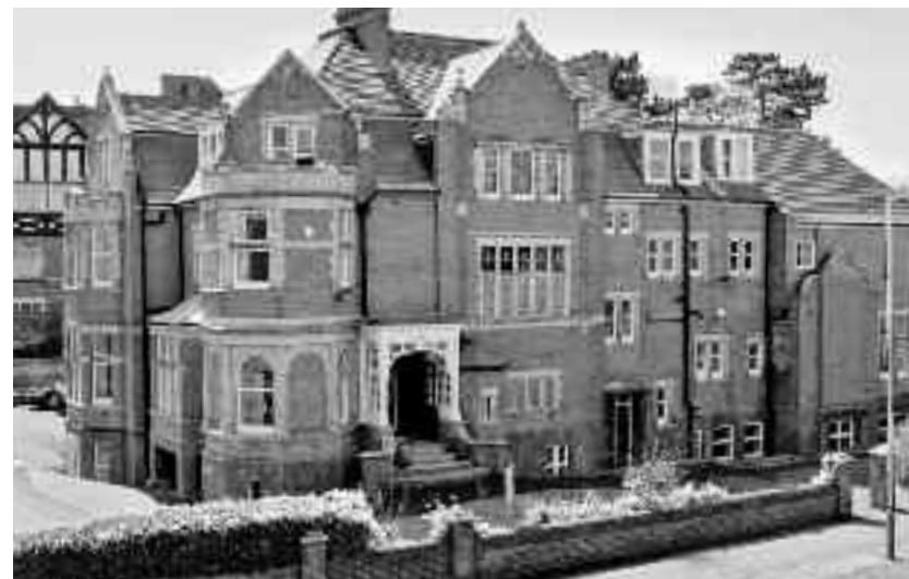
În urma edițiilor precedente ale concursului de burse, în prezent studiază la Earlscliffe College șapte elevi din România

Concursul cuprinde două etape care vor avea loc la sediul Mirunette: 1. examen scris la limba engleză și matematică (10 Martie 2018) și 2. examen oral - interviu cu Comisia de evaluare a Colegiului Earlscliffe (19-20 Martie 2018). Premiile constau în cel puțin trei