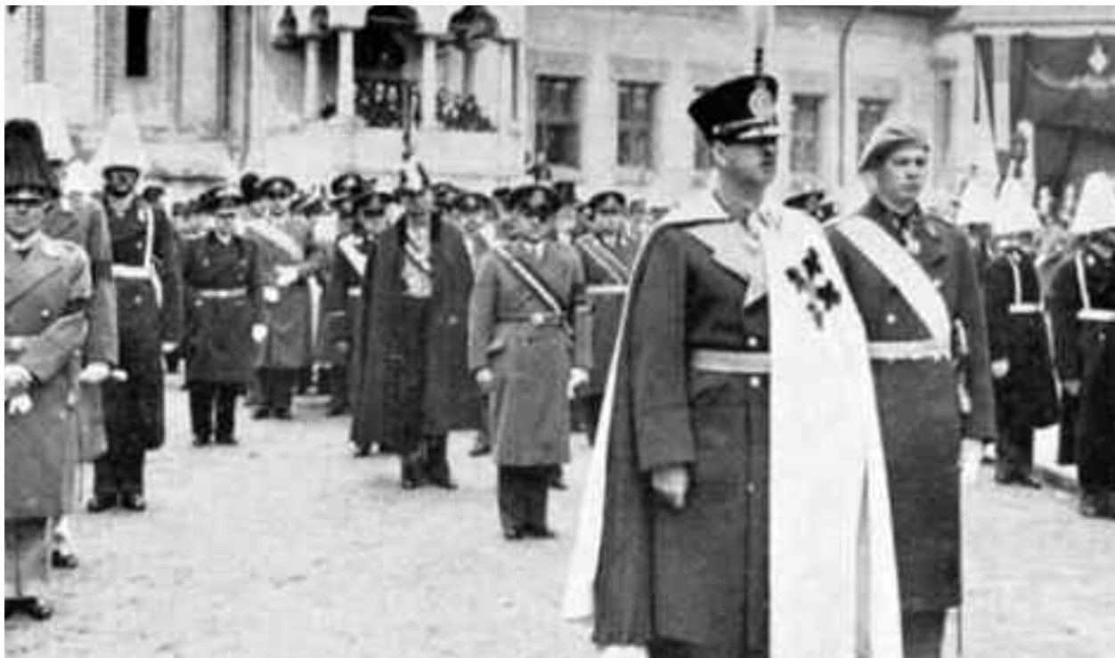
Carol al II-lea alături de viitorul rege Mihai, la o întrunire a Frontului Renașterii Naționale, singura organizație politică permisă în acea vreme

mul de partide și concentrează puterile politice în mâna regelui, care dobândește prerogative deosebit de mari. În perioada următoare, Carol și-a instaurat un veritabil regim personal autoritar: primarii și prefecții erau numiți pe scară ierarhică, s-a format "Straja Țării", din care făceau parte copii și tineri și a cărei comandant suprem era regele, presa și radioul au fost puse în slujba regimului, iar pe 16 decembrie 1938 s-a constituit Frontul Renașterii Naționale, "unica organizație politică în stat", orice activitate politică fiind considerată clandestină.