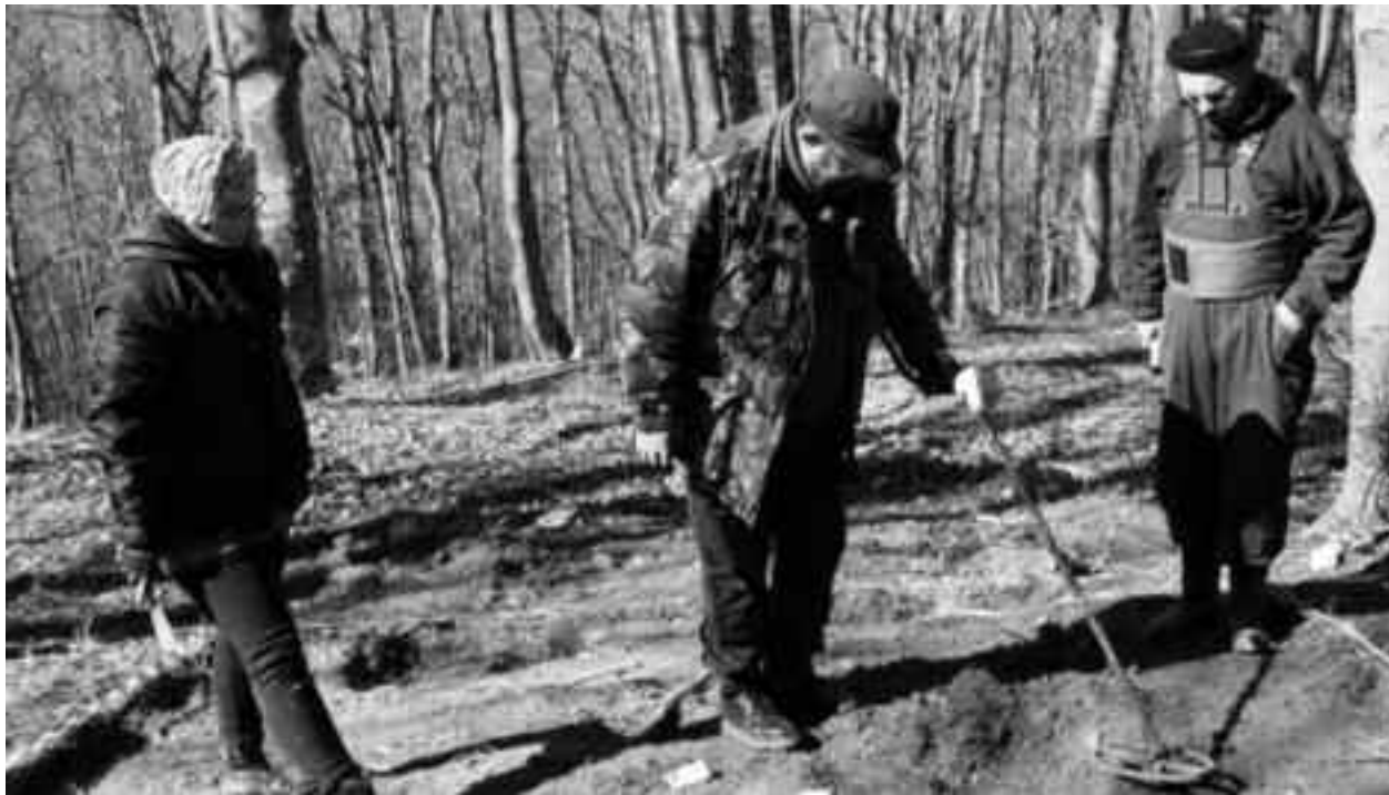
Arheologii au scos la lumină zeci de obiecte - inclusiv un vârf de suliță, un vârf de lance, un topor din fier masiv, fragmente de fibule, pinten cu încrustații de argint

Spre surprinderea arheologilor și a voluntarilor participanți la cercetarea în teren, săpăturile au scos la lumină nu unul, ci două morminte de incinerare, aparținând unor războinici daci. Elementul care justifică teoria că este vorba despre două morminte - în condițiile în care terenul care le adăpostea a fost nivelat, cel mai probabil, tot în perioada dacică - este descoperirea unei noi cataramă, fiind vorba, așadar, despre două persoane. "Când ai două paftale, ai două echipamente", explică arheologul. Cea de-a doua cataramă este mai elaborată decât prima și prezintă urmele unui placaj de bronz, semn că a aparținut unei persoane cu rang important