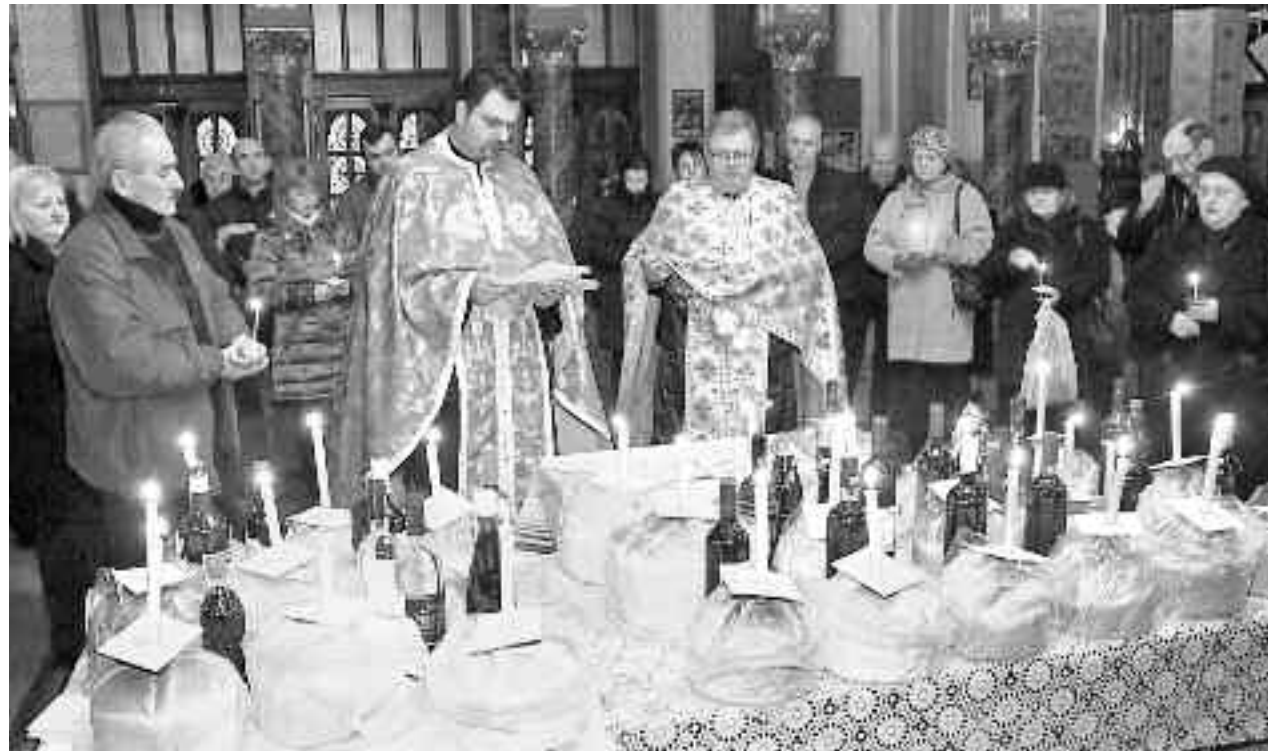
Întrucât în duminica lăsatului sec de carne Biserica ne amintește de înfricoșătoarea judecată, se face în ajun pomenirea morților, mijlocind ca și ei să se poată înfățișa cu îndrăzneală înaintea Dreptului Judecător

"Moșii de iarnă" cad, așa cum scria Simion Florea Marian (Sărbătorile la români, Ed. Fundației Culturale Române, București, 1994, pp. 199-201), în unele părți sâmbăta înainte de săptămâna albă, adică înaintea duminicii lăsatului sec de carne (a înfricoșătoarei judecăți), iar în alte regiuni ale țării, sâmbăta de dinaintea începutului Postului Mare. În această zi se dau pomeni pentru sufletele morților fiecărei familii. Aceste pomeni constau în diferite mâncăruri și băuturi, precum și din obiecte de îmbrăcăminte și încălțăminte care au aparținut oarecând celor plecați pe calea veșniciei și nu numai. Este și o dovadă de milostenie, întrucât aceste daruri se îndreaptă în special spre cei mai nevoiași și mai sărmani sau spre familiile cu mulți copii.