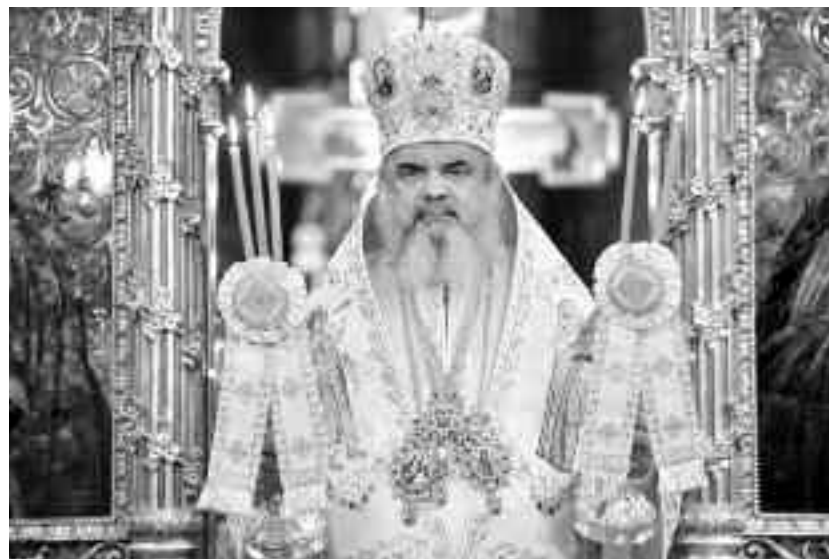
Preafericirea Sa a explicat că pilda Întoarcerii Fiului risipitor se află în strânsă legătură cu Taina Spovedaniei sau "Taina împăcării omului cu Dumnezeu" și ne prezintă "treptele ridicării duhovnicești din păcat, treptele esențiale ale pocăinței"

Un alt aspect semnalat de Conducătorul Bisericii Ortodoxe Române în omilia duminicală rostită la Paraclisul Sfântului Grigorie Luminătorul face referire la darul libertății pe care Dumnezeu l-a oferit tuturor oamenilor. Prezentându-l ca exemplu pe Fiul Risipitor, Părintele Patriarh Da-