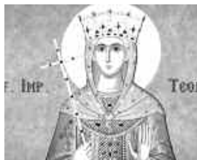
După moartea bărbatului ei, a convocat Sfântul Sinod

Teofil izgonise pe sfântul Metodiu, patriarhul Constantinopolului și în locul lui pusese pe un oarecare Ioan Lecanomatul, și arsele sfintele icoane. Dar Teodora cu toate că pe față nu cuteza să se închine sfintelor icoane, le avea totuși ascunse în camera așternutului ei, și în toate nopțile făcea rugăciuni către Dumnezeu ca să facă milă și să se îndure