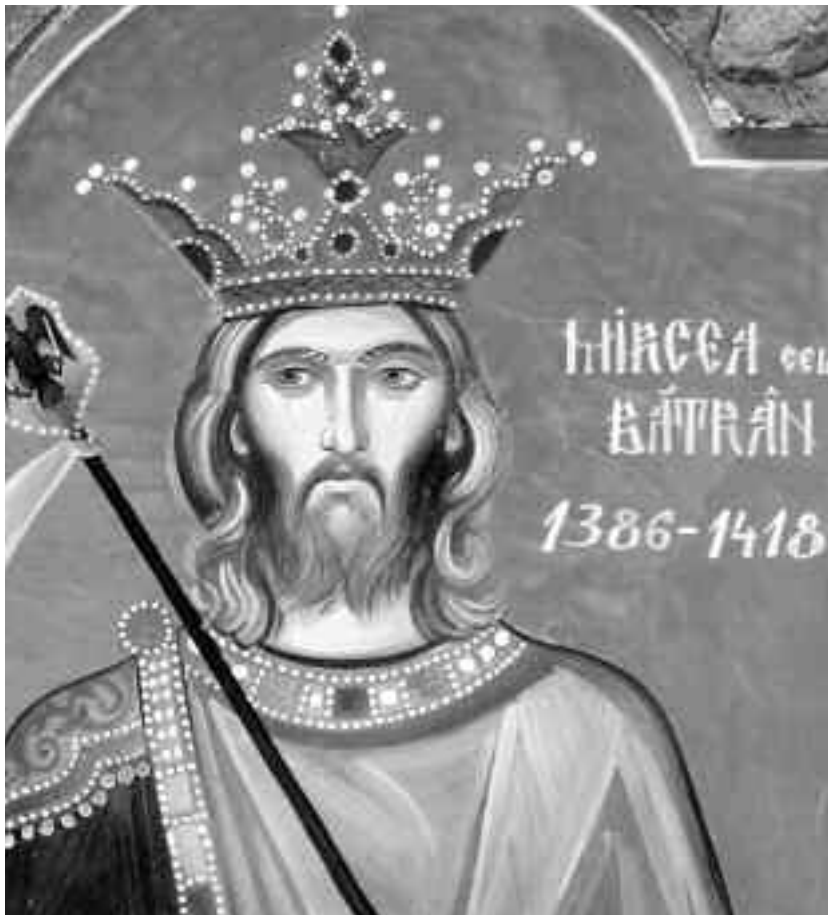
În timpul lui Mircea cel Bătrân, Țara Românească a ajuns la cea mai mare întindere teritorială

Dintre nepoții lui Mircea, fiii lui Dan I, sunt de amintit Dan al II-lea care va ajunge să și domnească, Ioan aflat în 1397 la Ragusa și probabil Vlad Uzurpatorul. Anumiți istorici îl consideră pe Vlad ca fiind fiul lui Radu, deci frate cu Mircea.