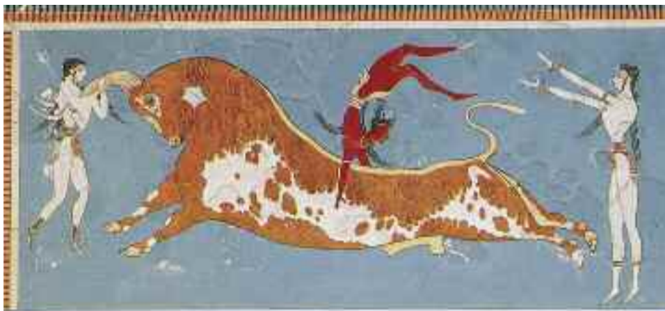
Cheie de decodificare a ornamentului de pe spade și pe coroane de aur (tiare) prin intermediul scenelor de acrobație cu taur de pe toporul de aur de la Țufalău și din arta minoică