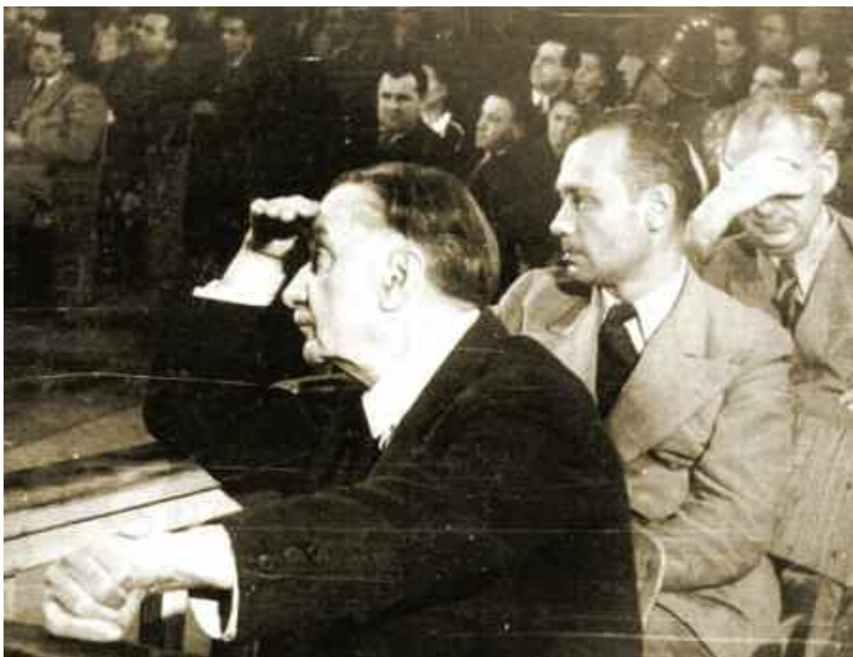
Iuliu Maniu în boxa acuzaților, în timpul procesului din anul 1947 în care este condamnat la închisoare pe viață pentru trădare

Exact zece ani mai târziu, murea la Râmnicu-Sărat partenerul său la conducerea PNT, Ion Mihalache.