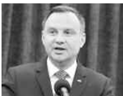
Președintele Andrzej Duda a semnat legea care interzice cumpărăturile în zilele de duminică