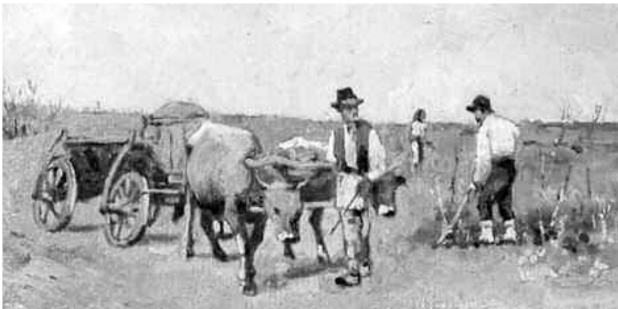
Făurar este luna când gospodarii satelor încep pregătirile pentru muncile câmpului, lucrul în livezi, gunoitul câmpului, altoitul pomilor, răsăditul semințelor și altele. Se spune că zăpada de Făurar întărește semănăturile

Ziua aceasta mai este numită și Stretenia, Filipii de iarnă, Martinii de iarnă sau Stretenia gheții. Stretenia este o zi rea, cu ceasuri rele; cine se naște în această zi