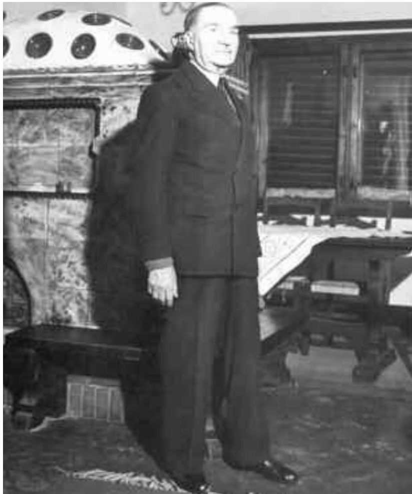
Iuliu Maniu a venit la putere, ca președinte al Consiliului de Miniștri, acum 90 de ani, în toamna anului 1928

La Adunarea Națională de la Alba Iulia susține rezoluția de unire și, la 9 august 1919, odată cu moartea lui Gh. Pop de Băsești, Iuliu Maniu este ales președinte al PNR și obține la alegerile din noiembrie 1919 169 de mandate, întrecând toate celelalte partide. Solicitat de rege pentru formarea noului guvern, Maniu refuză, motivând că nu