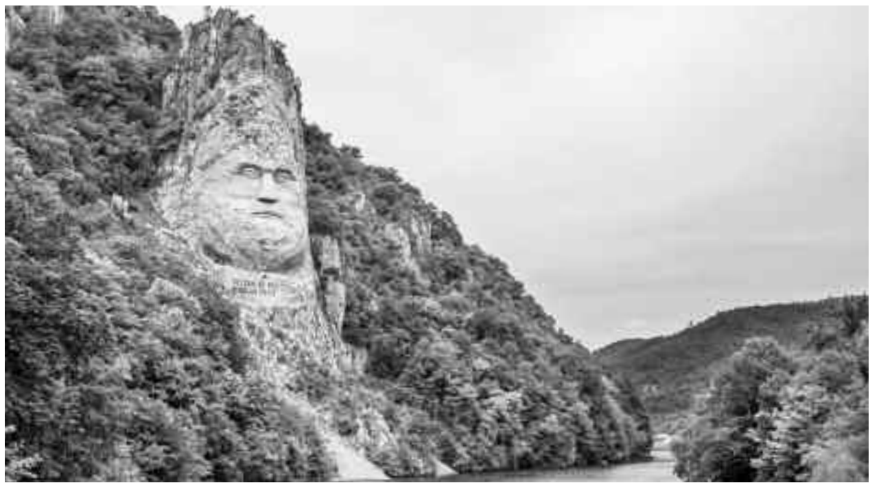
Chipul lui Decebal a fost sculptat în zona Cazanelor Mici, pe malul stâng al Dunării, în golful Mraconia. Este cea mai mare sculptură în stâncă din Europa

Regiunea a constituit o parte unitară, componentă a Regatului Ungariei, apoi din secolul al XVI-lea din Imperiul Otoman, după care a fost înglobat spre sfârșitul secolului al XVII-lea în Arhiducatul Austriei, devenit apoi Imperiul Austriac. După 1867, a făcut parte din partea ungară a Imperiului Austro-Ungar, iar în urma Primului Război Mondial, Banatul a fost împărțit pe linii etnice între cele trei state naționale ale căror etnii locuiau în zonă: Iugoslavia, România și Ungaria-Voivodina. (Ibidem)