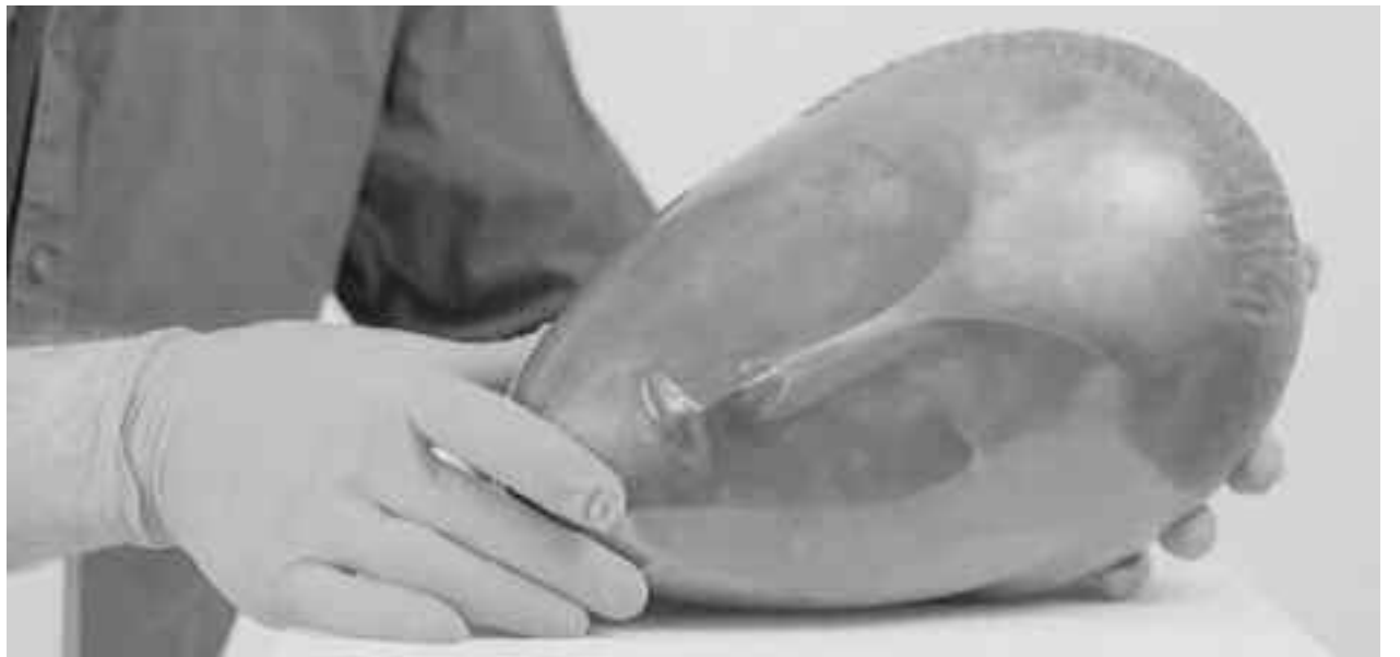
"La muse endormie", de Constantin Brâncuși, un bronz superb aurit a spulberat previziunile, stabilind un nou record mondial al artistului la 57,36 de milioane de dolari, după o luptă între ofertanți de 10 minute

Pe 18 mai 2017, colecționarul japonez Yusaku Maezawa a stat la originea unui veritabil tur de forță pentru o operă de Jean-Michel Basquiat, care a depășit pentru prima dată pragul de 100 de milioane de dolari la o licitație: "Untitled" (1982) a fost adjudecată pentru 110,5 milioane de dolari la Sotheby's din New York. Această pânză a fost cumpărată cu 19.000 de dolari în 1984 și a fost revândută de 5.800 de ori, iar 33 de ani mai târziu a stabilit un record pentru tânărul artist provenit din Bronx. Basquiat a intrat astfel în cercul restrâns al artiștilor vânduți cu mai mult de 100 de milioane la casele de licitație.