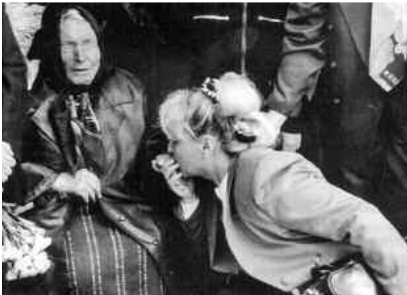
Baba Vanga este cea mai cunoscută prezicătoare din estul Europei, cele mai multe vorbe ale ei adevărându-se de-a lungul timpului

De asemenea, Baba Vanga a făcut predicții până în secolul 51, când a spus că lumea va pieri, potrivit The Mirror. * În 2023 se va schimba ușor Orbita Pământului; * În 2025 Europa va fi pustie; * În 2028 se va dezvolta o nouă sursă de energie, iar foamea nu va mai fi o problemă; * În 2046 clonarea va fi foarte accesibilă; * În 2076 lumea va fi condusă din nou de comuniști; * În 2084 va avea loc renașterea naturii; * În 2088 o nouă boală va lovi planeta; Oamenii vor îmbătrâni în câteva secunde; * În 2097 boala va fi vindecată; * În 2100 soarele făcut de mâna omului va lumina partea întunecată a Planetei; * În 2111 oamenii vor deveni roboți;