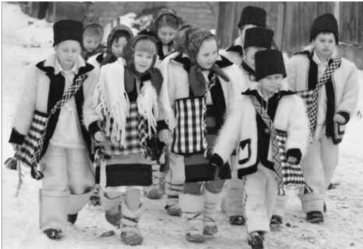
Copiii cei mici, cu trăistuțe atârinate de gât și clopoței în mâini, cutreieră satul, marcând, prin versurile lor cântate pe la casele gospodarilor, trecerea de la sărbătorile Crăciunului la cele ale Anului Nou

Plugușorul este una dintre cele mai frumoase și mai vechi datini românești din seara Anului Nou, menținută și în județul Satu Mare. Cete de băieți și fete, care de abia așteptară sosirea acestei seri, încep a umbla pe la case, cântând, urând, pocnind din bice și strigând de răsună satul. La fiecare casă e lumina aprinsă. Gospodarii cred că, dacă nu-i vor primi în casă pe acești urători, nu le va merge deloc bine în noul an. Înarmați cu buhai, bice, tobe, harapnice, clopoței, uneori chiar și un plug în miniatură și traiste pentru încasarea câștigului, tinerii încep a cânta, a pocni din bice și a ura din casă în casă: “Mâne anul se-noiește, Plugușorul se pornește Și începe-a colinda Pe la case a ura Mânați măi!... Plugușor cu șase boi Înjugați tot câte doi Plugușor frumos gătit S-aduci anul fericit Mânați măi!... Anul nou cel care vine Să vă dea tot ce doriți, Sănătate, numai bine Să fiți mereu fericiți.