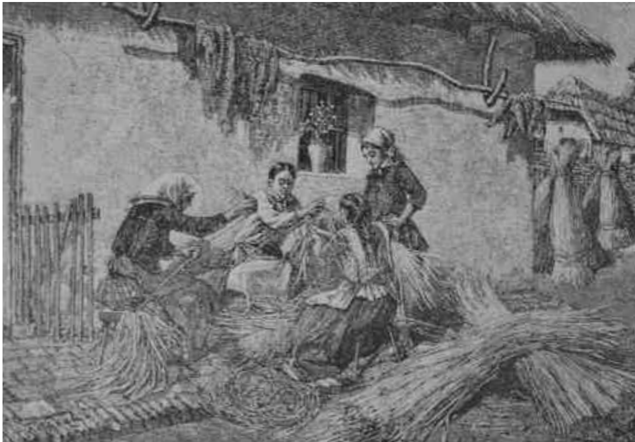
Imagine din Mlaștina Ecedea, desen din anul 1800

Pentru a înțelege amploarea dezastrului suferit de românii sătmăreni în anul 1817 vom prezenta situația lor ținând seama că înainte de 1918 co-