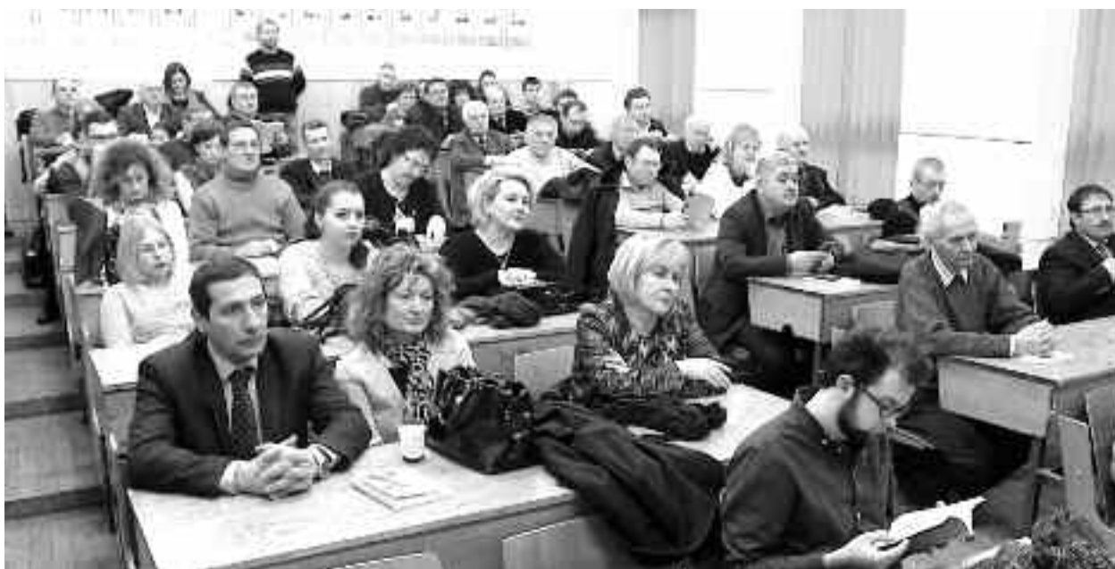
Lansarea celui de al 13-lea "caiet eminescian" a avut loc pe 21 decembrie 2017, în sala amfiteatru a Colegiului

Din textul lucrării răzbate sentimentul de mândrie al celor ce aparțin într-un fel sau altul, elevi sau profesori, comunității acestui liceu, actualmente Colegiul Național Mihail Eminescu din Satu Mare. Acest aspect nu a trecut neremarcat nici de prefătorul cărții, Lucian Turcu. El scrie că autorii și-au asumat "o forma mentalis generatoare de identitate culturală: aceea de a fi eminescian și de a fi mândru de acest fapt!". Cu atât mai mult reiese acest lucru din urările autorilor, scrise în prefață, adresate mării familii,