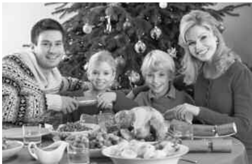
Tradițiile culinare specifice românilor, cu alimente încărcate de grăsimi, proteine animale, îndelung prelucrate termic, bogăția de calorii, afectează până și un organism sănătos

O cauză a balonării este alimentația excesivă, atunci când se consumă porții