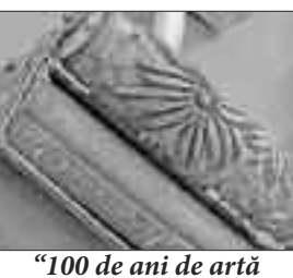
"100 de ani de artă și meșteșuguri la Satu Mare" - 18.30