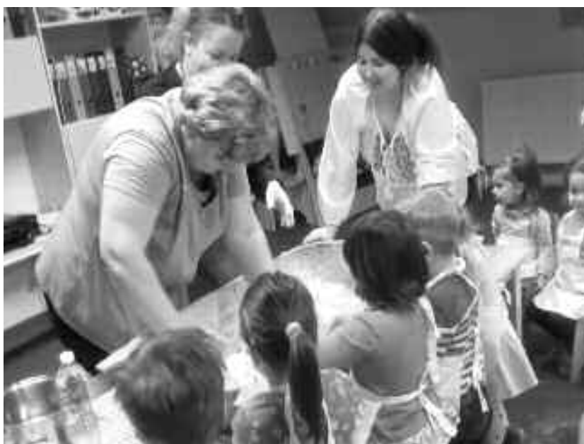
Copiii de grădiniță au văzut cum se prepară pâinea pe vatră

Și pentru că tradițiile trebuie transmise următoarelor generații, elevii clasei a X-a A din cadrul Colegiului Economic „Gheorghe Dragoș” Satu Mare și-au propus să le ofere celor mici, grupa mică „Bună dimineața” de la Grădinița cu Program Prelungit „Dumbrava Minunată” Satu Mare, o lecție de gastronomie: prepararea unor „cocuți” pe vatră. Micuții bucătari au fost entuziasmați de întregul proces tehnologic, descoperind gusturi și texturi interesante, asistând nerăbdători la toate etapele de pregătire: frământare, dospire, coacere, amba-