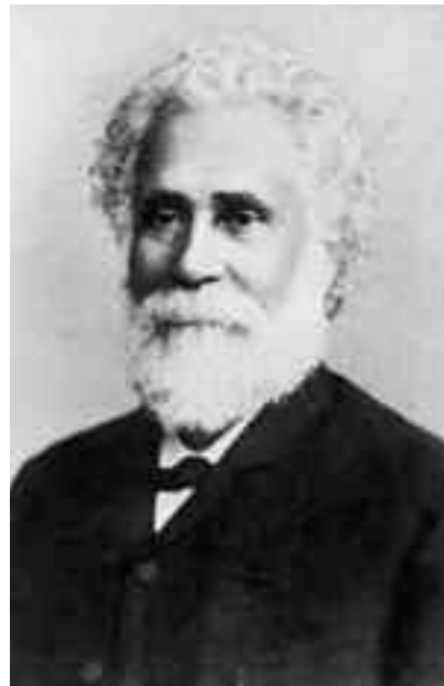
Ion C. Brătianu (1821-1891)

18. Guvernul Emanoil Costache Epureanu (2) PNL : 27 aprilie 1876 - 23 iulie 1876 . După alegeri, noua Cameră dominată de liberali trimite în judecată 11 miniștri din fostul guvern conservator sub acuzațiile de încălcare a Constituției și abuz în serviciu.