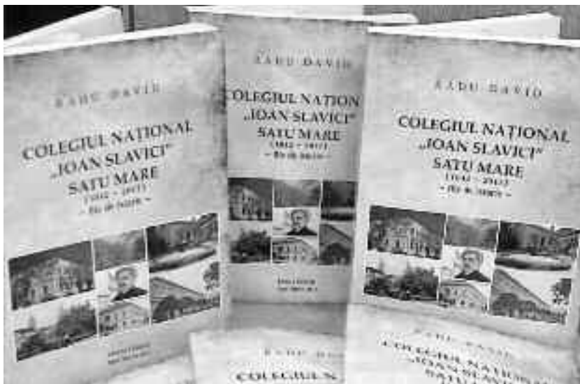
Volumul a apărut sub egida Editurii Citadela Satu Mare, are 420 de pagini format mare, numeroase ilustrații