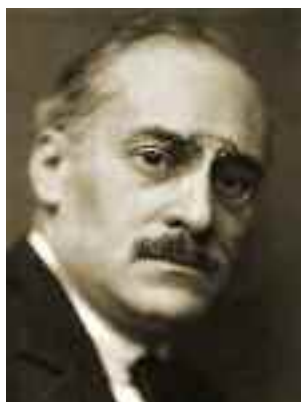
Ion Gheorghe Duca