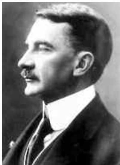
Iuliu Maniu (1873 - 1953)

74. Guvernul Miron Cristea (3), Uniune Națională: 1 februarie 1939 - 6 martie 1939. Regele Carol al II-lea instaurează regimul monarhiei autoritare. Se înființează Frontului Renașterii Naționale (FRN)