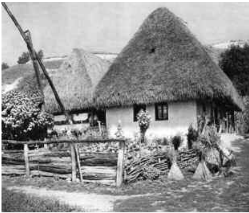
Superstițiile Filipilor de iarnă sunt numeroase, și de regulă, creștinii de la sate le respectă cu sfințenie. Gospodinele trebuie să spele rufele doar cu apă clocotită, pentru că doar așa vor opări gura lupului

Conform tradiției populare, Filipii de iarnă încep la data de 29 ianuarie și țin trei