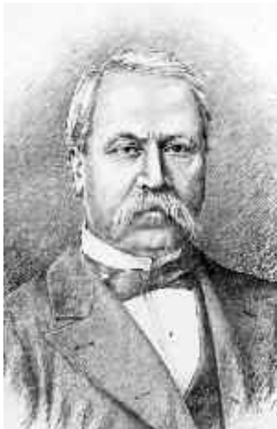
Lascăr Catargiu (1823 - 1899)

11. Guvernul Nicolae Golescu, radicali : 1 mai 1868 - 16 noiembrie 1868 . Este adoptată Legea privind organizarea puterii armate din 1868. Franța intensi-