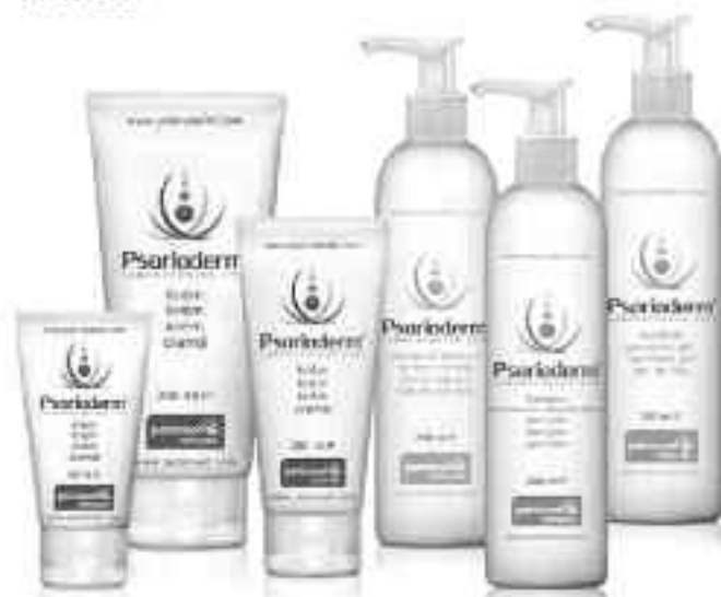
Gama Psorioderm® Cremă • Balsam de corp • Șampon • Gel de dus

Psorioderm® ZILNIC DIN CAP PÂNĂ ÎN PICIOARE