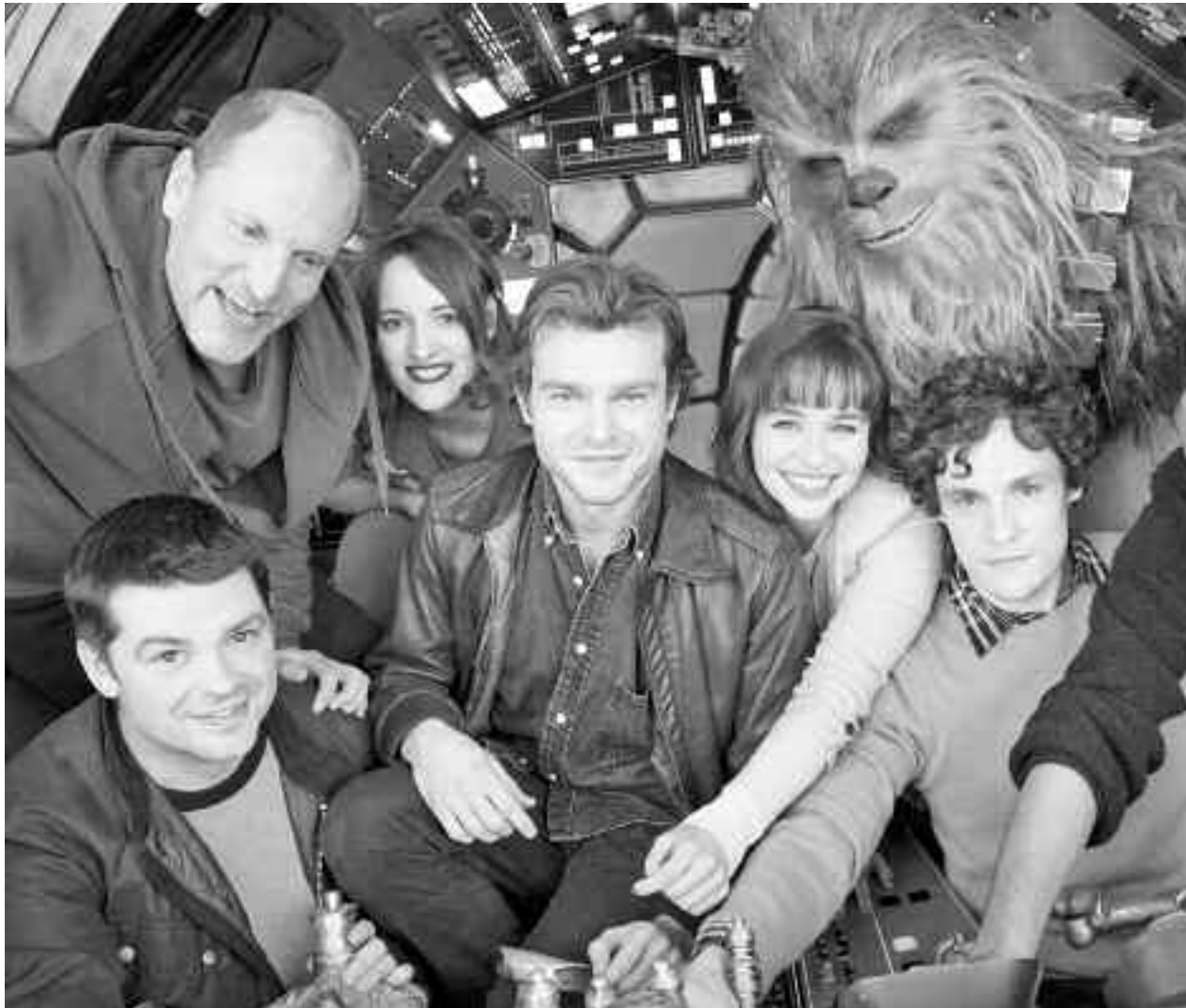
În luna mai va avea loc premiera peliculei "Han Solo", care spune povestea personajului cu acest nume, de când era tânăr. În trilogia originală, Han Solo a fost interpretat de Harrison Ford, iar în 2018 îi va da viață actorul Alden Ehrenreich

Actrițele nominalizate pentru cel mai bun rol într-o dramă sunt: Jessica Chastain ("Molly's Game"), Sally Hawkins ("The Shape of Water"), Frances McDormand ("Three Billboards Outside Ebbing, Missouri"), Meryl Streep ("The Post") și Michelle Williams ("All the money in the world"). În ceea ce privește actorii, pentru cel mai bun rol într-o dramă, au fost nominalizați Timothée Chalamet ("Call me by your name"), Daniel Day-Lewis ("Phantom Thread"), Tom Hanks ("The Post"), Gary Oldman ("Darkest Hour") și Denzel Washington ("Roman J. Israel, Esq.").