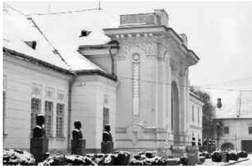
Clădirea în care a fost proclamată Unirea Transilvaniei cu România nu va fi închisă deocamdată pentru public

Construită în 1900, a servit drept cantină militară, locul de festivități și recepții al armatei austro-ungare. La 1 decembrie 1918 a fost aleasă ca loc de desfășurare a lucrărilor Marii Adunări Naționale pentru că era cea mai spațioasă clădire din oraș, singura ce putea să adune sub acoperișul său pe cei 1228 de delegați ai națiunii române. Câțiva ani mai târziu, cu prilejul încoronării, a fost amplu înfrumusețată și i s-au adăugat bolta și un portal monumental în dreptul intrării, în forma unui