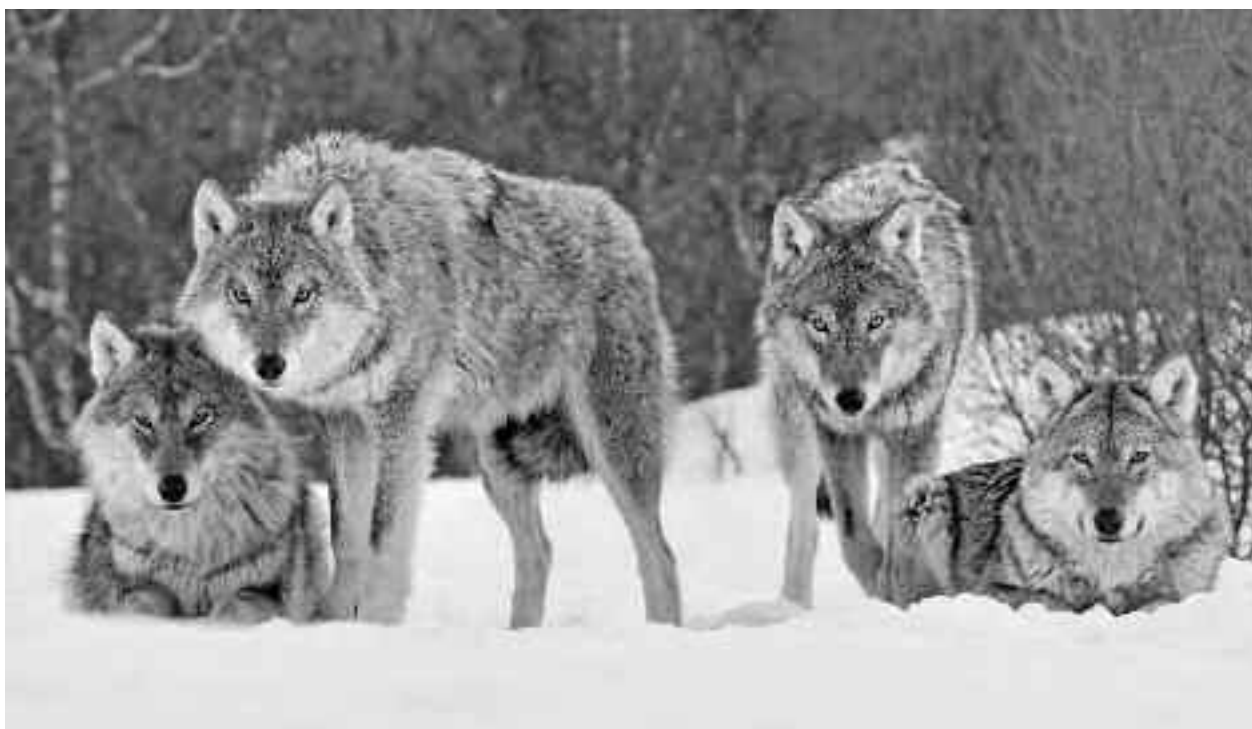
Se zice că în noaptea de 16 ianuarie, Sfântul Petru sosește pe un cal alb și împarte fiecărui lup câte o oaie, un miel sau o căprioară, lupii neavând voie să se atingă decât de prada primită