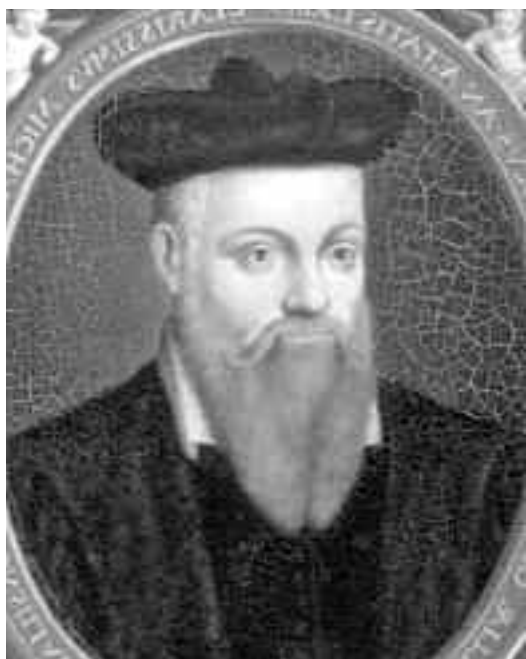
Conform catrenelor lui Nostradamus, în 2018, unele țări europene se vor confrunta cu inundații de o amploare impresionantă

Continentul american se va confrunta, la rândul său, cu probleme economice. Acest lucru îl va determina pe președintele SUA să renunțe la unele dintre planurile și intențiile sale. Mai