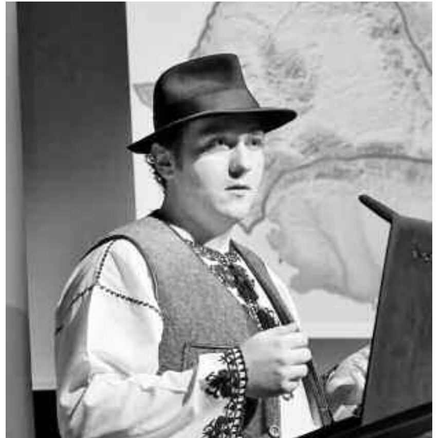
Scrierile lui Răzvan Roșu, atât volumul recent lansat, cât și cercetările de teren întreprinse în România, Ungaria, Serbia, Grecia răspund nevoii de documentare a celor care doresc să cunoască istoria, obiceiurile, limba și tradițiile din zonele studiate

În urma lecturii întregului volum, se constată ușor că titlul nu are decât parțial acoperire în realitate: "Transilvania", la care