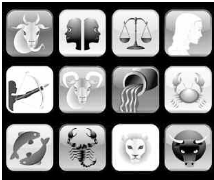
Numeroasele fenomene astronomice și modificări ale hărții astrale vor dinamiza întregul zodiac, dar cele mai multe evenimente vor fi de bun augur

LEU. În cazul Leilor sfera sentimentală se eliberează de tensiuni, fiind gata din nou să-și ia angajamente serioase. În prima jumătate a anului sănătatea este vulnerabilă. Ai toate șansele să iei decizii majore care te vor duce pe noi direcții de viață, iar unele dintre ele vor fi chiar pentru toată viața. În jumătatea de mijloc al anului va fi activat segmentul socio-profesional, în acest plan vei pune bazele evoluției tale pentru mulți ani de acum înainte. Vei putea demara proiecte pro-