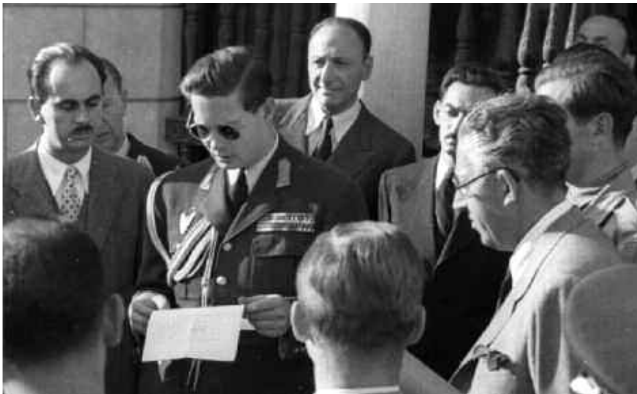
Regele Mihai citește Proclamația către țară în 23 august 1944

După căderea regimului comunist din decembrie 1989, Regele Mihai a avut o primă încercare de a reveni în țară în decembrie 1990. De Crăciun, el a sosit în România cu dorința de a merge la Curtea de Argeș, pentru a vizita mormintele rudelor sale. La aeroport i s-a acordat viza de intrare în țară, apoi regele a fost oprit de poliție în drum spre Curtea de Argeș și forțat să se întorcă la Otopeni și să părăsească România.