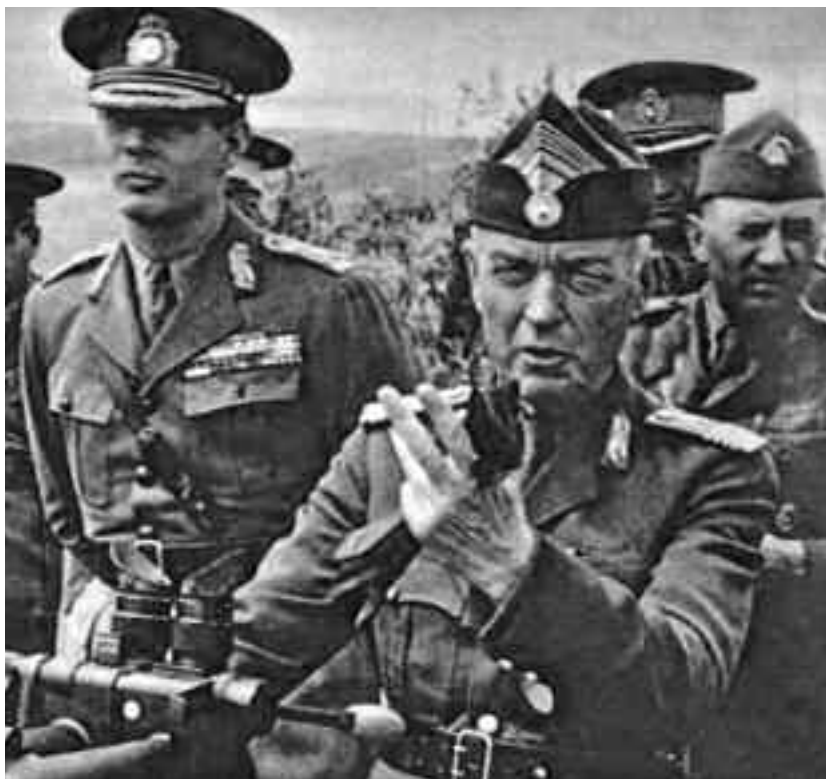
Regele Mihai alături de Ion Antonescu pe malul Prutului în anul 1940