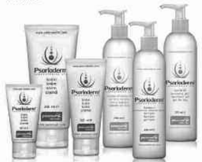
Gama Psorioderm® Cremă • Balsam de corp • Șampon • Gel de dus

Psorioderm® ZILNIC DIN CAP PÂNĂ ÎN PICIOARE