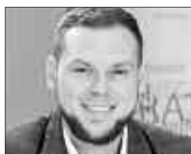
Sergiu Podină, "Audiențe în direct" - 18.30

6.30 Gimnastica de dimineață cu Ioana Zaharia 7.00 Știri 7.30 Gimnastica de dimineață 18.30 "Audiențe în direct" cu Sergiu Podină 19.30 Știri cu Valerica Șiket 20.00 "Agenda Publică" - realizator Stela Cădar 21.30 Sănătate cu Mihaela Ghiță