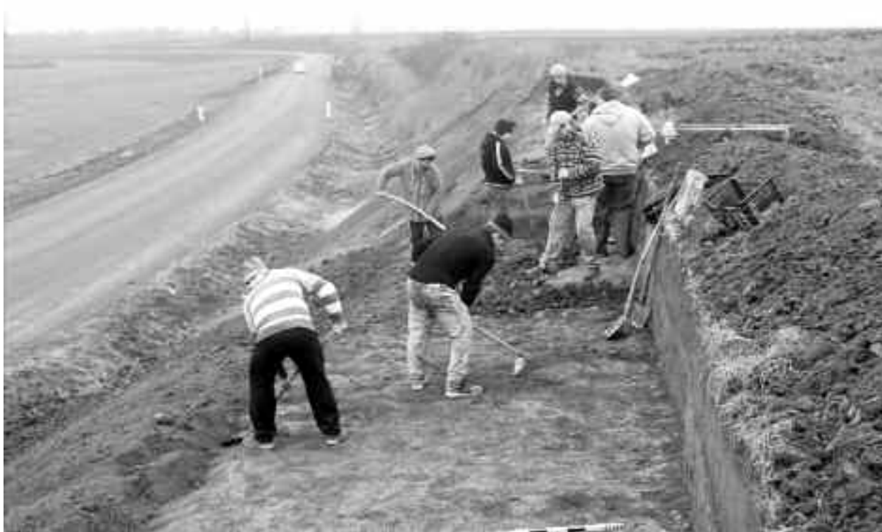
Regiunea Văii Ierului și zonele sale limitrofe uimesc prin bogăția vestigiilor arheologice, care abundă cantitativ, dar mai ales uimește prin nivelul special pe care îl ating unele localități străvechi și unele obiecte, ce reprezintă capodopere cunoscute la scară continentală

Faptul că Valea Ierului a suferit la începutul Evului Mediu o schimbare de statut politic din centru în periferie sugerează că principala sa bogăție nu a constatat în resurse agricole, care au rămas excepționale până în prezent. Cercetările din ultimii ani au surprins modul în care Valea Ierului a dobândit rolul de centru de putere, care are la bază orientarea sa geografică, pe direcție nord-sud. Prin această orientare ea bazează circulația între est și vest, o direcție importantă de circulație între resurse din ecosisteme diferite, de munte și de câmpie. Supra-