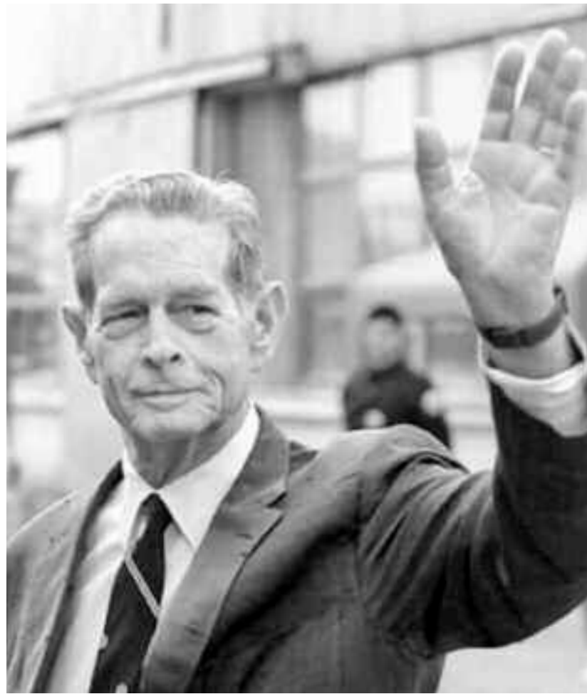
În 1944, Regelui Mihai i s-au acordat Legiunea de Merit de către președintele american Harry S. Truman și Ordinul Victoriei de către Stalin

Izolată la Palat de mareașalul Antonescu, Regele Mihai devine și mai singur.