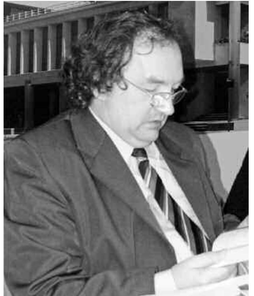
“Actul de creație se reduce la timpul liber. Drept consecință, trebuie să fiu cât mai eficient. Nu îmi permit să mă risipesc în activități mărunte, lipsite de semnificație”

- Impactul unei cărți asupra cititorilor este destul de greu de măsurat. Cu toate acestea, premiile literare pe care le-am pri-