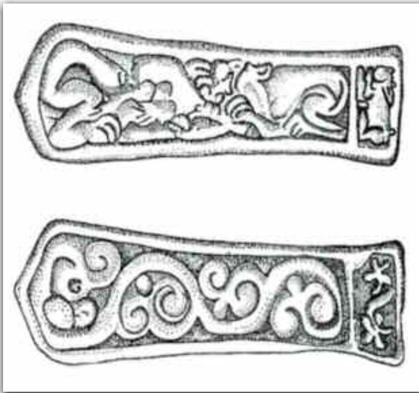
Așezarea de la Lazuri-Lubi tag (a doua jumătate a sec. VI – prima treime a sec. VII). Vase de lut (lucrate cu mâna) specifice mediului slav timpuriu (cultura Praga sau Praga-Korček) (1-10). „Pâinișoare” din lut ars, cu semne cruciforme, incizate în pasta crudă (11-13) (după Stanciu 2011)

După densitatea și mai ales calitatea vestigiilor, s-ar putea crede, așa cum s-a