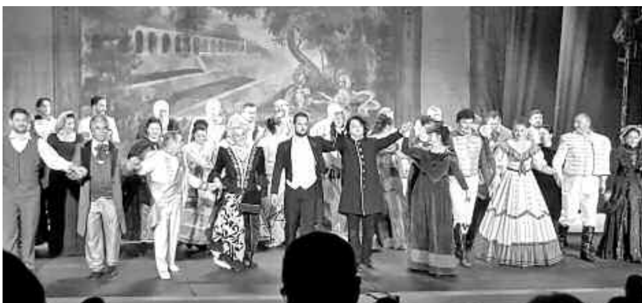
Trupa Teatrului Național de Operă și Balet “Maria Bieșu” din Chișinău a fost aplaudată la scenă deschisă la Craiova

De aceea prezența în Festivalul Internațional “Elena Teodorini” de la Craiova a Teatrului Național de Operă și Balet “Maria Bieșu” din Chișinău cu “Dama de pică” a stârnit un mare interes nu doar printre localnici, ci și printre iubitorii de operă cunoscători din țară. Sosirea