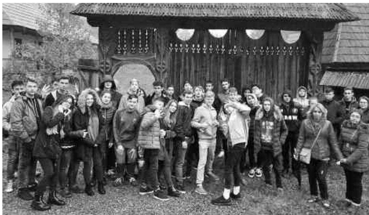
Elevii au vizitat mai multe obiective turistice din Maramureșul istoric printre care și Muzeul Satului

Ajunși în Sighetu Marmăției, elevii au pășit timid în vechea închisoare, azi Muzeul Victimelor Comunismului, și-au luat pliante de prezentare oferite și au ascultat materialul audio. Trecând din celulă în celulă, ei au fost profund marcați de modul brutal în care a acționat Securitatea la colectivizare și au lăcrimat în celula lui Iuliu Maniu, când au aflat la ce umilțe a fost supus marele