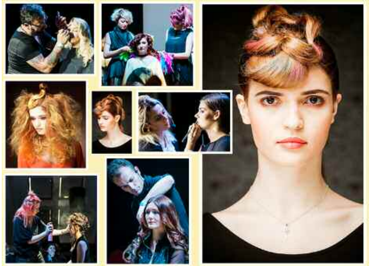
Peste 40 de maeștri, 60 de modele vor urca pe scenă în aceste zile dedicate frumuseții

În paralel vor avea loc seminarii coafură. Dancso Erika aduce coafuri de ocazie din Ungaria, apoi pe scenă urcă Davines. Nashi Argan vin cu vopsea tratament.