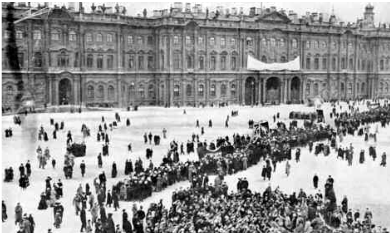
Gărzile Roșii conduse de bolșevici au preluat, fără rezistență, controlul asupra podurilor, gărilor, băncii centrale, centralelor poștale și telefonice, înainte de a lansa un atac final asupra Palatului de Iarnă

răspândit în întregul Petrograd și tensiunea a crescut. Sloganurile, până atunci mai degrabă discrete, s-au politizat: "Jos războiul!", "Jos autocrația!" De această dată, ciocnirile cu poliția au făcut victime de ambele părți. După trei zile de demonstrații, țarul a mobilizat trupele din garnizoana orașului pentru a suprima revolta. Soldații au rezistat la primele încercări de fraternizare și au ucis mulți demonstrații. Cu toate acestea, noaptea, o parte a trupelor s-a alăturat treptat taberei insurgenților. Toate regimentele din garnizoana Petrograd s-au alăturat rebelilor. Revoluția a triumfat.