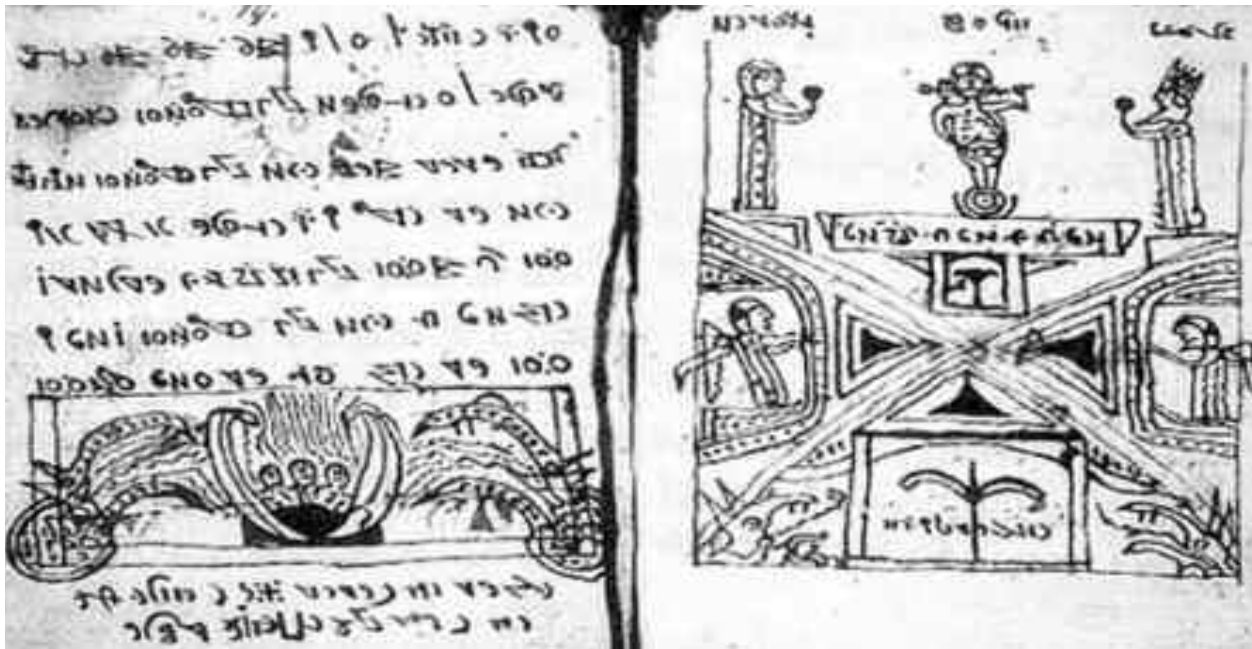
Codexul are 448 de pagini, fiecare cu circa 9-14 șiruri. În text sunt intercalate miniaturi cu scene laice și religioase