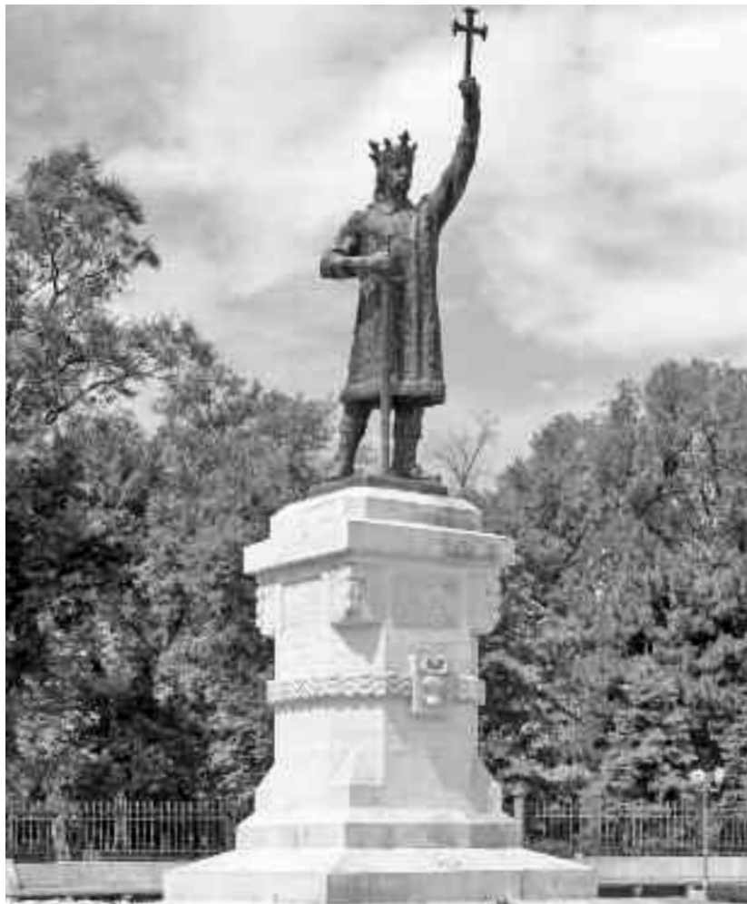
Statuia lui Ștefan cel Mare din Chișinău

Guvernul țarist a dat articolului 2 al Convenției din 16 aprilie o interpretare în slujba propriilor sale interese: "Convenția fiind încheiată în vederea războiului cu Turcia, război al cărui teatru putea deveni România, Rusia s-a angajat prin articolul Convenției, să apere și să garanteze drepturile României și integritatea teritoriului său numai împotriva Turciei. Această stipulație nu se referă la Rusia, căci Convenția nu este un act prin care ea se angaja față de România sau