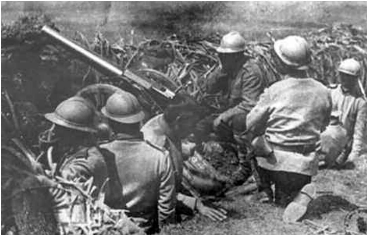
Armata a II-a română de sub conducerea generalului Averescu dobândise deci o victorie decisivă, care în tactică înseamnă aruncarea inamicului înapoi, zdrobirea lui prin desorganizarea unităților sale, făcându-i prizonieri și panicându-l

Această întorsătură, pentru Armata mea, este aproape indiferentă, căci cu forțele de care dispun desigur că nu aș fi putut merge mult mai departe de linia Putnei, pe care vreau să ajung. Pentru Armata I-a sunt convins că este o fericire. Mergea cu siguranță la o înfrângere, din cele mai dureroase.