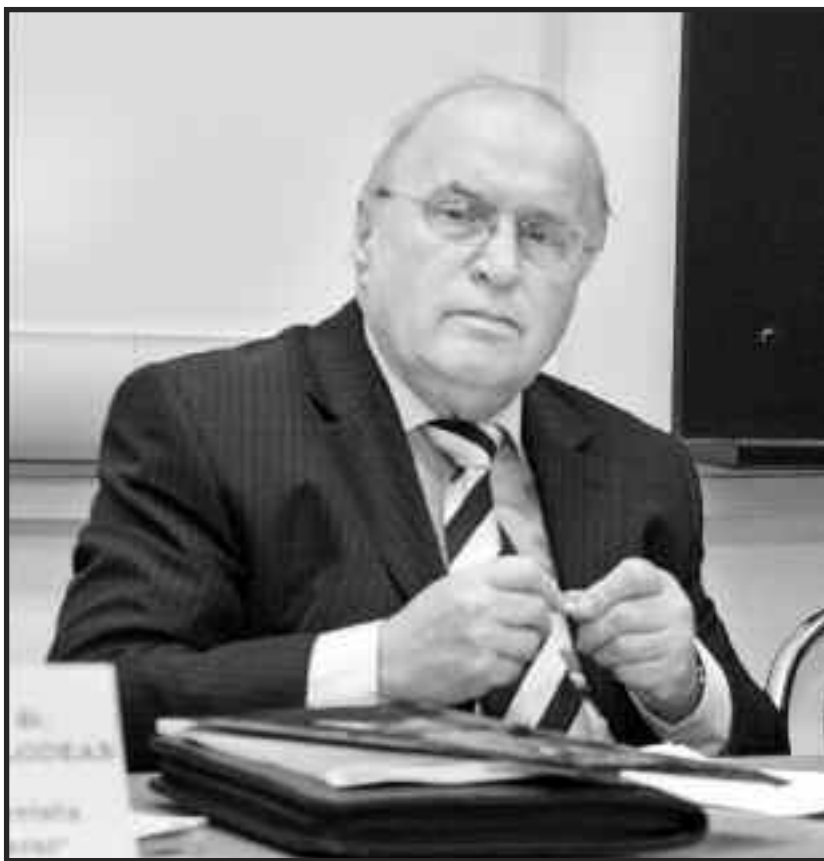
După Augustin Buzura rămâne o operă literară și publicistică a cărei substanță va înfrunta timpul prin autenticitatea imaginilor și prin adâncimea cugetului unui prozator român de prim ordin

deosebire după evenimentele din decembrie, literatura lui Augustin Buzura a provocat o adevărată “încercare a criticii”, așa cum am intitulat și intervenția în fața prozatorului și a numerosului public participant. Și, spre bucuria mea, am primit mulțumiri sincere din partea scriitorului academician pe care atunci l-am cunoscut personal. Raporturile criticii cu proza autorului au fost mai ample conturate ulterior, cu deosebire în numărul din septembrie 2013 al revistei „Cultura”, la împlinirea vârstei de 75 de ani, de câțiva critici și literați, buni cunosători ai operei și ai autorului.