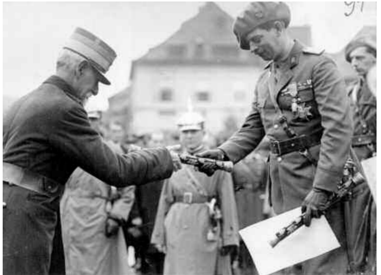
Regele Carol I al României, generalul Constantin Coandă și generalul Alexandru Averescu, alături de alți ofițeri ai armatei române

La Mănăstioara, dușmanul a opus foarte mare rezistență