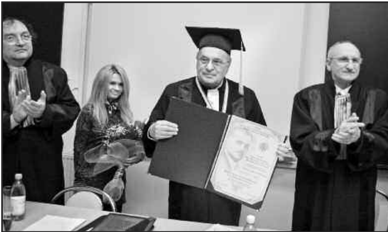
În 6 decembrie 2010, i s-a decernat titlul de Doctor Honoris Causa al Universității de Vest “Vasile Goldiș”, în cadrul unei festivități de răsunet organizată de Filiala din Satu Mare a universității arădene

După momentul favorabil de la începutul ei, pe parcursul creației și cu