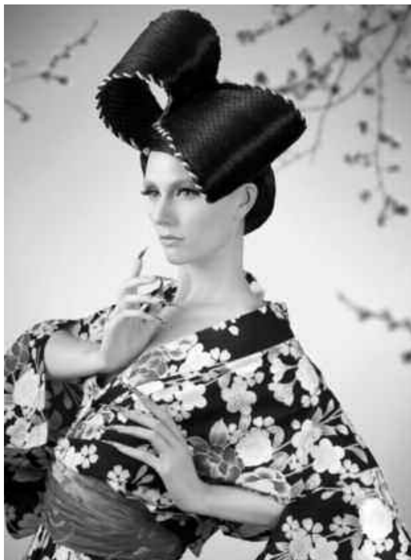
În China secolului 15, doar femeile din familiile regale își vopseau unghiile cu roșu și negru

În tot acest timp, în Egipt, cei din clasa superioară aveau oja de unghii dintr-o compoziție similară cu lacurile pe care le foloseau în pictură. Utilizau vopsele brun-roșcate din extracte de henna sau din pudră de petale de trandafir și orhidee. Unghiile colorate erau simbol al