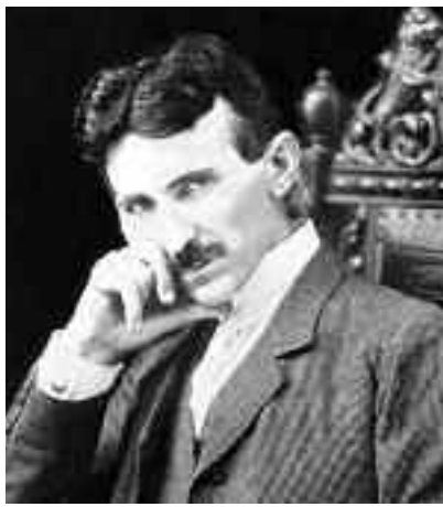
Geniul Tesla, originar din România, obișnuia să-și petreacă cea mai mare parte a timpului singur, deoarece, după cum a mărturisit, acest lucru îl ajuta să se concentreze

În 1904, Tesla scria că atunci când ideea sa va fi aplicată "Pământul se va transforma într-un creier uriaș, capabil să ră-