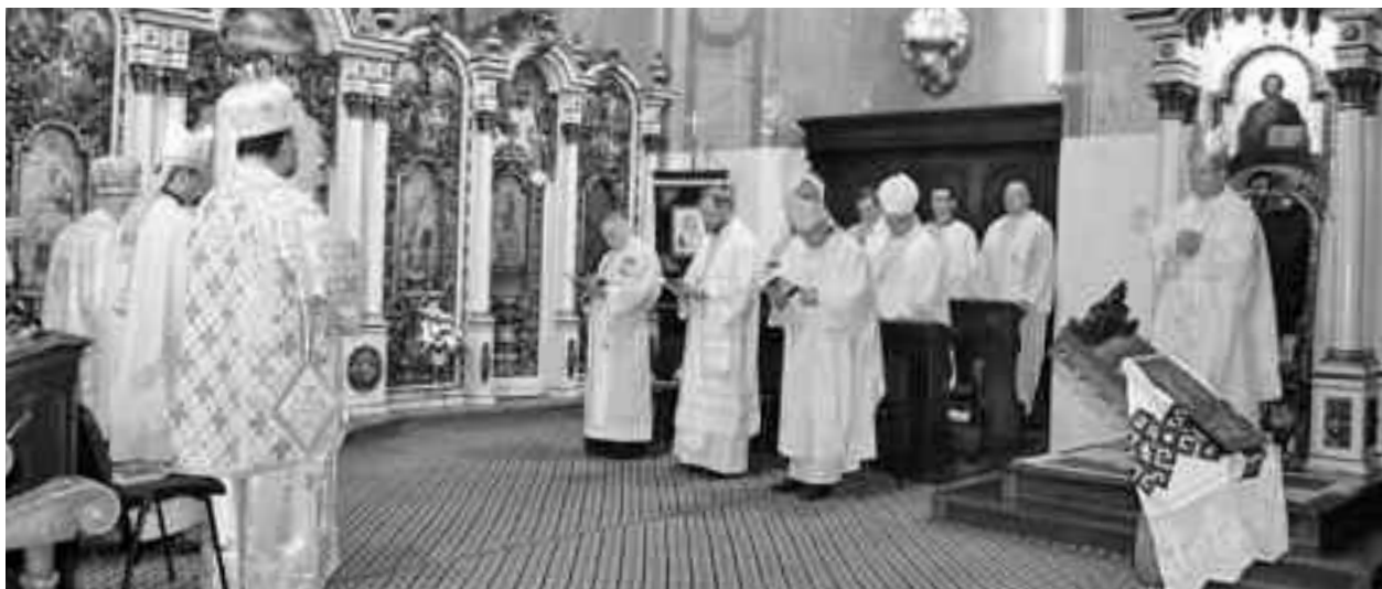
Conferința Episcopilor din România (CER) s-a desfășurat la Cluj Napoca

erori este dată de confuzia dintre natură și har divin, confuzie recurentă în contextul naturalist în care își au originea aceste practici. Negând transcendența unui Dumnezeu personal iudeo-creștin, se divinizează de fapt energiile create, imanente în această lume, și se ignoră totul despre harul supranatural cu adevărat divin.