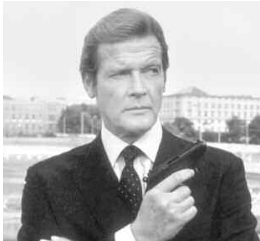
"Live and Let Die" (1973), primul său film ca James Bond, a avut mult succes

gam a anunțat acordarea de către regina Elisabeta a II-a a titlului de Cavaler al Imperiului britanic actorului Roger Moore. El a mai fost recompensat pentru serviciile sale în calitate de ambasador al Bunăvoinței pentru UNICEF, titlu pe care l-a deținut din 1991.