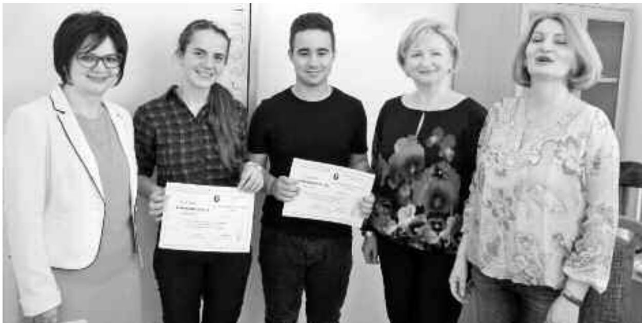
Școlile au prezentat revistele apărute în anul școlar 2016/2017

Liceal: „Universul copiilor” - Liceul Teoretic German „Johann Ettinger”. Gimnazial - Magazin: „File de poveste...” - Liceul Teoretic German „Johann Ettinger”; „CDIps” - Școala Gimnazială „Petofi Sandor” Livada - CDIș „Gimnazium” - Școala Gimnazială „George Coșbuc” Medieșu Aurit.