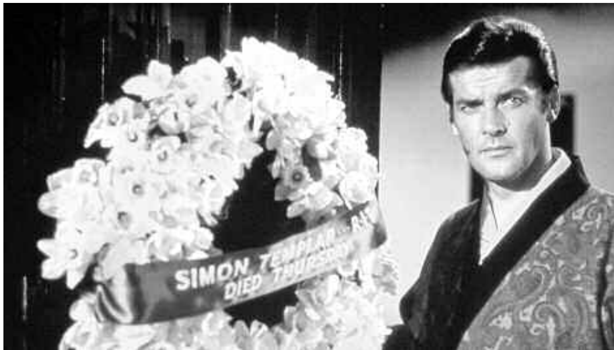
În 1962, a dat lovitură datorită rolului din "Sfântul". Serialul l-a transformat într-un superstar mondial, dar nu a reușit să câștige simpatia americanilor

Dorind să schimbe acest lucru, a decis să apară, alături de Tony Curtis,