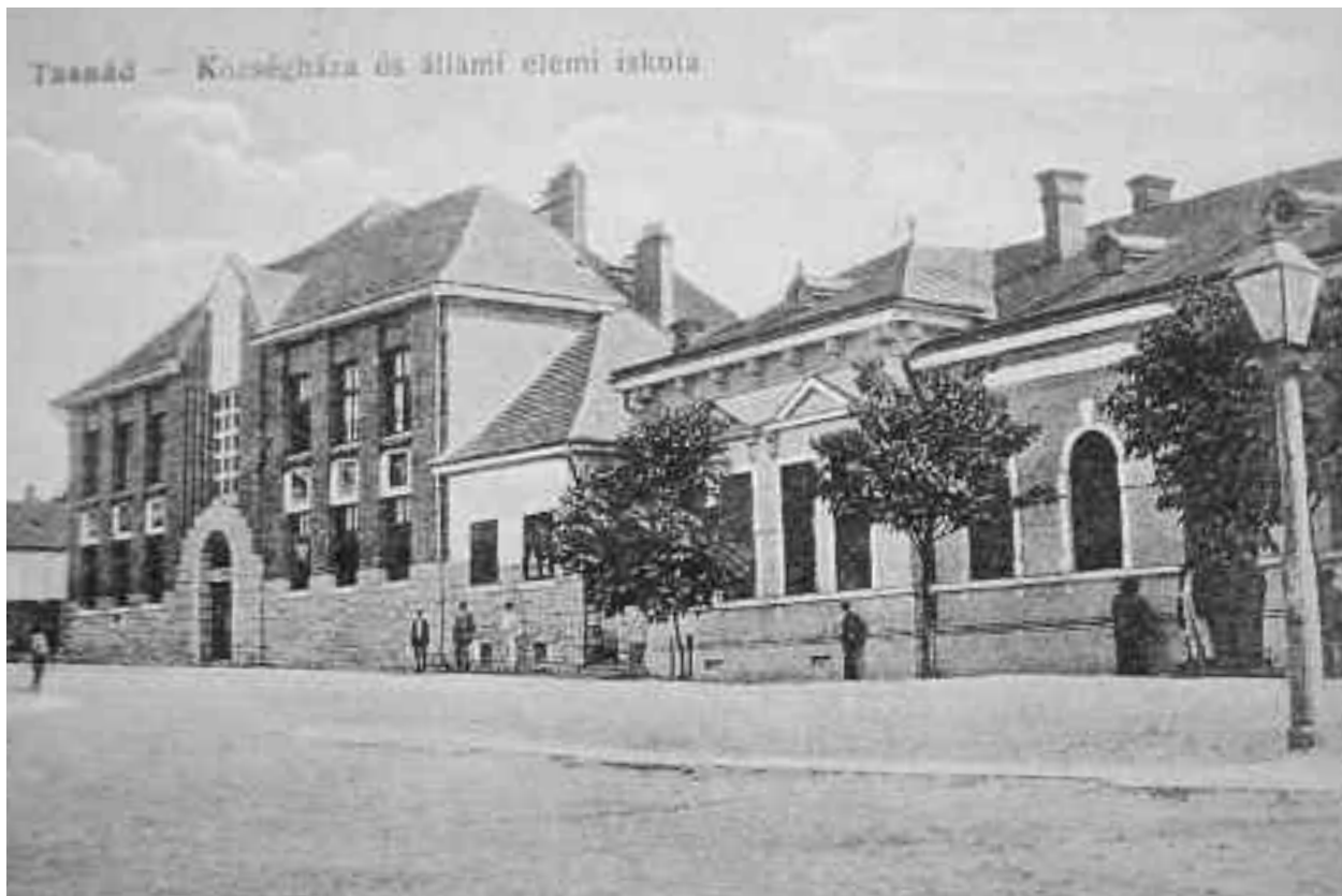
Imagine din Tășnad de la începutul secolului. Clădirea înaltă este sediul școlii elementare

La început de secol XX, conform recensământului populației din anul 1900, localitatea Tășnad avea o suprafață de 4.906 jugăre. Numărul populației a crescut mult în cei 20 de ani, respectiv de la 3.375 locuitori, cât avea localitatea la recensământul din 1880, la 4.274 locuitori în 1900. Numărul de case crește și el la 731. După limba maternă, 687 locuitori se declarau vorbitori de limba română, 3.580 de limba maghiară, 2 germană, 2 slovacă și 3 alte limbi. După religie, 9 locuitori declarau că aparțin cultului ortodox, 989 cultului greco-catolic, 1.314 romano-catolici, 1.341 reformați, 10 evanghelici, un unitarian și 610 izraeliți. Observăm că din cele 77 persoane care se declarau vorbitori de limbă germană în anul 1880, mai erau doar două persoane. Probabil că și șvabii s-au declarat la anul 1900 ca vorbitori de limbă maghiară.